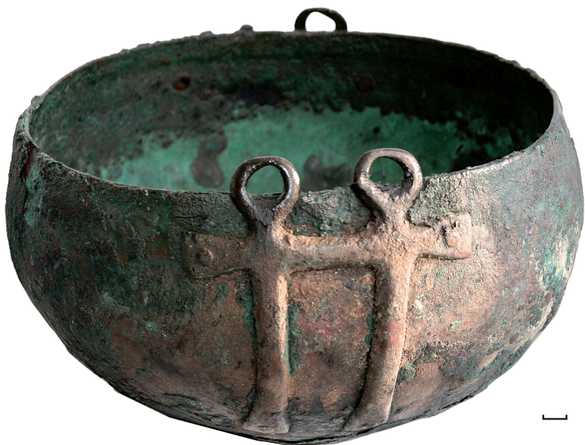
Світлогірське, с., околиці. Казан центрально- європейського типу. Бронза.