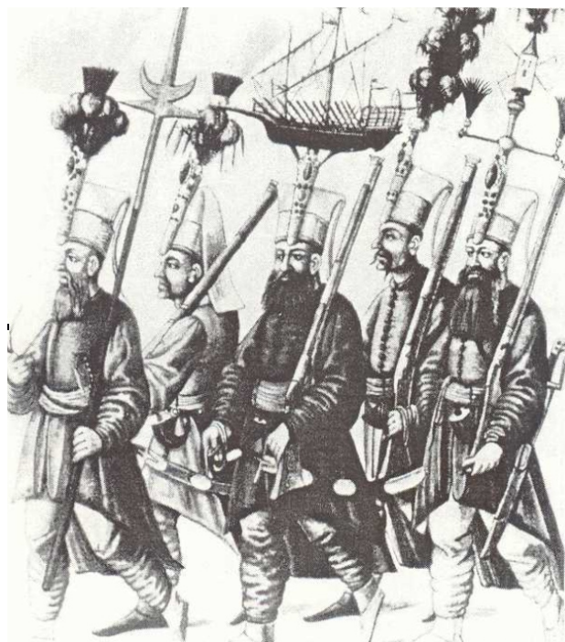
Малюнок 1. Яничари під час виконання ними церемоніальних функцій. До бьорків прикріплені спеціальні конструкції із макетами вітрильника (в центрі) та бапти фортеці (крайній праворуч). У кожного із зображених на малюнку яничарів – мушкет і шабля, у крайнього ліворуч ще й спис із кінцівкою спеціальної форми.

Комплект одягу яничара включав широкий каптан блакитного або синього кольору, верхній одяг – довга (до п'ят) долома з широкими рукавами, на яку ще й надягався плащ ( барані ). Крім того яничари носили вузькі шаровари та чоботи різного кольору залежно від їхнього рангу (вищі чини – жовті, старші офіцери – червоні, молодші – чорні). Яничарським чорбаджи (букв. «роздавальник супу», командир підрозділу) видавалось для пошиття шинелі сукно зеленого кольору ( собрамані ). Всім офіцерам яничарського корпусу комплект одягу видавався двічі на рік (літній комплект називався бахаріє , зимовий – земістаніє ) 5 . Найприкметнішою та ексклюзивною ознакою приналежності до яничарського корпусу були бьорки 6 , які тривалий час виготовлялись у спеціальній майстерні при яничарському корпусі.