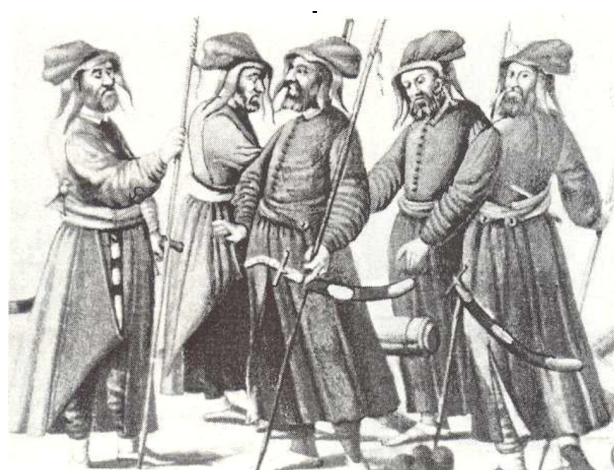
Малюнок 2. Османські гармати ( топчу ). Кожний озброєний шаблею та тримає у руці довгу тонку палицю із прикріпленим до неї трупом для запалювання гарматних запалів. У центрі малюнка фрагмент жерла гармати, біля якої складено ядра невеликого калібру.

Під час боїв кожному яничару видавали зброю – зроблений з рогу лук, комплект стріл,