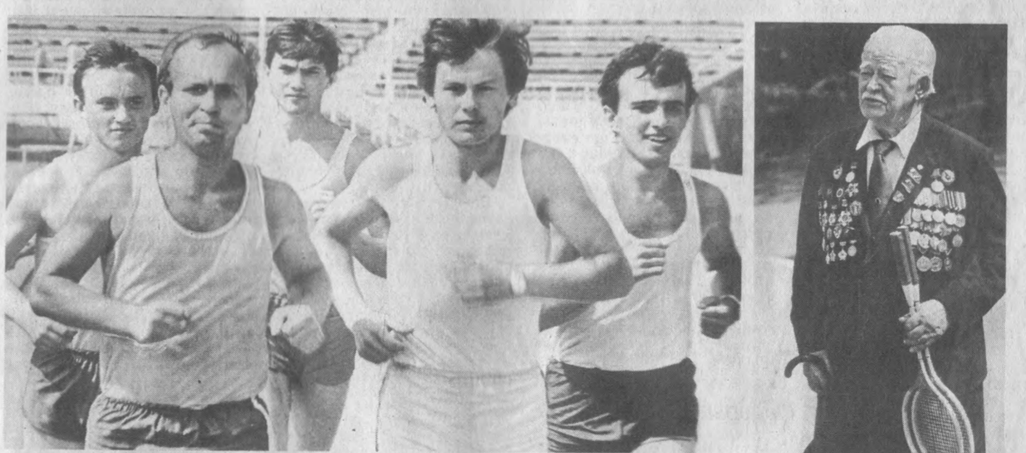
стиль роботи — дзеркало справ

28 червня, в День радянської молоді, з ініціативи Київських міських комітетів ЛКСМУ, спорткомітету і ради ДФСМ профспілок стадіоні столиці України стартували у країну здоров'я, сили й наснаги районних, Республіканському і стадіоні «Динамо» змагань представників спортивних клубів стіличних підприємств, колективів фізкультури. Агітаційно-пропагандистська естафета членів київських клубів любителів бігу завершилася на стадіоні «Динамо». Тут і забіг комсомольсько-молодіжних бригад. Замагався молодіжний перетягування канату, шахів, стрільби з пневматичних гвинтівок. На Республіканському стадіоні столи чекали любителів настільного тенісу, майданчики — футболістів, волейболістів, бадмінтоністів, лидарів «залізної гри». Отак велика спортивна база столиці України святкувала День молоді. Але це не було святом у традиційному розумінні слова. Відбувалося залучення юнаків і дівчат до здорового способу життя, отже, до фізкультури. Взяли участь у змаганнях мав змогу кожен. На жаль, цих «кожних» було ще мало. І на доріжках, і на трибунах. Тим, проте, й ціна ця ініціатива комсомольських і спортивних працівників, що вони не зробили показову фізкультурно-спортивну виставу, а розпочали копітку, важку роботу з систематичного навчання молоді науки здоров'я. Тим більше, що подібні свята плануються тепер кожної суботи й неділі. І не тільки на стадіо-