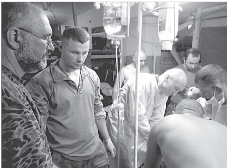
Бригада Львівського ВМШ за роботою