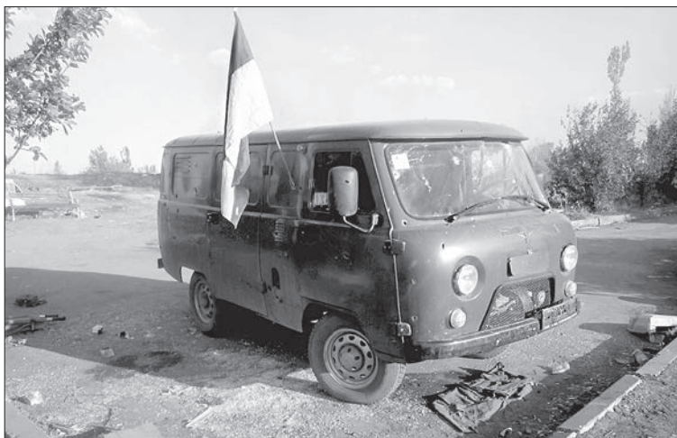
Той самий «Буцефал»

Те влучання викликало масу епітетів у тих, хто курив у шлюзі. Після того як я перший виліз нагору, то відразу помітив дивні зміни в навколишньому ландшафті. Зазвичай справа від входу стояли купи носилок, притулені до ящиків із землею та бруствера, що захищав бункер від дороги на Луганськ (звідки нас час від часу обстрілювали, намагаючись вибити). Так от, їх не було, як не було ні згаданого вище феншуя, ні ящиків із землею, ні самого бруствера (висотою десь до півтора метра). З правого боку було видно лише поле і дорогу метрів за сто. Натомість зліва, десь в 20 метрах, стояв наш УАЗік і пара носилок, які дивним чином опинились так само акуратно притуленими до УАЗіка, так, наче їх не взривом відкинуло, а хтось узяв та просто переставив... дива та й годі!