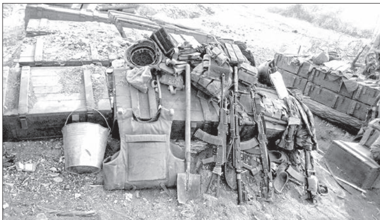
Опорняк у посадці

Переночувавши в бункері, ми з Ігорем повернулись на ранок у Хрящувате. Там у лісосмузі, на знайомій нам трасі біля села, ми знайшли опорний пункт.