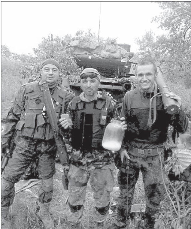
Самурай, Зола та Грізлі (зліва направо)

шизами), яка означала, що тим залізякам, які летять із російської «арти», абсолютно посрати на твою особисту крутість і звитягу! І що навіть якщо ти бувалий / досвідчений чи бухий в зюю воїн, потомствений козак-характерник чи схилений на контрстрайке страйкболіст, що краще за всіх все знає, бо пройшов усі левели «кол оф дьюті» — залізний осколок знесе тобі макітру або кінцівку, незважаючи ні на що.