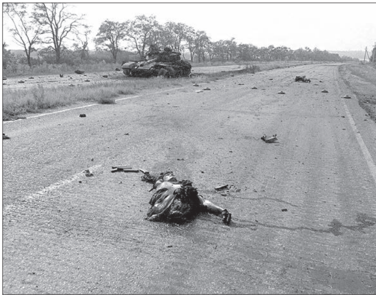
Півтанкіста з того самого танка

То еще ощущение, когда ты классный парень и наученный танкист из Тольятти, а твою супербыструю и крепкую российскую броню сжигают добровольцы из «Айдара».