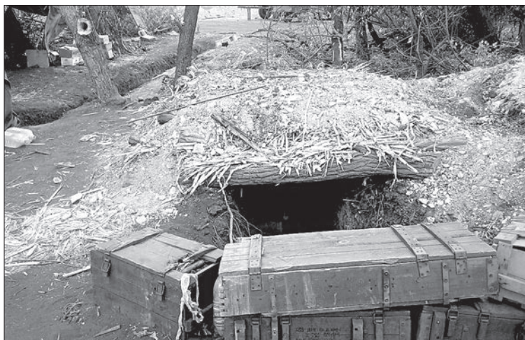
Норка на «Титані»

Наші помешкання на «Титані» — вір-окоп з тентом і норка для «сусліка».