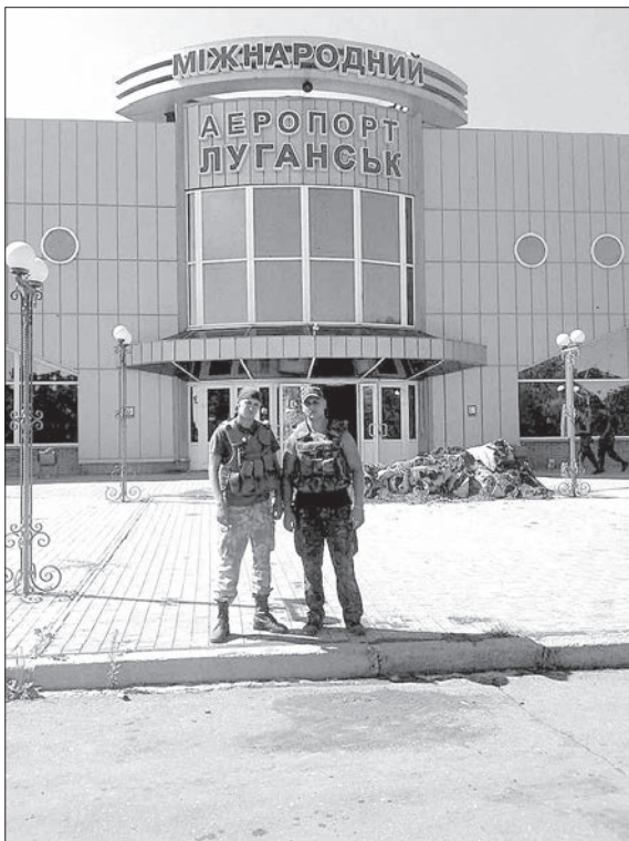
Таким аеропорт був спочатку