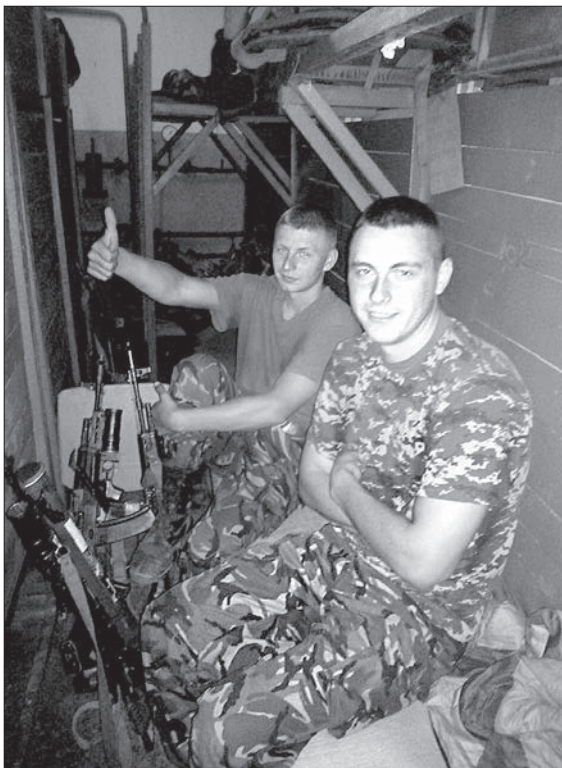
Десанти в середині нашої спільної оселі

Таки, як казав Наполеон, війна — то череда випадкових подій, що приводить до перемоги, або поразки... то вже кому як. Але навіть ті події створюєш собі сам, бо здебільшого воно виглядає як монотонне існування в погано пристосованих для життя місцях. Так було й на аеропорту.