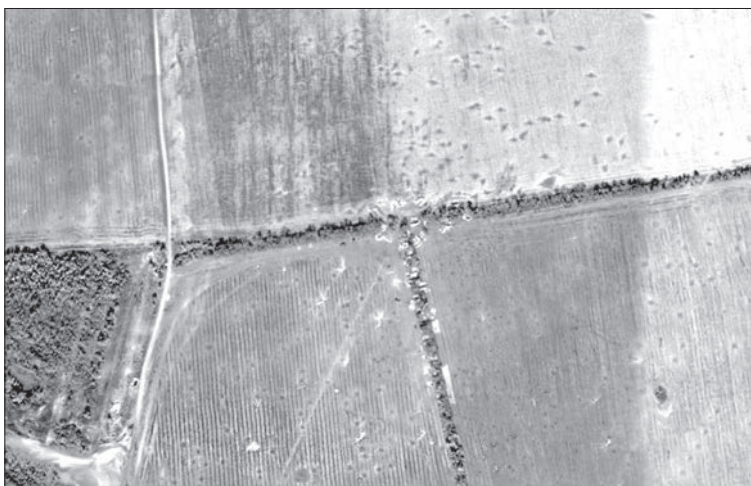
Позиція «Титан» (крапки на фото — воронки від артобстрілів)

— Той, коли ми прийшли сі, тут ніц не було. Ані теї ями (бліндажа). Ані чим копати. Тіко сепари, наче зайці, бігали по кущах. То взагалі диво, що ми живі! — розповідав мені розвідник.