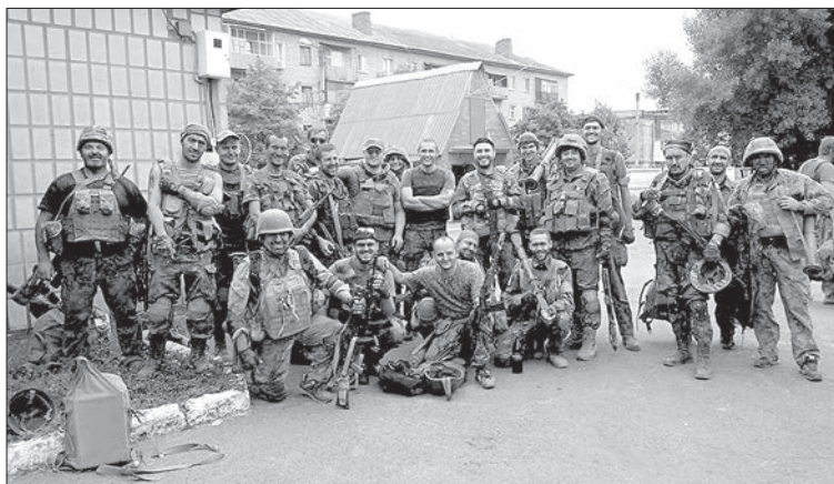
«Айдар». 2014 рік