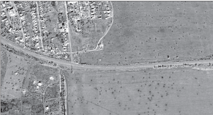
Селище Хрящувате (крапки на фото — воронки від артобстрілів)