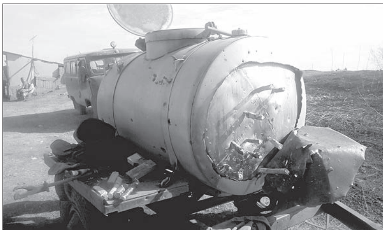
Відремонтована бочка — вершина інженерно-конструкторської думки