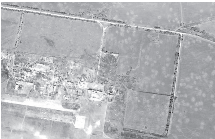
Луганський аеропорт (крапки на фото — воронки від артобстрілів)

Для непосвященных — «Защитники от уккров-фашистов» е...ашат по своим же городам «смерчами» с фосфорными зарядами. Хрящеватое и Новосветловка уже уничтожены «защитниками». Счастье на очереди?