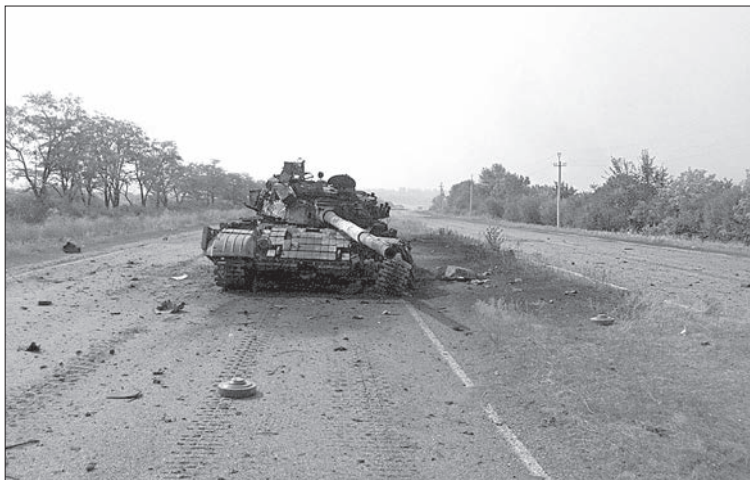
Танк, що вискочив на Сорокового

Коли людина кидає виклик танку — це водночас і захоплює, і моторошно. Величезний залізний монстр проти створіння в десятки разів меншого і слабшого — нерівнішого протистояння не придумаєш. Але в певні моменти