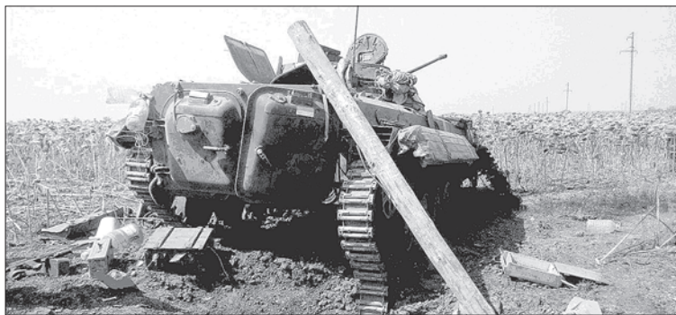
Та сама підірвана «беха» 24-ка ОМБР

— Заміновано, дорогу заміновано... — проноситься вздовж «змія». Біжу наверх, бачу розворочений зад «бехи», злетівший набік трак і розкиданих навколо хлопців. Хлопцям пощастило, що вони сиділи зверху та вибухом їх просто порозкидало. Обійшлись, слава Богам, переломами та контузіями. А ще пощастило тому, що поїхали додому раніше, ніж «змій» встиг залізти в пекло, де інколи навіть заздрили пораненим... Санінструктор 24-ки відмовляється від нашої допомоги, хлопців грузять в якусь з машин і відправляють до бункера в аеропорт.