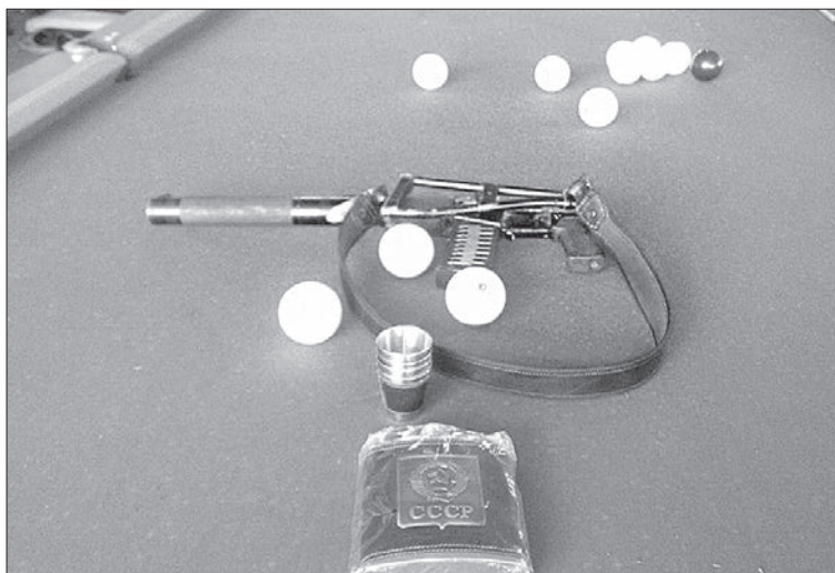
«АС ВАЛ» — трофей з Хрящуватого

Та й получивши по зубах, вони більше не наважувались на лобові атаки... Принаймні до Дня Незалежності. Але про то потім. І якщо хтось скаже, що там були лише «ватние» ідіоти з Луганська — тобто «шахтьори і калхознікі», то я до того розумника запитаюсь: «А звідки в тих «шахтьоров» взяли «АС ВАЛ» калібру 9×39, якими я особисто грався, як «трохфеями» наших хлопців?»