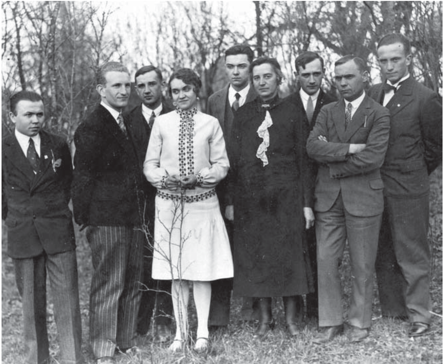
Зліва праворуч: невідомий, Роман Шухевич, невідомий, Наталя Шухевич, Юрій Березинський, троє невідомих, Юрій Шухевич. 1930 р.

концепція провадження визвольної боротьби, опертої тільки на власні сили українського народу. Ціла структура визвольно-революційного фронту, створена в умовах важкого протистояння з могутнім ворогом, цілковито себе виправдала. Це стало найбільшим успіхом Головного командира, і цей успіх — найкращий та найтривкіший пам'ятник для нього.