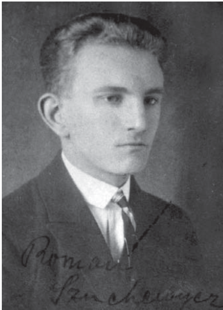
Фотографія зі студентської справи Романа Шухевича, 1926 р.

на колінах різьблений в камені св. Антоній. Потім розходила-ся наша п'ятка в різні сторони, насторожена, обережна» 50 .