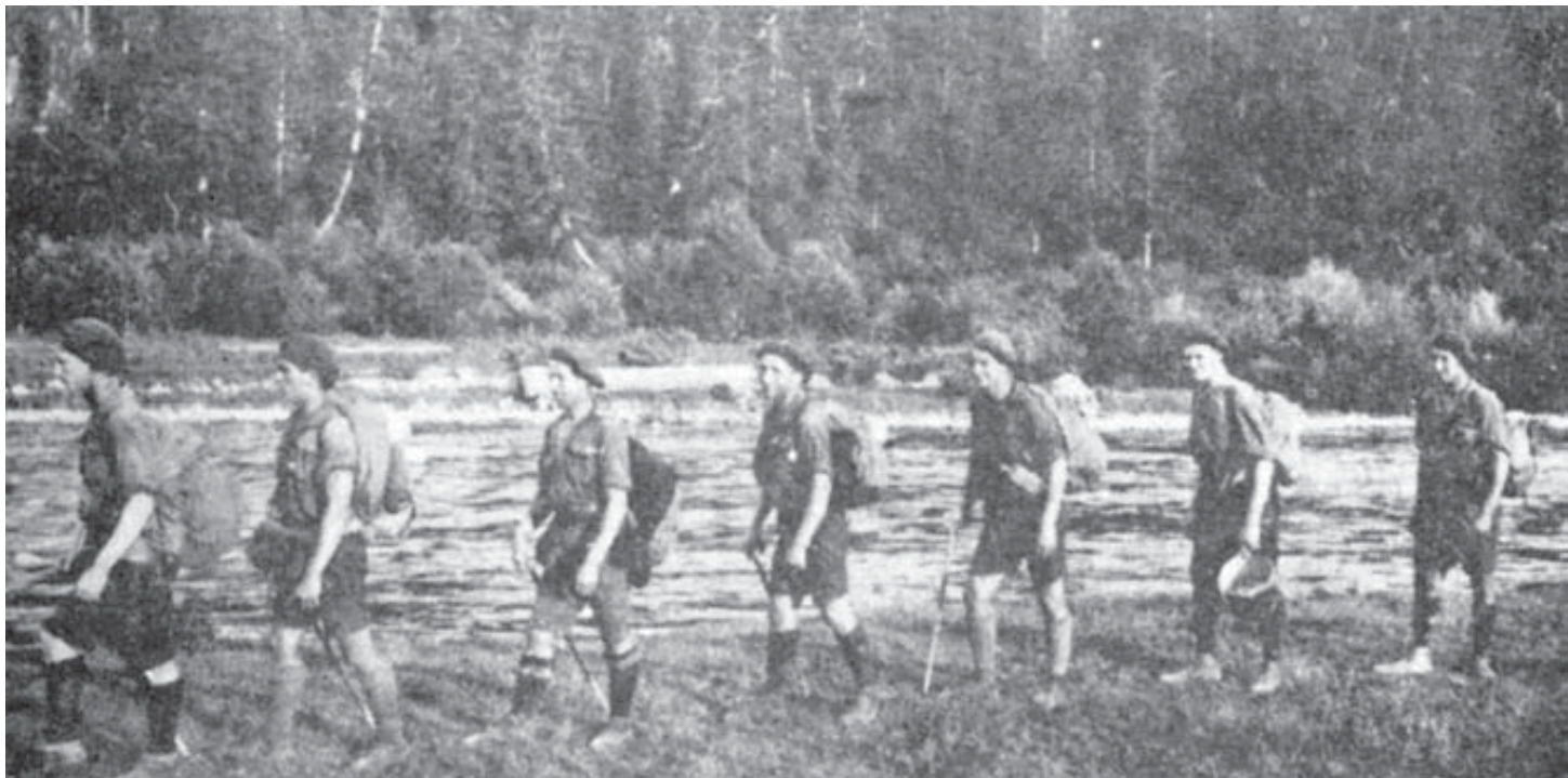
Старший пластун Роман Шухевич (перший зліва) у мандрівці

З друзями-«чорноморцями» він долучився до розвитку української військово-морської традиції через організацію морського пластування та військових вишколів, проплив на човнах усіма великими ріками Західної України: Дністром, Західним Бугом, Серетом, Стирем і Збручем. Сильний наголос ставив Р. Шухевич на мандрівки не тільки територією Галичини, а й Волині, таким чином поширюючи пластові ідеї й там 75 . У листопаді 1929 р. у складі «Чорноморців» він разом із пластунами Романом Раком, Анатолем Яросевичем, Петром Галібеєм та Євгеном Полотнюком створили спортову секцію 76 .