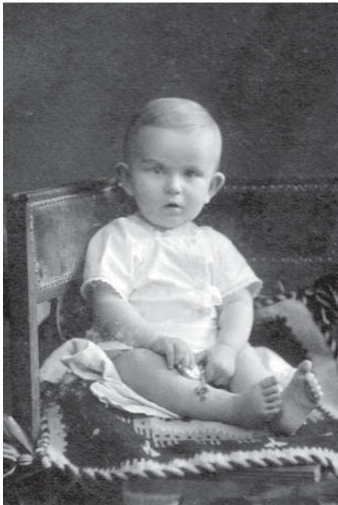
Роман Шухевич, 1908 р.