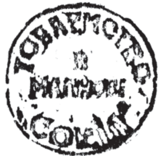
20. Печатка товариства «Сокіл» у с. Малнові. 1930 р.