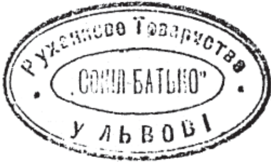
17. Печатка товариства «Сокіл-Батько» у Львові. 1931—1939 рр.

редки товариства «Сокіл» на печатках мали малюнки. Переважно це сокіл, повернений праворуч або ліворуч з гантеллю в кігтях. До прикладу, таке зображення є на печатці товариства «Сокіл» у Під-