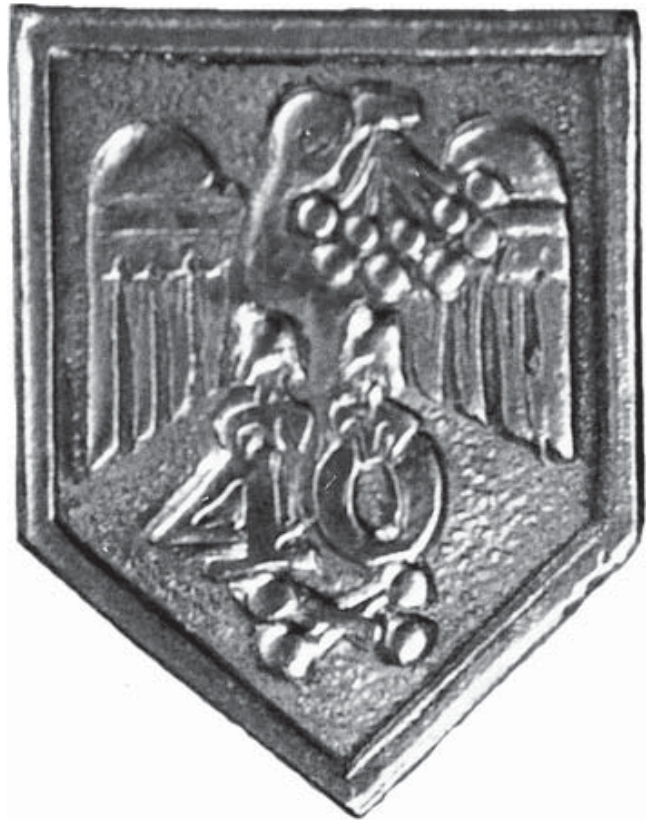
10.1. Відзнака, випущена з нагоди 40-ліття товариства «Сокіл-Батько» у Львові 1934 р.

Їх не завжди можна встановити. У 1934 р. з нагоди 40-ліття існування «Сокола-Батька» у Львові Павло Ковжун розробив три відзнаки (ілюстрації 10.1—3). Перша — щит з білого металу, розміром 20x25 мм, а на ньому птах — сокіл, що тримає в дзьобі кетяг червоної калини, в кігтях — число «40». Під числом — пара гантелей навхрест. Друга відзнака, для учасників у здвигових вправах, мала такий вигляд: у круглому щиті з врізами (розміром 30x23 мм) зображено сокола. Ці дві відзнаки розійшлися у кількості 8 тис.