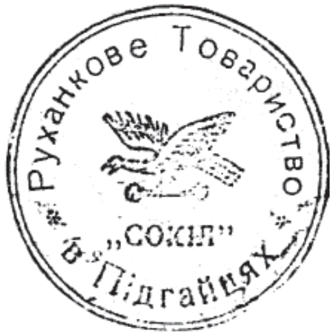
18. Печатка товариства «Сокіл» у с. Підгайці. 1928—1929 рр.

редки товариства «Сокіл» на печатках мали малюнки. Переважно це сокіл, повернений праворуч або ліворуч з гантеллю в кігтях. До прикладу, таке зображення є на печатці товариства «Сокіл» у Під-