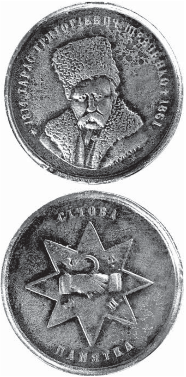
8. Медалі товариства «Січ». 1914 р.