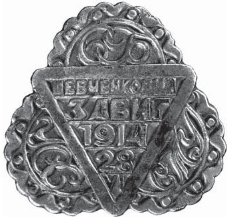
7. Відзнака Шевченківського здвигу у Львові 28 червня 1914 р.