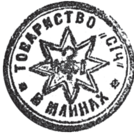
13. Печатка товариства «Січ» у с. Млини. 1913 р.