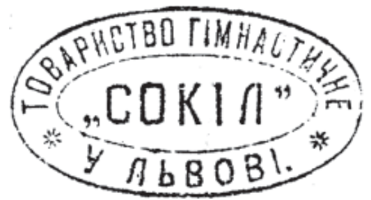
15. Печатка гімнастичного товариства «Сокіл» у Львові. 1894 р.

г) Відбиток чорнильний, круглий (діаметр 42 мм). Без малюнка. Легенда: «“Сокіл-Батько” Львів». В центрі печатки напис: «В. В. В. В.» (сокільське гасло «Все, вперед! Всі, враз!»). Дата відбитка — 1925, 1927, 1928, 1930 рр. 68 (ілюстрація 16);