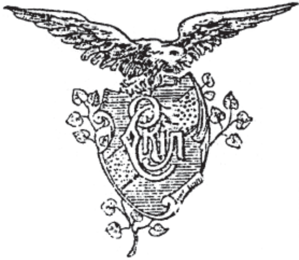
4. Емблема товариства «Сокіл» у Львові. Початок ХХ ст.

з деякими відмінностями та особливостями був сталий для всіх слов'янських сокільських організацій, у тому числі для чехів 26 , поляків 27 та ін.