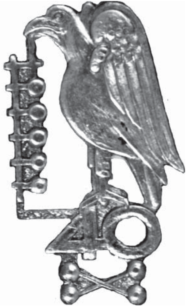
10.2—3. Відзнаки, випущені з нагоди 40-ліття товариства «Сокіл-Батько» у Львові 1934 р.

штук. На третій відзнаці, для руховиків-змагунів, був зображений лише сокіл — без щита 54 .