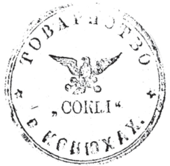
19. Печатка товариства «Сокіл» у с. Конюхи. 1910 р.

Окрім прапорів, відзнак, печаток українських молодіжних організацій заслуговують на увагу однострої з відповідними нашивками та відзнаками. Досліджуючи їх, слід звертати увагу на час та умови, в яких запроваджено однострій, його авторів та вжиток.