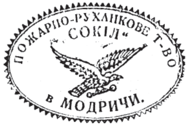
11. Печатка товариства «Сокіл» у с. Модричі. 1929 р.

На печатках товариства «Січ» використовувалося січову емблему в різних варіантах. Перший варіант — дві руки в потиску, які тримають серп. Другий — те ж саме зображення, але вже з восьмипроменевою зіркою. Перший варіант бачимо на печатці Головного січового комітету 58 (ілюстрація 12), другий — на печатках осередків товариств