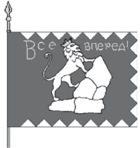
3. Прапор товариства «Сокіл-Батько» у Львові