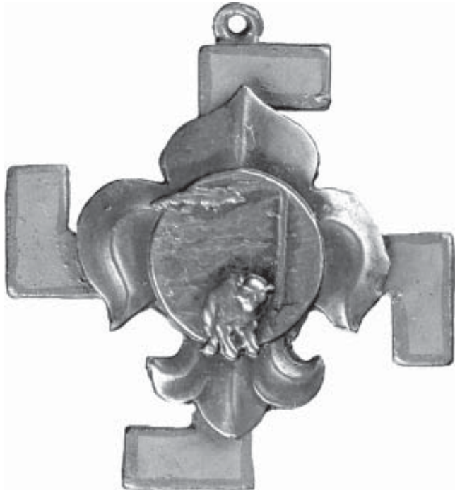
9. Пластова «свастика вдячності»

нагороджували лише за «заснування нових куренів, їх взірцеве ведення і підтвердження пластового духу у важких обставинах» 46 .