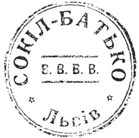
16. Печатка товариства «Сокіл-Батько» у Львові. 1925—1930 рр.