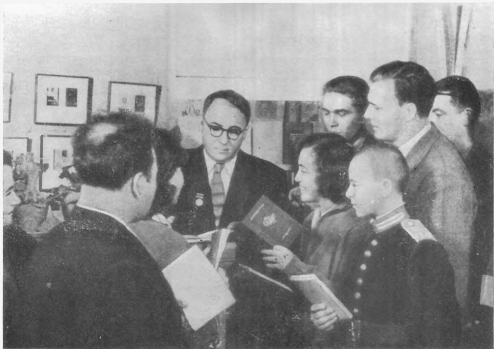
В. Сосюра серед читачів. 50-і роки.