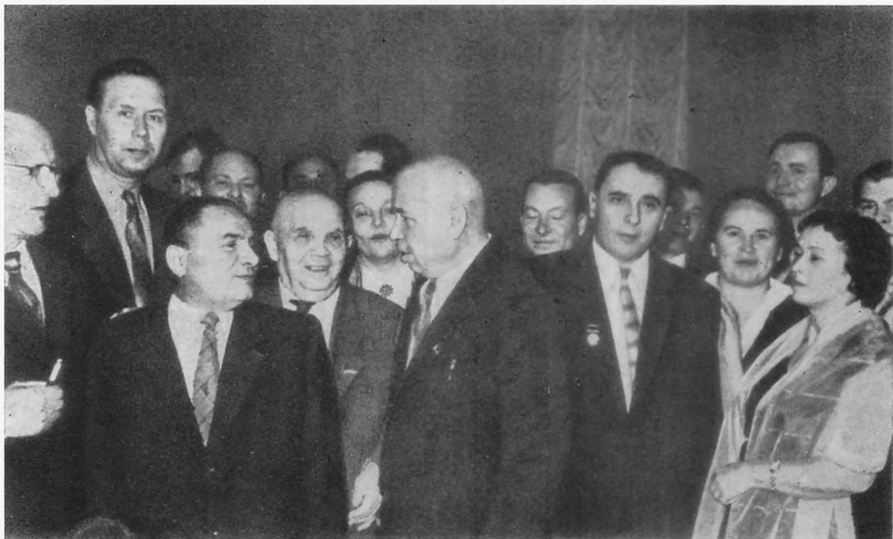
В. Сосюра серед діячів культури. 1958 р.