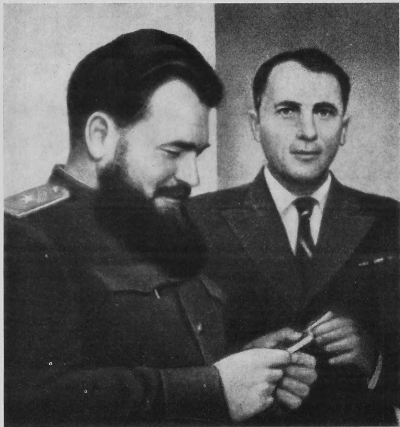
В. Сосюра та П. Вершигора.