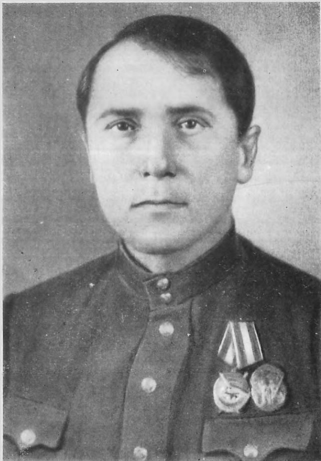
В. Сосюра. 1944 г.