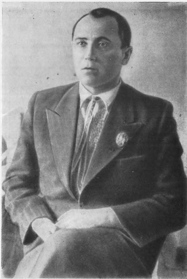
В. Сосюра. 1939 г.