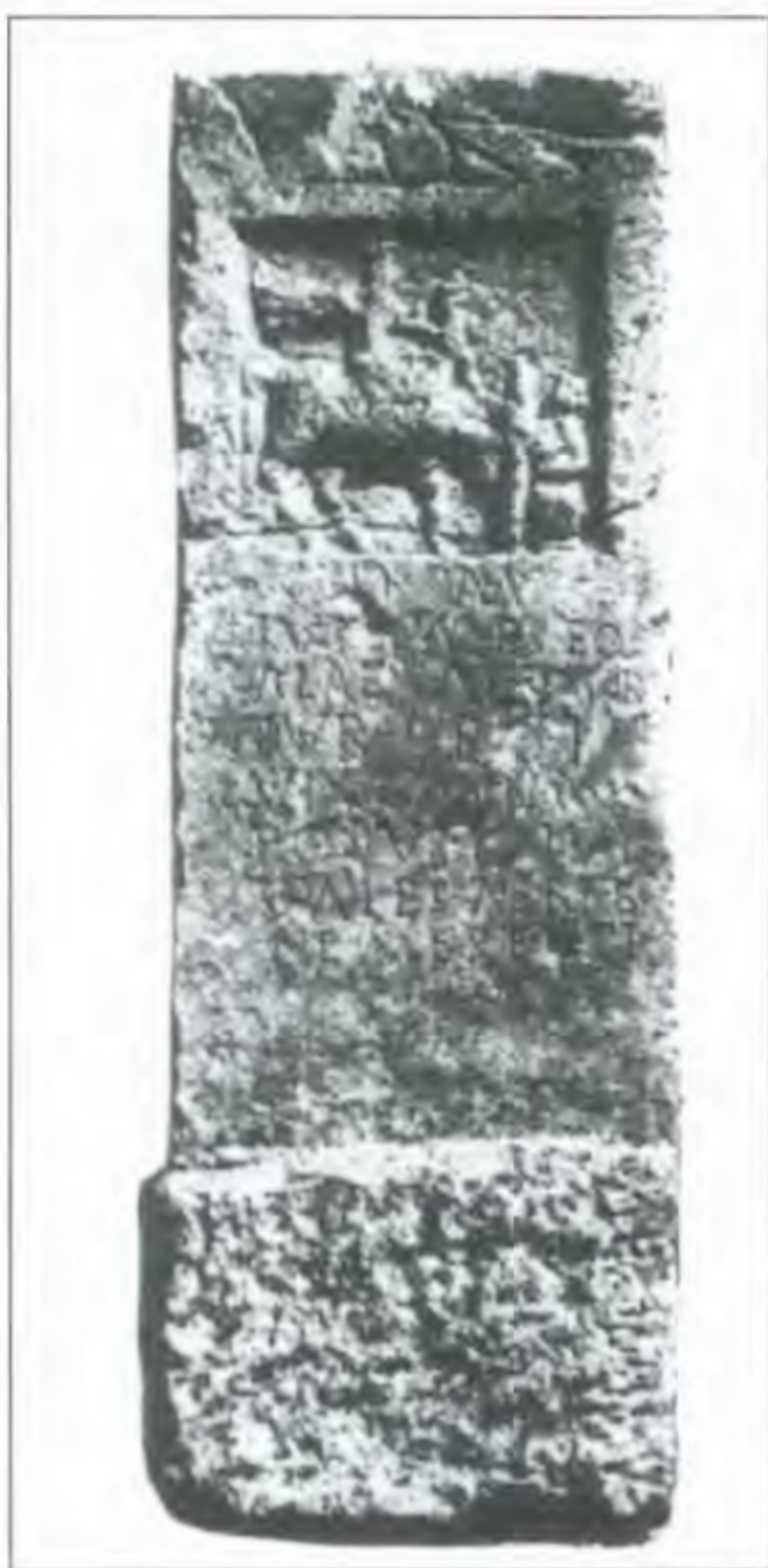
Надгробок кіннотника I али Атекторигіани з території сучасної Балаклави

Спочатку римська залога Херсонеса складалася з військовиків V Македонського легіону 11 . У другій половині 60-х рр. II ст. цей легіон