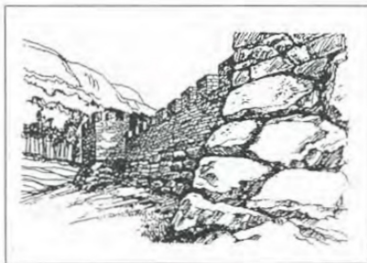
Оборонні мури Харакса. Реконструкція К. Орлова