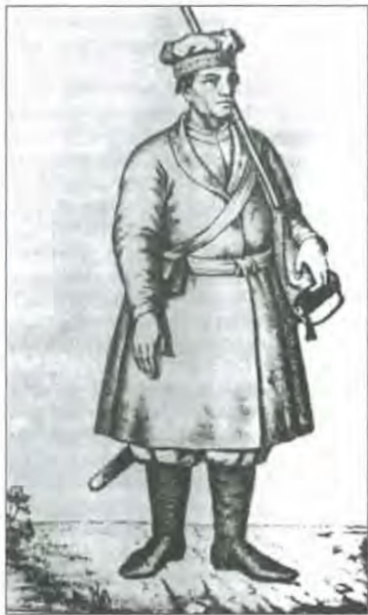
Т. Калиновський. Тип однострою виборного козака. 1760-ті рр.

дів для його виготовлення й зберігання або принаймні належну кількість грошей на відповідні закупівлі.