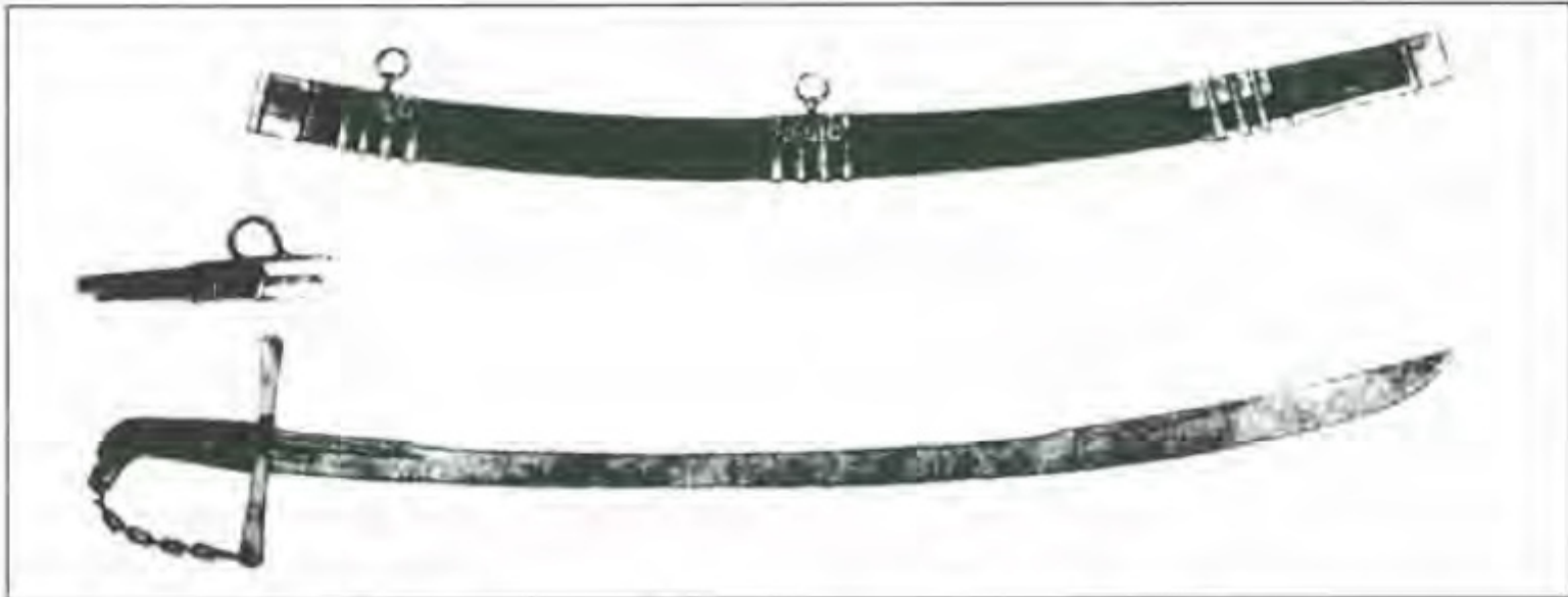
Шабля угорсько-польського типу. XVII ст.