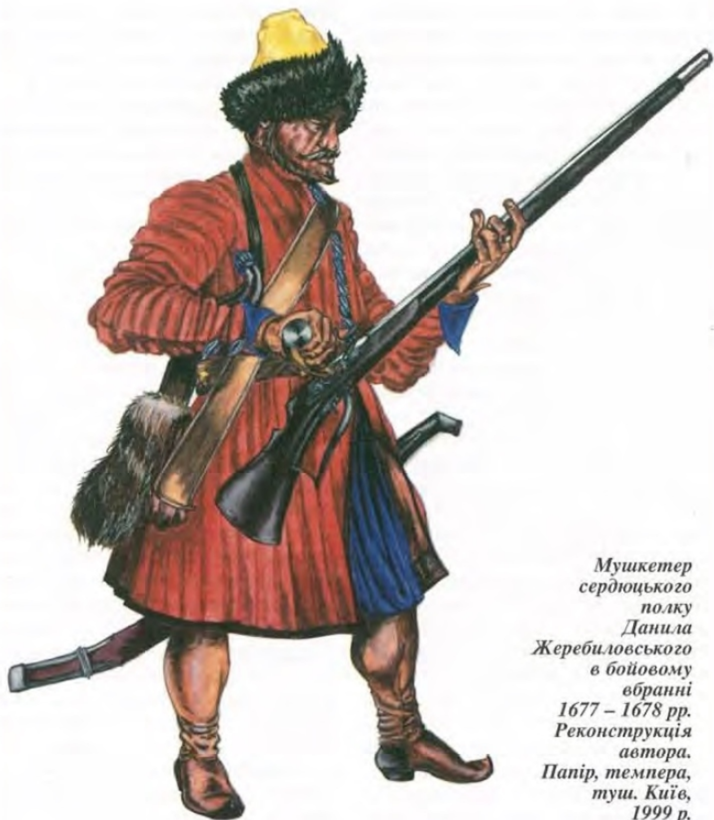
Мушкетер сердюцького полку Данила Жеребиловського в бойовому вбранні 1677 – 1678 рр. Реконструкція автора. Папір, темпера, туш. Київ, 1999 р.

московского дела, по 2 пары соболей, по 15 рублей пара человеку”, у 1690 – 1692 рр. „по атласу мерою по 11 аршин, да по паре соболей, по 10 рублей пара человеку”, у 1692 р. „по байбереку немецкаго дела, мерою по 10 аршин, по 2 пары соболей, по 15 рублей пара человеку”, у 1695 р. „по бархату, по объяри струйчатой золотной, по атласу, по 3 пары соболей, по 10 рублей пара челове-