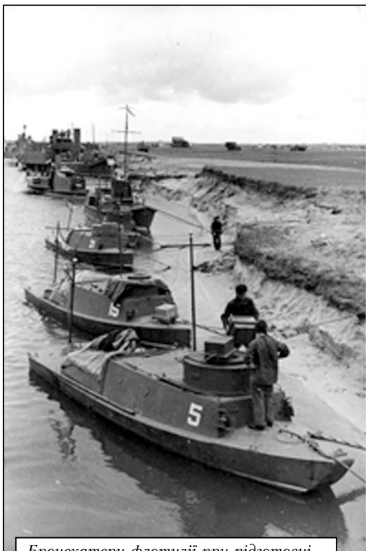
Бронекатери флотилії при підготовці до чергового бою

Пінська військова флотилія (ПВФ) підпорядковувалася безпосередньо наркому ВМФ, а в оперативному плані – командувачу військами Західного особливого військового округу. Завданнями флотилії було визначено: при прориві оборони противника і появи в смузі Західного Бугу і Вісли сприяти військам 4-ї армії у форсуванні річок; прикривати переправу; підтримувати