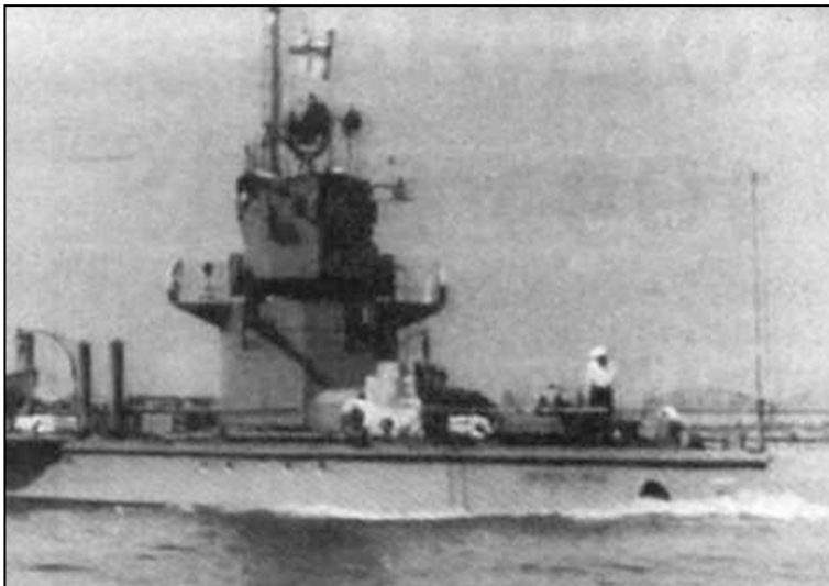
Монитор «Флягин» на параді з нагоди святкування Дня ВМФ 24 липня 1939 р.