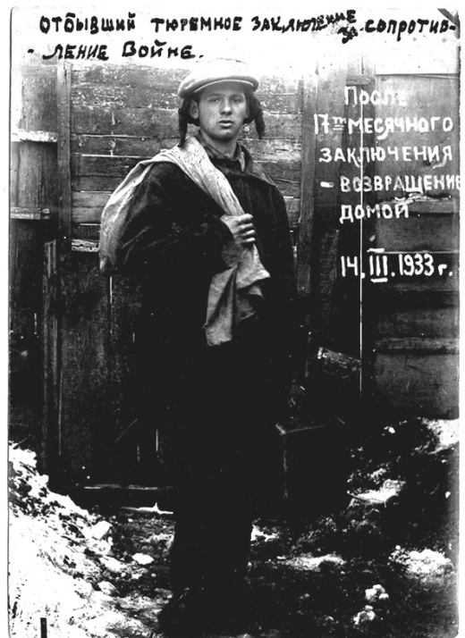
Іл. 3. «Отбывший тюремное заключение за сопротивление войне».