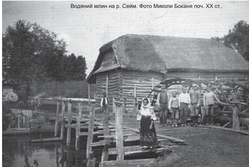
Водяний млин на р. Сейм. Фото Миколи Боканя поч. ХХ ст.

Пролити світло на життєвий шлях та внутрішній світ Миколи Боканя допомагають автобіографічні записи, збережені у архівно-слідчій справі фотографа, що була розпочата після його арешту у 1937 році органами НКВС. Гортаючи її сторінки, дізнаємось, що Микола Бокань народився 4 квітня (за старим стилем)