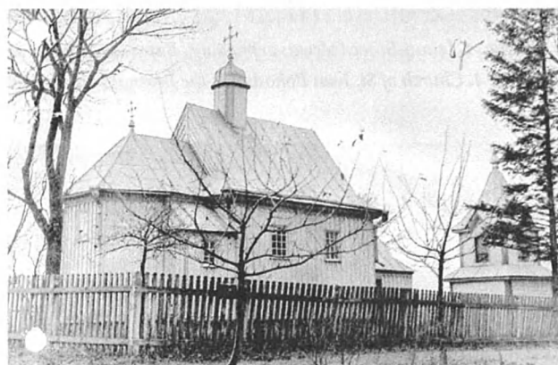
Рис. 2. Івано-Богословська церква в с. Бармаки, 1773 р. Загальний вигляд з північного сходу, 1959 р. [9, арк. 67]