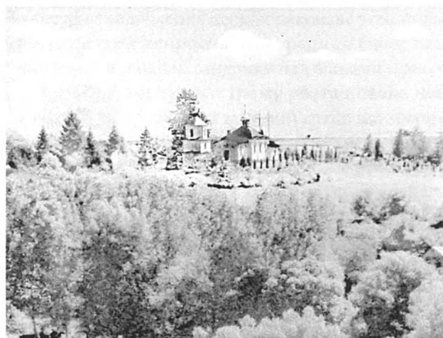
Рис. 1. С. Бармаки Рівненського району. Загальний вигляд. Фото автора, 2018 р.

За поданням М. Теодоровича, в 1866 р. здійснювався ремонт тодішньої дерев'яної церкви 5 . Тому можна припустити, що саме в цей період була