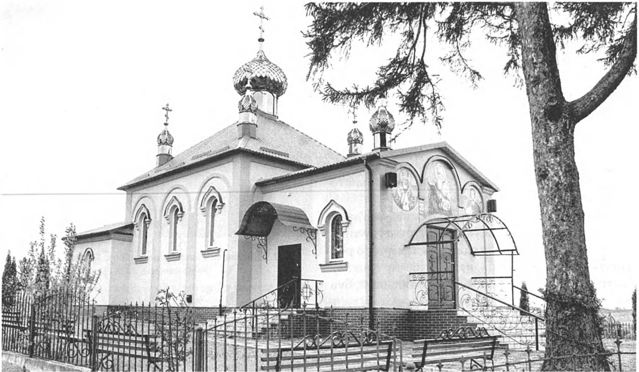
Рис. 4. Івано-Богословська церква в с. Бармаки, 1990 р. Загальний вигляд з північного заходу. Фото автора, 2018 р.