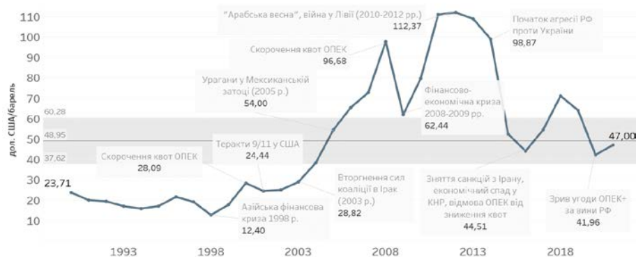
Середньорічні ціни на нафту сорту Brent у 1990-2020 рр. та прогноз на 2021 р., дол. США/барель

Джерело даних: The Economist Intelligence Unit (2020).