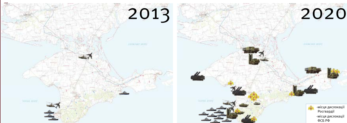
Мілітаризація Кримського півострову (2013-2020 рр.)

вою частиною. Триває переозброєння зазначених ЗРК сучасними ракетами, на бойове чергування поставлено нові ракетні установки. Вже зараз російські зенітні системи контролюють більшу частину Чорного моря, а ракети класу «поверхня-поверхня» покривають його цілком.