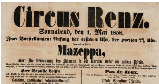
Рис. 1. Афіша до пантоміми «Заслання Мазепи в Україну» Цирку Ренца. Тиснення, папір, друк, 1858 р. Зібрання Музею історії міста Лейпцига, Німеччина.

Однак, 200 років тому галузь розвивалася дещо інакше. Циркове дійство було більше схоже на театральну виставу, де актори виконували свої ролі без слів, у вигляді пантоміми. Основою програм були кінні шоу, на яких демонстрували майстерності верхової їзди, кінної дресури та гімнастики. Їх доповнювали виступи клоунів та акробатичні трюки. Для музичного супроводу відомі цирки мали власні оркестри. Всю теплу пору циркові трупі гастролювали. Постійні арени вони мали у великих європейських містах, де виступали і тренувалися взимку та готували нові програми.