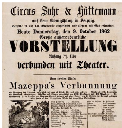
Рис. 2. Афіша до пантоміми «Заслання Мазепи» Цирку Сура та Хюттемана. Тиснення, папір, друк, 1862 р. Зібрання Музею історії міста Лейпцига, Німеччина.

тизму твори про гетьмана України Івана Мазепу набули небаченої популярності, його ліричний образ почали використовувати і у циркових шоу. За основу, майстри розважального жанру, взяли сюжет поеми «Мазепа» англійського поета-романтика Джорджа Байрона. Тому на циркових аренах український гетьман постав юним козаком, якого через стосуки із заміжною польською пані, на спині дикого коня відправили в український степ. Це шоу протягом ХІХ століття стало справжньою класикою серед циркових пантомім та виконувалося колективами різних країн і різними мовами. Доказами цьому є збережені афіші циркових вистав.