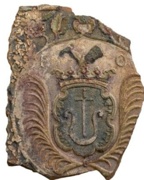
Кахля пічна з родинним гербом Орликів «Новина» та ініціалами «F.O.», XVIII ст. Знайдена у 2018 р. під час археологічних досліджень садиби Пилипа Орлика в Батурині, в якій народився і зростав Михайло Орлик. Зібрання Національного заповідника «Гетьманська столиця».

У 1724 р. у Салоніках розпочалась інфекційна хвороба, яка передавалася повітрям. Епідемія швидко поширювалась і насторожила П. Орлика. Він неодноразово звертався до місцевого муля (ім'я не відоме), щоб отримати дозвіл виїхати з сином за місто. Дуже