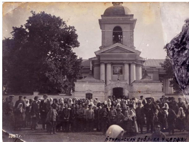
Жителі Батурина біля Воскресенської церкви-усипальниці К.Розумовського, 1907 р.

Беззаперечно, такі фото – цінні носії інформації, збереження, вивчення та популяризація яких є невід'ємною частиною роботи заповідника. Створення електронного каталогу цих світлин – це сучасна форма збереження, зумовлена, по-перше, реальною загрозою їх втрати через війну, по-друге, він спрощує пошук і зручний у користуванні, оскільки вся потрібна інформація зібрана в одному місці, відтак робота з ним передбачає мінімальне використання часу. Окрім того, такий вид роботи з музейними предметами виключає фізичне втручання у колекцію, що позитивно відобразиться на її збереженні. У подальшому буде здійснена каталогізація всієї збірки фото заповідника.