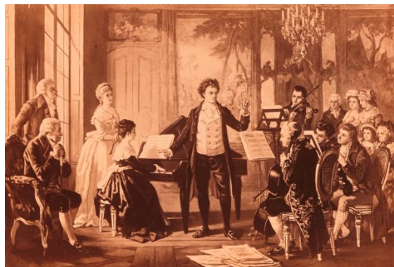
Бетховен і квіртет Розумовського. З картини художника А. Боркмана. Видане Фотографічним товариством у Берліні в 1880–1890 рр.

Життєвий шлях Андрія Розумовського тісно пов'язаний з гетьманською столицею Батурином. Саме Андрій Розумовський по смерті батька-гетьмана в 1803 р. отримав у спадок промислові підприємства Батурина, палацово-парковий ансамбль, та володів цим спадком впродовж 33-х років свого життя.