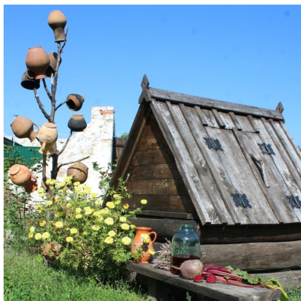
В експозиційному просторі музейного комплексу «Козацький двір». Фото 2023 рік.

Також використовували в кулінарії й цукровий буряк, який значно збагатив смакову палітру солодкого. Його терли, запікали в печі та відтискали сік, який додавали в тісто для різноманітної ви-