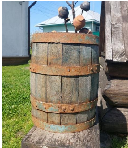
Бочка для пива. Експозиція Музейного комплексу «Козацький двір». Національний заповідник «Гетьманська столиця».

Настоянки готуються довше. Для їх виготовлення брали переважно вишні, аличу, абрикоси або сливи-«венгерки». Сулію або банку потрібно засипати ягодами, які вам подобаються, «по самі ві-