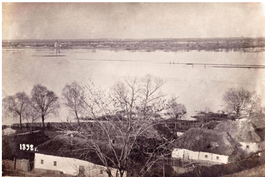
Батурин, 1898 р.

Офіційною датою винаходу фотографії вважають 1839 рік. За більш ніж 180 років змінилися технології і способи виготовлення фотографій, але не змінилося бажання людини зупинити мить, тому фотографія міцно увійшла у повсякденне життя суспільства. Вона відіграє важливу роль у поширенні знань і культури. Однією з найцінніших функцій фотографії є фіксація історії.