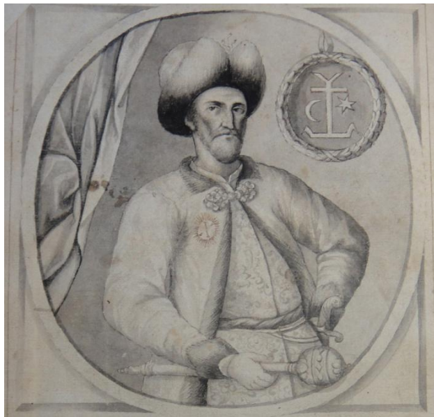
Гетьман Іван Мазепа. Самійло Величко, «Літопис», 1720 р.

І справді, Іван Мазепа був особистістю світового масштабу! Ним захоплювалися, присвячували твори відомі зарубіжні й вітчизняні поети та прозаїки такі як