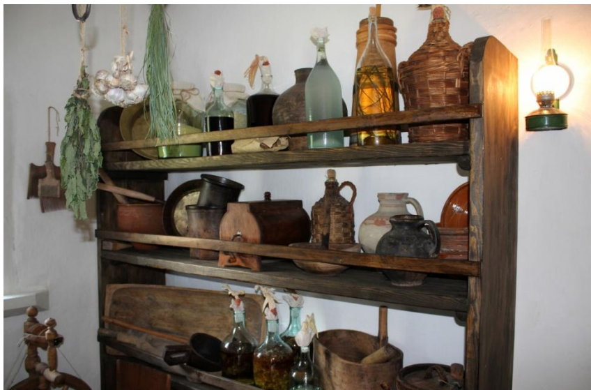
Експозиція Музейного комплексу «Козацький двір». Національний заповідник «Гетьманська столиця».

Ще з гетьманських часів популярним у Батурині й вживання пива, яке виготовляли з ячменю, хмелю й солоду, іноді з ячмінно-просяної суміші. Ремісники-пивовари звалися броварями,