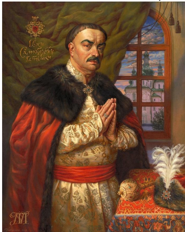
Гетьман Іван Самойлович. Наталія Павлушенко, 2022 р. Зібрання Національного заповідника «Гетьманська столиця»

цьовують досвід відтворення об'єктивного образу та зовнішнього вигляду історичних постатей. Спільно із фахівцями Київського музею воскових фігур було здійснено реконструкції зовнішностей 15 очільників Гетьманщини. На думку дослідників, для створення сучасних зображень гетьманів варто використовувати не лише прижиттєві портрети, а й усю силу творчої уяви, яка здатна відтворити образ цієї особистості виходячи з фактів та подій його біографії. Аналізуючи збережені портрети гетьмана Самойловича та виконуючи запит заповідника, Наталія Павлушенко успішно відтіла спільний задум