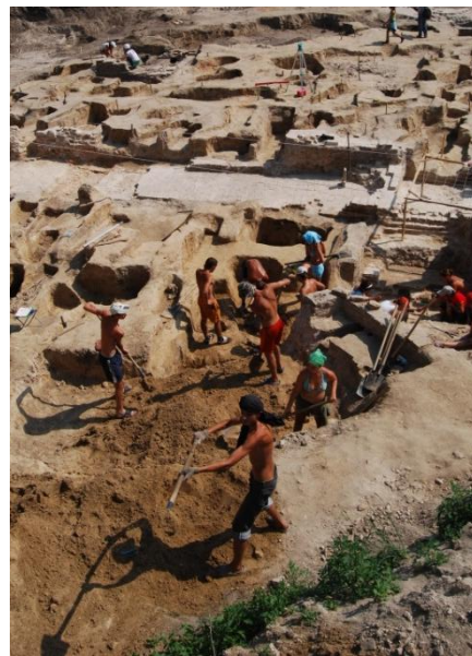
Батуринська фортеця: дослідження церкви Живонавальної трійці. 2008 р.

Тривалий час увагу археологів привертала пошуки садиби ще однієї знакової особистості для української історії – Пилипа Орлика, автора першої у світі Конституції. Спроби дослідників мали успіх восени 2015 р. Хоч роботи на цій ділянці ще тривають, значна кількість кахлів з гербами Пилипа Орлика та гетьмана Івана Мазепи вже дозволяє точно локалізувати місце розташування будинку генерального писаря.