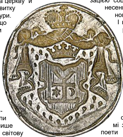
Печатка із зображенням князівського герба Івана Мазепи.

Самопали набивайте, Острих щабель добувайте, А за віру хоч умірте, І вольностей бороніте! Нехай вічна буде слава, Же през шаблі маєм права!