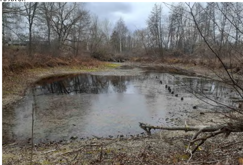
Залишки дубових паль від млина на лівому рукаві р. Сейм. Фото 2021 р.

В кінці 1952 р. водяні млини припинили свою діяльність у зв'язку з появою електродвигунів та будівництвом промислових млинів, а в наш час водяні млини замінили потужними борошномельними заводами.