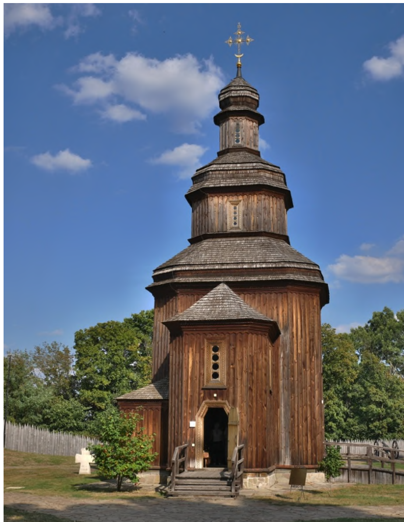
Відбудована церква Воскресіння Господнього на Цитаделі Батуринської фортеці. Фото 2018 р.

Який вигляд мала батуринська замкова церква? Можемо припустити, що вона була споруджена у тогочасних традиціях і належала до так званого «баштового» типу. Такі храми повторювали архітектуру зрубних оборонних башт і їхнього накриття. Найпевніше, у