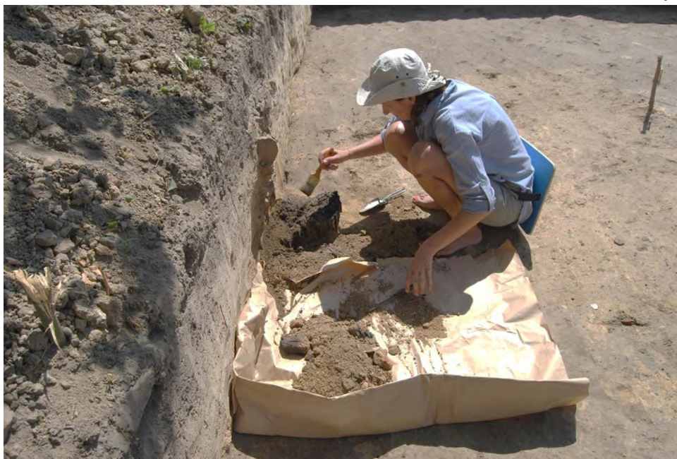
Археологічні дослідження садиби Пилипа Орлика. Фото 2018 року.

Наразі садиба Пилипа Орлика є надзвичайно важливою для історичної науки. Дослідження цієї пам'ятки вимагає від працівників Національного заповідника і учасників Батуринської археологічної експедиції не лише професіоналізму, але й ставить завдання пошуку фінансування проекту. Раніше розкопки обмежувалися ділянками приватної садиби, тому поки що вивчено близько 30% пам'ятки. Щиро віримо, що її подальше дослідження обов'язково продовжиться.