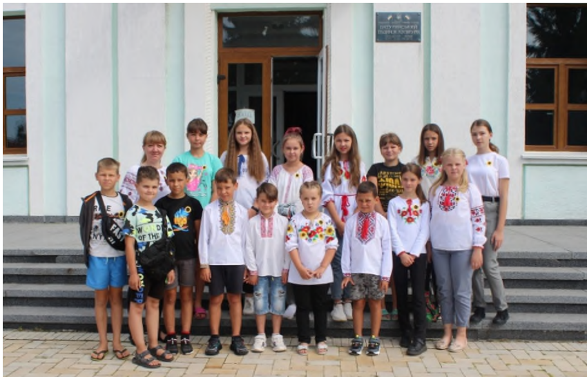
Культурно-просвітницький захід «Пам'ятаємо! Віримо! Переможемо!», 2022 р.

Отже, з радістю можемо констатувати, що, попри все, одна з головних цілей історичного гуртка «Батуринський канцелярський курінь» – виховання молодого покоління як свідомих громадян України, нами успішно реалізовується! Кожне заняття, кожна тема має значний патріотично-виховний потенціал, який формує впевненість в собі, віру в Перемогу, у свою націю, в свою Україну!