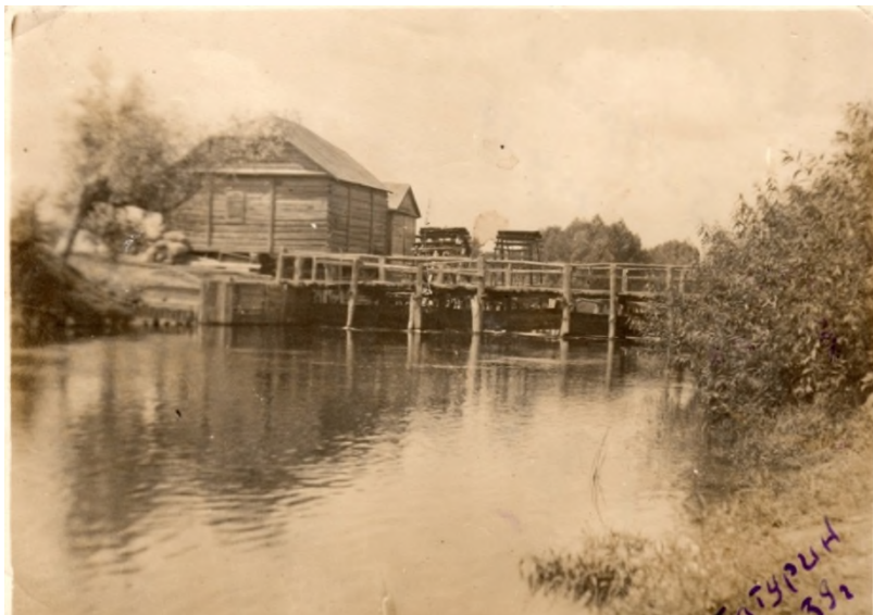
Млин на лівому рукаві р. Сейм. Фото 1939 р.

Поштовхом до розвитку млинарства був швидкоплинний Сейм. З XVII ст. на його швидких течіях почали будувати водяні млини. Особливий розвиток млинарства в Батурині припадає на часи гетьманства. Так, за гетьмана Івана Мазепи (1687-1708) їх налічувалося 33, а при Кирилу Розумовському (1750-1764) – 44 разом з валюшнями. Продовжив своє функціонування млинарський промисел як згадують місцеві старожили і в XX ст.