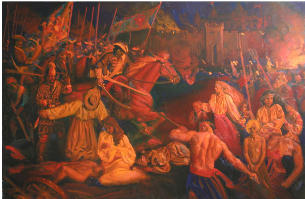
Івахненко А. «Різня в Батурині 1708 року», 2000 р. Зібрання Національного заповідника “Гетьманська столиця”

Зараз, коли Україна мужньо відбиває багатотисячну фашистсько-російську навалу, схиливши голову у жалобі по мужнім оборонцям та мирним жителям Батурина, що загинули у гіркому листопаді 1708 р., ми згадуємо також мужніх крутівців, петлюрівців, бандерівців, тисячі закатованих сталінським терором та замордованих голодоморами, шестидесятників, Героїв Небесної Сотні, Кіборгів, Азовців, Титанів, що захищають Бахмутський напярм і кожного українця, хто сьогодні своїми справами наближає велику Перемогу світу над силами рашистської темряви.