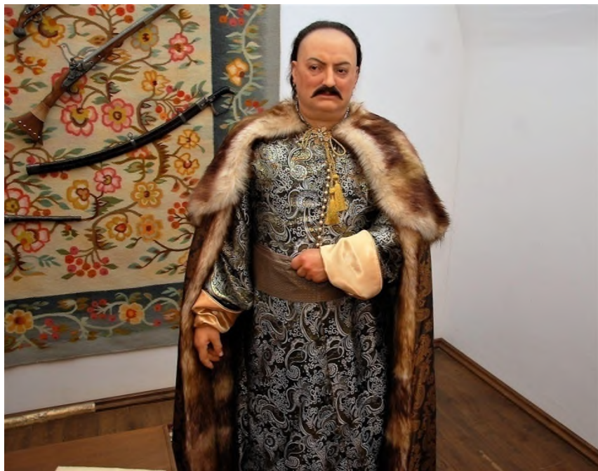
Гетьман Іван Самойлович. Наукова реконструкція зовнішності у воску, 2017 р. Зібрання Національного заповідника «Гетьманська столиця».

Після перемовин Іван Самойлович запрошував посланців на церковну службу, що становила частину дипло-