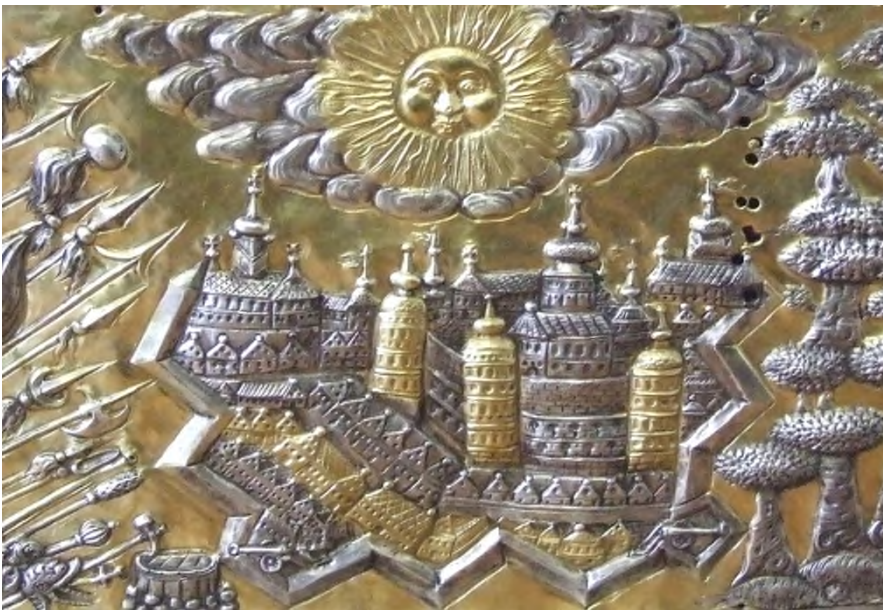
Зображення міста (Азова?) на шаті ікони Іллінської Богоматері, 1695 р.

Зображення кінця XVII ст. має певні недоліки, зумовлені можливостями автора розмістити на невеликому аркуші паперу значну кількість монастирських споруд. Але воно зроблене з натури, що підтверджується археологічними дослідженнями. Таким чином, лише зображення укріпленого Батуринського Миколаївського Крупицького монастиря можна вважати достовірним візуальним джерелом.