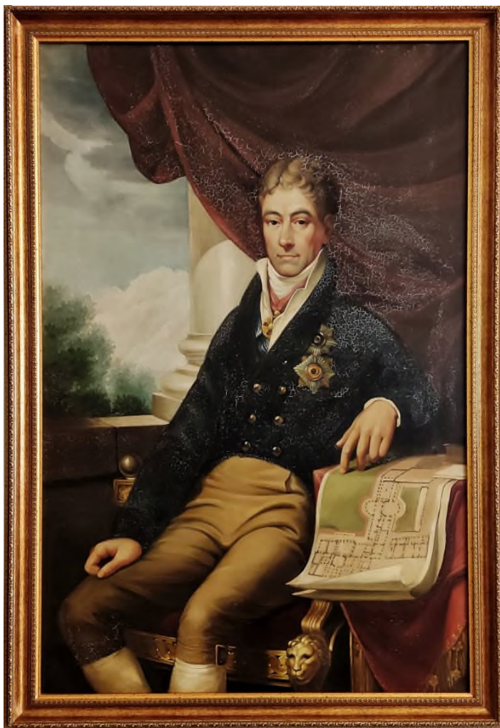
Андрій Розумовський. Художник Йоганн Лампі, ХІХ ст. Музей історії мистецтв, Відень.

познайомитися з традиціями народу, життям Батуринської економії. До прикладу, у листах Андрія до дружини ми знаходимо відомості, що кожної п'ятниці разом з батьком він відвідує церковну службу, постійно читає книги, зокрема Євангеліє.