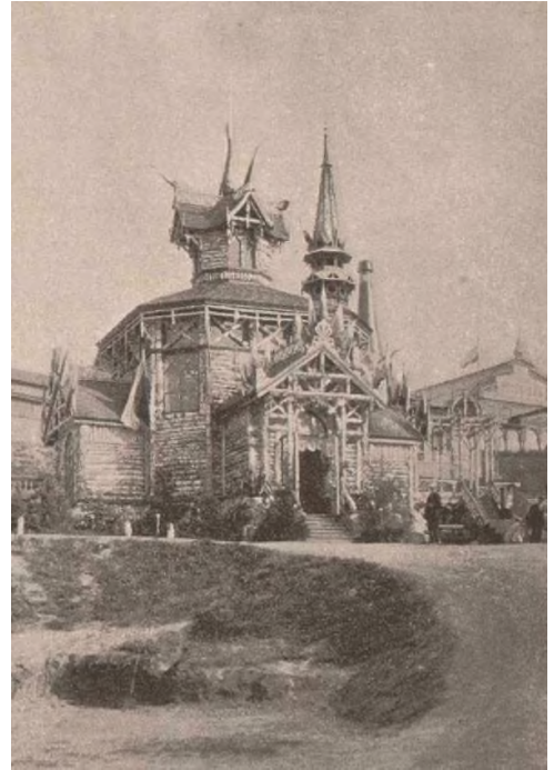
Павільйон Василя Кочубея на Київській сільськогосподарській і промисловій виставці, 1897 р.

Переймаючись проблемою укріплення схилів ярів, Старгутський маєток