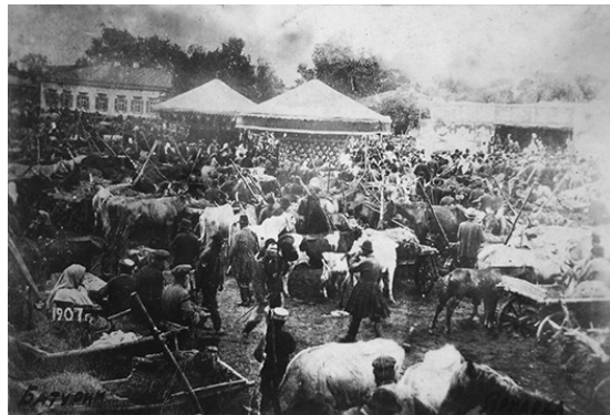
Ярмарок на Воскресенській площі Батурина. 1907 р.