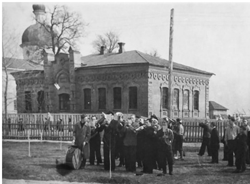
Парафіяльна школа Воскресенської церкви (1904 р.), середина XX ст.

Церковнопарафіяльні школи відіграли значну роль у розвитку початкової освіти у кінці XIX – на початку XX століття, виступаючи основним джерелом знань, навчаючи дітей грамотності, зміцнюючи християнську мораль. Парафіяльні школи були єдиним способом здобути грамоту сільськими дітьми.