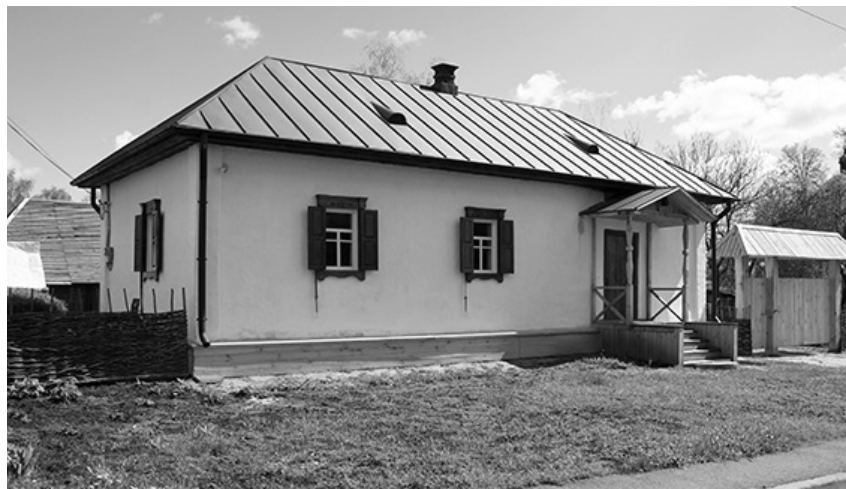
Хата музейного комплексу «Козацький двір», 10 травня 2021 р.