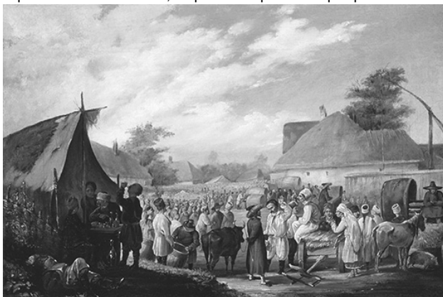
Ярмарок у містечку Ічня. Художник В. Штернберг (перша половина XIX ст.).

на українському ярмарку влаштовували каруселі. Наприклад, на Покровському ярмарку в місті Лубни, за описом Я. Забело, для ярмаркової публіки пропонували різні атракції, зокрема карусель. Її господар, словак за національністю, роз'їжджав по багатьох містах і ярмарках. За катання він брав плату – по 3–5 коп. з особи. Судячи з прибутку, який він отримував, народ велими любляв такий вид розваг. У Ромнах він заробив 300 руб., а от у Лохвиці – 6 руб. Батуринські ярмарки були не виключенням. На чорно-білій світлинці 1907 року, яка зберігається у фондовій колекції Національного заповідника «Гетьманська столиця», зображено ярмарок на Воскресенській площі Батурина. По центру бачимо дві каруселі з конусоподібними дахами, праворуч від них – підвищення з накриттям, напевно, сцену. Фото демонструє, що батуринські ярмарки супроводжувалися веселими розвагами та виступами акторів і музик.