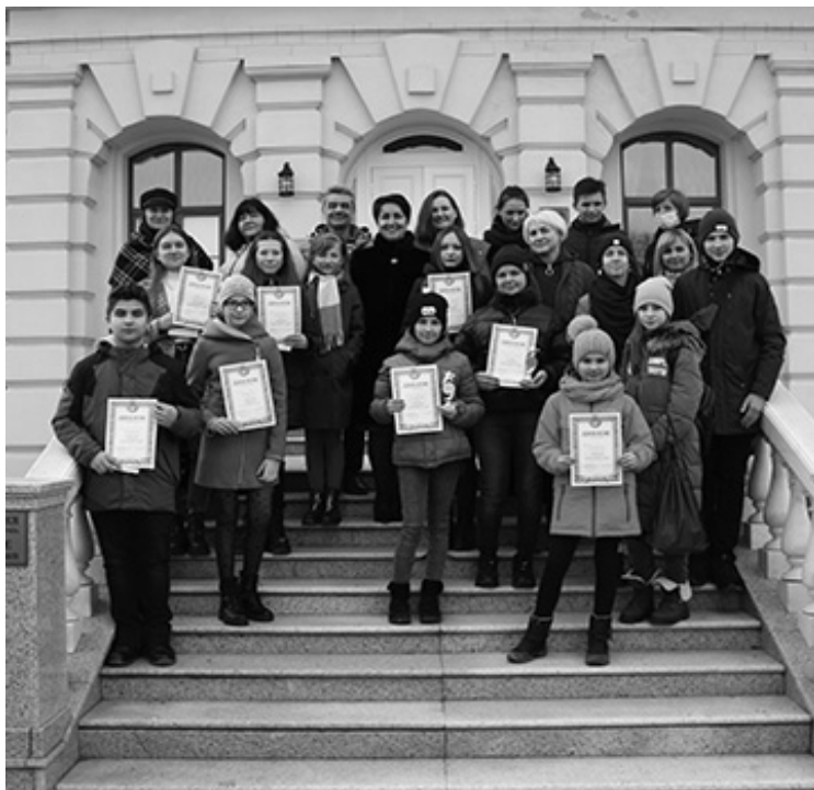
Учасники конкурсу «РозумФЕСТ–2021». 18 березня 2021 р. (вгорі)

Сховалося сонечко. Затихли бджолині сім'ї. І тільки один чоловік ходив навколо вуликів, придивлявся, прислухався. Чи добре там усе?