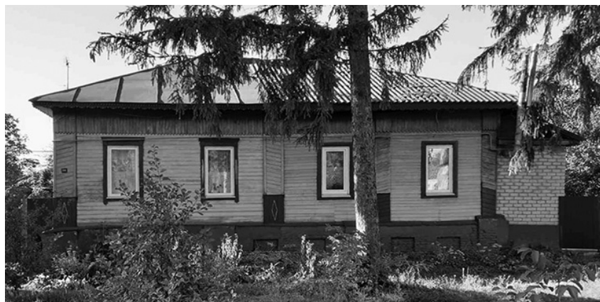
Будинок 1889 року. Батурина, вул. ім. В. Юценка, 42.

До сьогодні стоять на вулицях Батурина старі будинки – німі свідки минулого, а ми перегорнули ще одну сторінку історії нашого містечка.