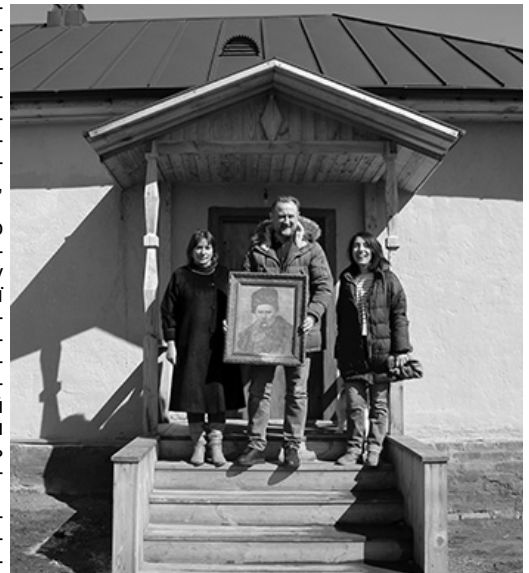
Родина Мартинюків із подарунком для музею «Козацький двір».

Приємно вразили живий інтерес та небайдужість до цієї теми з боку поці-