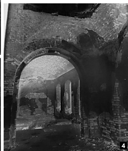
Фото М. Ушакова палацу Кирила Розумовського в Батурині (1908 р.): вгорі – північно-східний фасад; унизу – 1) фрагмент карнизу, 2) фрагмент оздоблення однієї із зал, 3) склепіння напіввідвалу, 4) прохідна кімната з видом на залу.