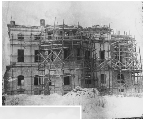
Рис. 1. Палац К. Розумовського. Фото 1940-х рр. із зібрання НКЗ «Гетьманська столиця».

мармуровими крихтами, покриття даху та куполів високоякісним металом, ви-