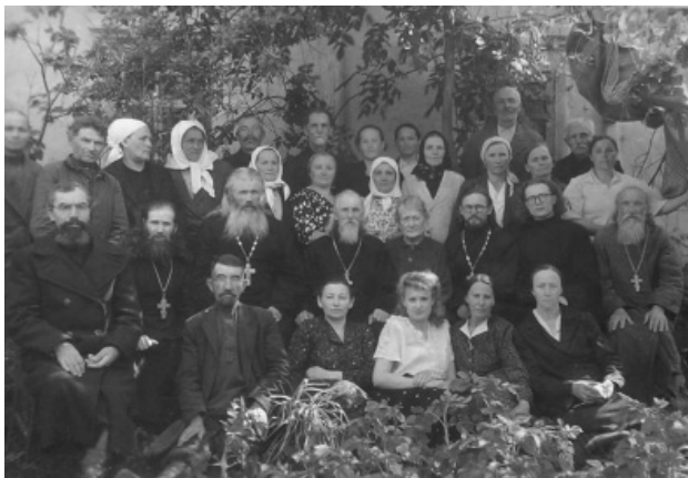
Іл. 3. Хор Воскресенської церкви. Фото 50-х років ХХ ст.

Тож збережені світлини хористів Воскресенської церкви є унікальними свідченнями того, що батуринці зберігли релігійність, духовність, вірність традиціям попри антирелігійні кампанії радянської влади.