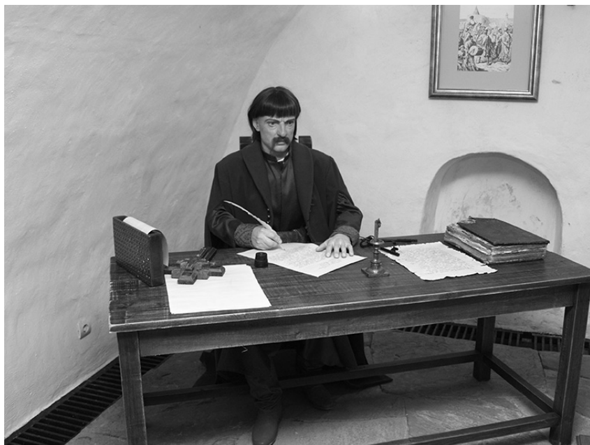
Писар Генеральної військової канцелярії. Воскова реконструкція. НІКЗ «Гетьманська столиця».

Сьогодні кулькові ручки виготовляються автоматизовано з найрізноманітніших матеріалів. Певною популярними вони є показником успішності й статусності власника. А колись, як бачимо, при виготовленні інструмента для письма увага в першу чергу зверталась на каліграфічні здібності писаря та його індивідуальні особливості писання.