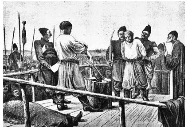
Страта за зраду. Ілюстрація з книги М. Аркаса «Історія України-Руси».