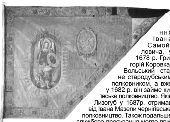
Прапор Стародубського полку, 1690–1696 рр. Шведський Армійський (Військовий) музей, Стокгольм.

Оскільки уряд генерального хорунжого займав одне із нижчих місць у ієрархії верхньої старшини, то траплялися випадки вивіщення призначення генеральних хорунжих за гарну службу до уряду полковника. Наприклад, у роки гетьмануван-