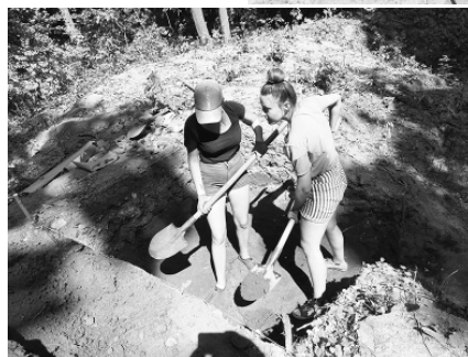
Дослідження замиської резиденції гетьмана Івана Мазепи, фото 2020 р.

ня проходили і на території південного передмістя Батурина – на поселенні «Дорога» (неподалік автошляху Кіпті-Бачівськ). Розкопки об'єкта очолив старший науковий співробітник Центру археології та стародавньої історії Північного Лівобережжя ім. Д. Я. Самоквасова Олександр Терещенко. Ще 2018 р. науковці виявили тут житло мешканця Батурина XVII – початку XVIII ст. Цього року продовжили вивчення розпланування якого знайшли коридор та ганок, було дерев'яним. Воно було розібране до 1708 р. Серед знахідок переважали фрагменти керамічного посуду, полив'яні та теракотові кахлі з рослинним та геометричним орнаментом, фрагменти цегли. Особливо цікавою річчю цього сезону стала ціла глиняна дитяча іграшка-свистунець кінця XVII – початку XVIII ст.