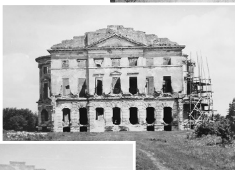
Рис. 2. Палац К. Розумовського. Фото кінця 1940-х рр. із зібрання ДНАББ ім. В.Г. Заболотного.