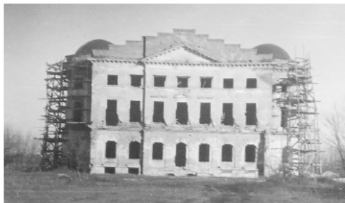
Рис. 3. Палац К. Розумовського. Фото 1940-х рр. із зібрання Українського державного науково-дослідного та проектного інституту «УкрНДІпроектреставрація».

готовлення бюстів з гіпсу для актові залі, встановлення гіпсових вінків та гірлянд довжиною до 100 м, встановлення декоративних дерев'яних круглих колон біля головних сходів та в актовій залі.