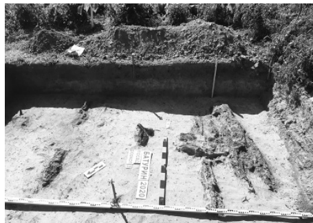
Дослідження планування житла Пилипа Орлика, фото 2020 р.

Ще один об'єкт розкопок 2020 р. знаходився на території замиської резиденції гетьмана Івана Мазепи. За роки досліджень цієї садиби було виявлено і вивчено кам'яний палац, дерев'яні «покоєву хату» (флігель), курінь-вартівню, церкву. Довгий час западина перед палацом вважалася рештками колодязя. В 2018 р. під час розвідки на краю котловану було знайдено цегляну кладку. У 2019 р. вдалося з'ясувати, що це підвальне приміщення наземної споруди, можливо, господарського призначення. Археологи дослідили ділянку входу до підвалу. Кладка з цегли мала товщину близько 90 см, а підвал був части-