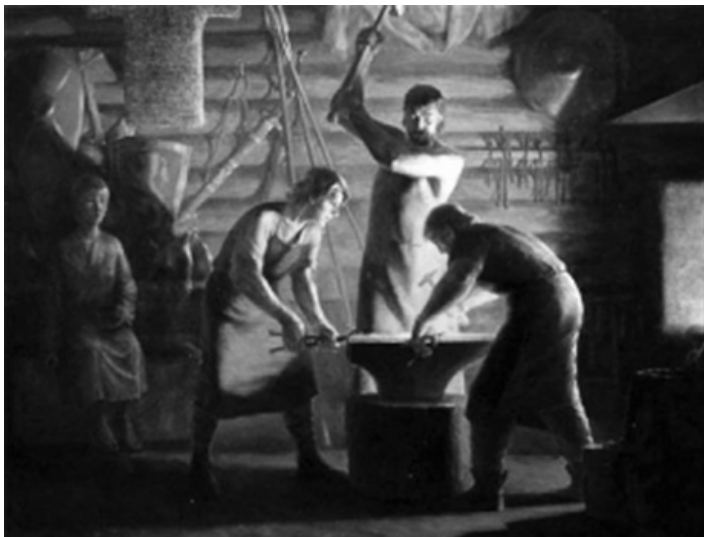
Ковалі-цеховики ранньомодерного часу.

3 двори бондарів і 1 гончарський, мешкав 1 музика, 1 котляр та 1 кушнір, який шив шапки.