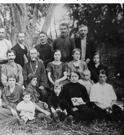
Іл. 1. Хор Воскресенської церкви. 1925 р.

У кінці 30-х років ХХ ст. приміщення Воскресенської церкви було переобладнане під заклад культури. І хор на деякий час припинив свою діяльність. Під час Другої світової війни храм був дуже порушований. Після війни релігійна громада отримала дозвіл на відбудову церкви. З відновленням храму відродився і його хор.