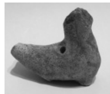
Глиняний свічник XVII – початку XVIII ст.