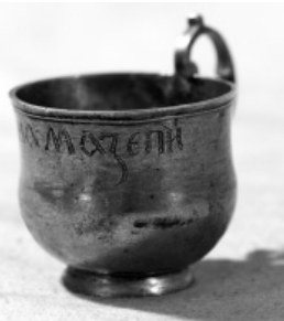
Чашка з написом «ІОАНА МАЗЕПИ», XVII століття. З фондової колекції Чернігівського історичного музею імені В.В.Тарновського.

Одними з перших ввозити чай з Китаю до Європи почали португальці, голландці та англійці. Враховуючи широкі дипломатичні зв'язки батуринських гетьманів з різноманітними країнами не дивно, що чаювання стало повсякденним явищем. Спочатку він став відомим як лікувальний напій, але після