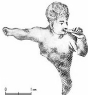
Уламок бронзової оправи книги – фігурка чоловіка, що сурмить. Фото В. Мезенцева, 2012 р.

Тому гравіроване зображення фігурки янгола з сурмою з Гончарівки може бути частиною композиції Страшного Суду. Найімовірніше, то була релігійна книга з розкішною оправою. Вона могла перебувати в особистій бібліотеці Івана Мазепи, про яку згадував генеральний писар Пилип Орлик: «Дорогоцінні оправи з гетьманським гербом, найкращі кийвські