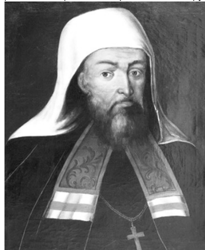
Портрет Київського митрополита Гедеона (Святополк-Четвертинського). Невідомий художник. XIX ст. Національний Києво-Печерський історико-культурний заповідник..

Після Івана Самойловича діяння митрополита підтримував гетьман Іван Мазепа. Керманіч продовжив справи, розпочаті Самойловичем: підтверджує Братському монастирю всі попередні маєності та дарує 17 дворів на Подолі, в Києві і ще декілька сіл. За клопотанням митрополита Гедеона, гетьман у 1689 р. розпочинає ремонт Софіївського собору.