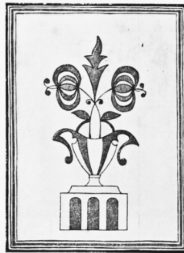
Орнамент на кахлі з палацу Кирила Розумовського. Журнал «Ілюстрована Україна», 1914 р. № 7.

Також Василь Різниченко згадує, що стіни залів палацу прикрашали не