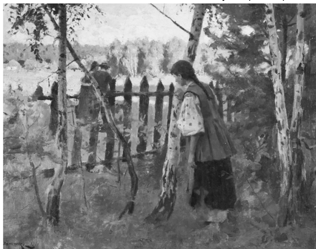
Ревнощі. Художник М. Пимоненко. 1901 р. Сумський обласний художній музей.

п'ятдесят другого, місяця июня 18 дня... представлена перед нами дівчиця Марія, донька покійного урядника Полтавського охочекомонного полку Гордія Чураї ... загубила страх Божий, смертельний гріх учинила ... отруїла Григорія, сина хорунжого Полтавського полку Петра Бобренка».