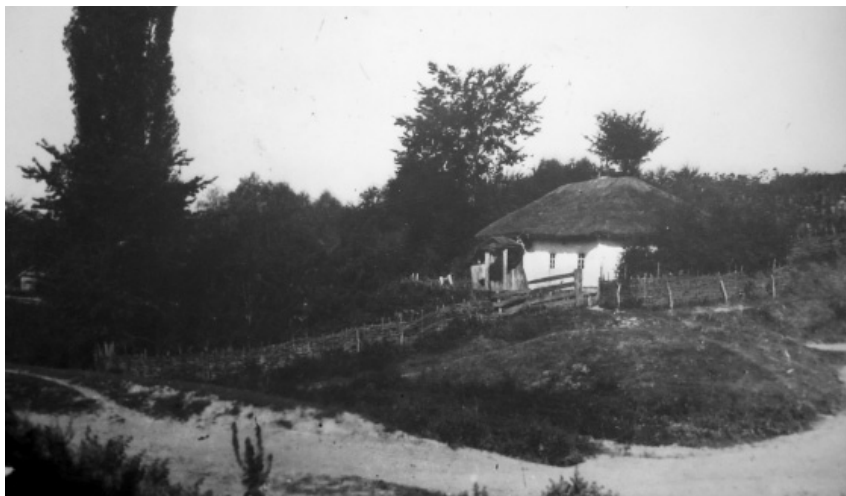
Батури́нська хата. Фото 1909 р. Інв. № 57/Д-1-н-д.

Як видно із представлених світлин, помешкання жителів Батурина були традиційними для Чернігівщини житлами. Назавше хата стала зразком естетичних вподобань українців, і саме українська хата є візитівкою нашої неньки-України.