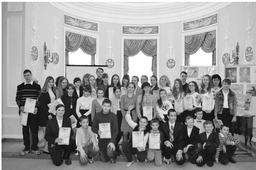
Учасники щорічного дитячого творчого конкурсу «Розум-фест». 21 березня 2018 р.

Палац гетьмана України Кирила Розумовського, безперечно, є одним із найпопулярніших музейних закладів України. Сьогодні ми з впевненістю можемо говорити, що кількість відвідувачів з кожним роком лише зростає, адже з моменту відкриття його відвідало 407 тис. екскурсантів, які прослухали 32 тис. екскурсій. Серед великої кількості відвідувачів па-