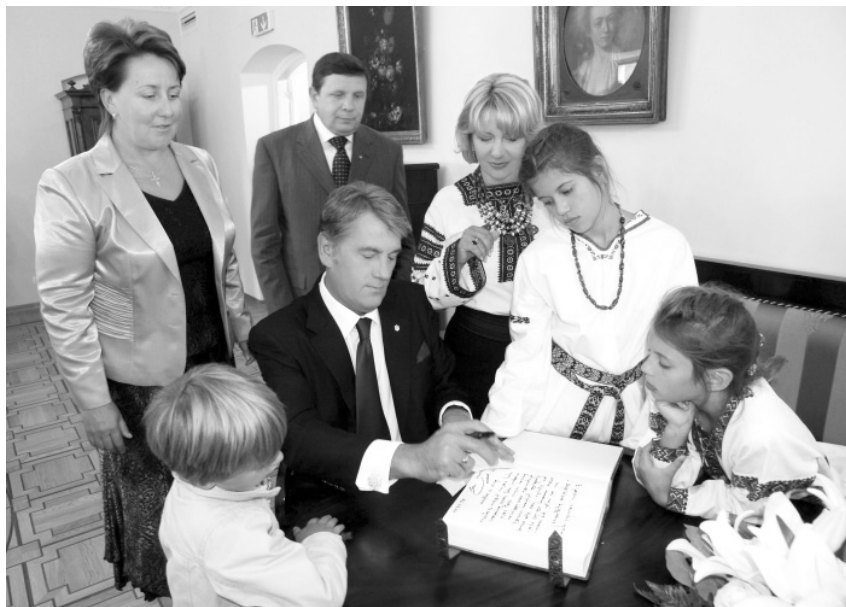
Перші щирі побажання від Президента Віктора Ющенка в день відкриття гетьманського палацу. 22 серпня 2009 р.

Я хочу в тебе попросити Вкраїну – ньеньку захистити, Бо в мирі варто людям жити. Бо серце прагне до любові У кожному дитячій слові. У мріях... Поглядах... Серцяx.