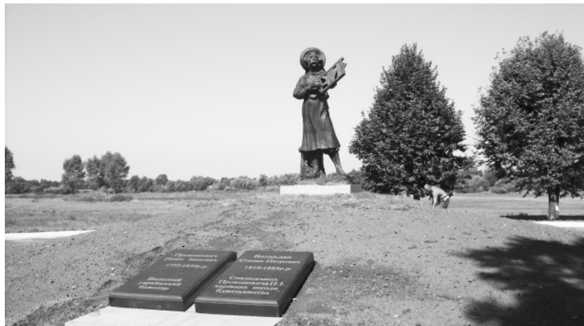
Могила Степана Великдана та Петра Прокоповича в с. Пальчики. Фото 2008 р.

На довгий час ім'я та місце поховання Степана Великдана, який не залишив законних нащадків, було забуто.