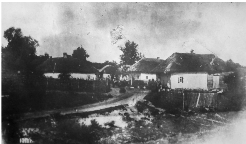
Вулиця Батурина. Фото 1911 р. Інв. №55/Д-1-н-д.

Більш заможні селяни будували багатокімнатні помешкання, які склалися з трьох або чотирьох кімнат. Трикімнатні ха-