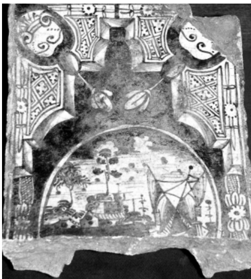
Фрагмент кахлі з палацу Кирила Розумовського, ХVІІІ – ХІХ ст.

Отже, на кінець 1911 р., коли розпочалася реставрація, центральна будівля палацово-паркового ансамблю мала занедбаний вигляд. Напівдвальне приміщення, перший та другий поверхи були повністю завалені сміттям та землею, міжповерхові переkritтя не збереглися, почали рости бур'яни, а подекуди – навіть цілі дерева. Незважаючи на нещадність часу та людську байдужість, пожежу та мародерство, залишилися фрагментарні дета-