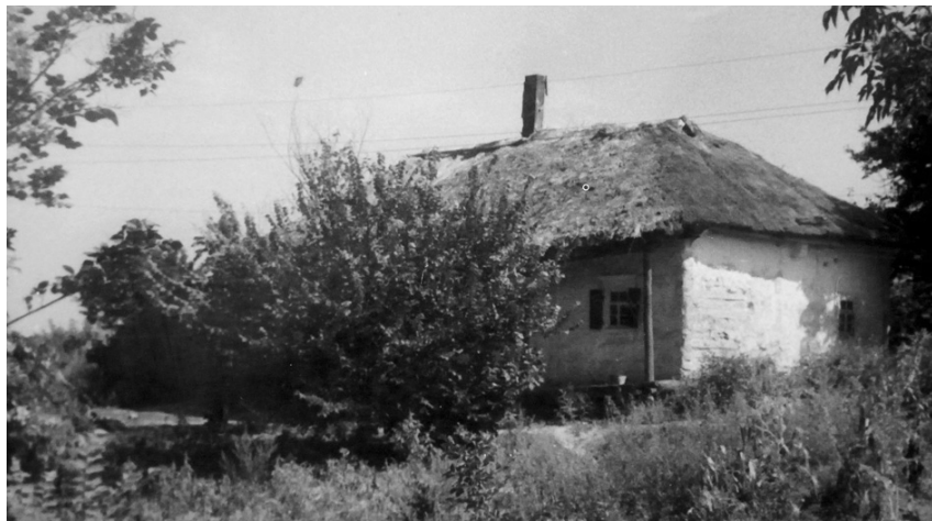
Батури́нська корчма. Фото XX ст. Інв. № 328/Д-2-н-д.

Зовні хата підкреслювала статки і смаки її власника, його характер, з іншого боку мала відповідати віковим традиціям житлобудівництва та вибору місця розташування. Початок спорудження нового помешкання супроводжувався низкою звичаїв і обрядів. Наприклад, потрібно було не схибити з вибором місця будівництва житла, адже раніше вважалося, що хату не можна зводити на місцях, де колись проходила дорога та на перехресті шляхів, де стався нещасний випадок, на місцях поховань, тощо.