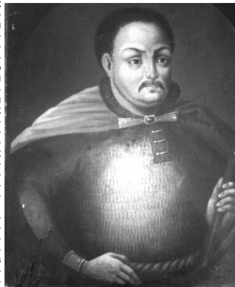
Портрет гетьмана І. Самойловича. Невідомий художник. Середина XIX ст. Національний музей історії України.

ся московському уряду. Боротьба за повернення миру, прагнення до об'єднання всіх етнічних земель, збільшення професійного козацького війська, активна підтримка української православної церкви, безперечно, нарощували могутність Гетьманщини. І це все не входило в політичні плани Москви. Методом ослаблення для української держави обрали вічний розкол. У травні 1686 р. між Польщею та Московією був укладений новий договір, так званий «Вічний мир», що не мав обмежень у часі і узаконував поділ Гетьманщини. Частина правобережних земель тоді поверталася Польщі. Цей договір перекреслював усе те, за що боровся і чого, в результаті, досягнув Іван Самойлович. Зрозуміло, що «Вічний мир» гетьман не прийняв. Після цих подій вже невідомо, чи вирішили усунути від влади. І привід знайшли швидко. Наступного року українсько-московське військо здійснило невдалий похід на Крим. Відповідальність за нього переклали на українського гетьмана, звинувативши його у таємних домовленостях з кримським ханом. За це цариця Софія наказала відправити «неслухняного» гетьмана до Сибіру. За Уралом, в Тобольську, і загубився слід одного з видатних українських гетьманів – Івана Самойловича.