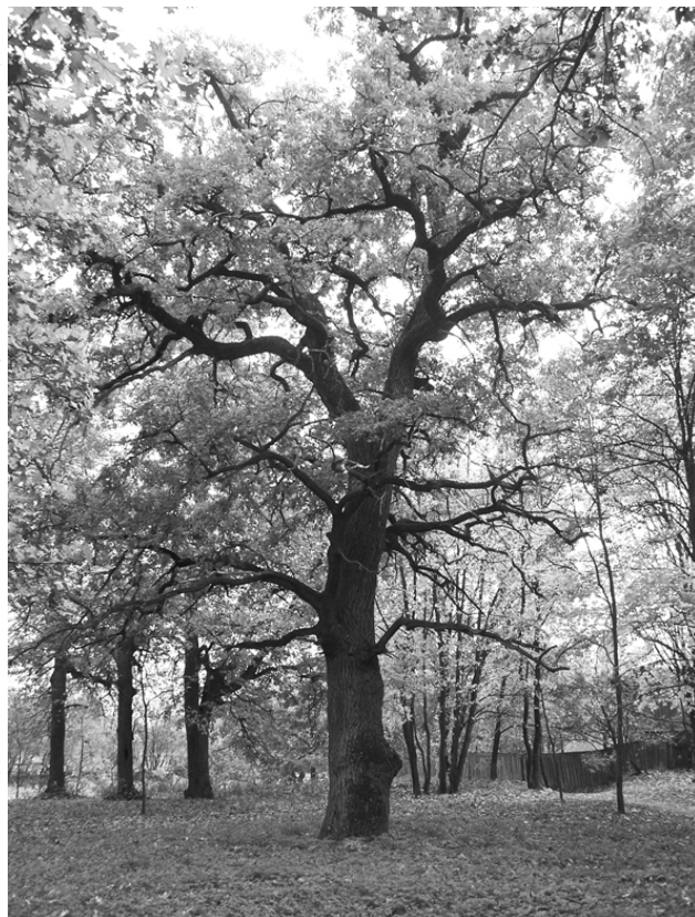
Багатвіковий дуб на території парку «Кочубеївський». Фото 2018 р.

Багатвікові дерева — також об'єкти охорони держави. На відміну від кам'яниць, скульптур чи археологічних решток вони живі, тому потребують щоденного догляду, лікування за новітніми технологіями. Саме ці завдання успішно виконують працівники паркових відділів НІКЗ «Гетьманська столиця».