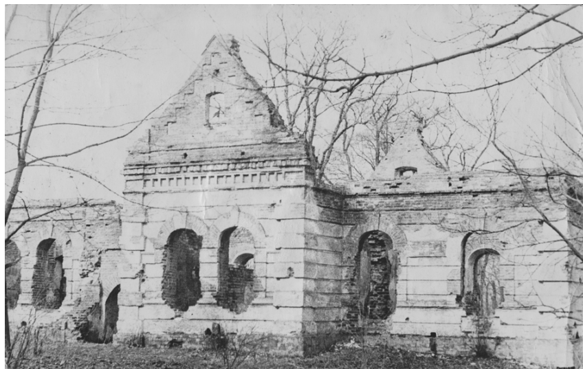
Будинок В. Кочубея, 1949 р.

У 1973 р. влада прийняла рішення про реставрацію цієї унікальної пам'ятки архітектури, а за два роки,