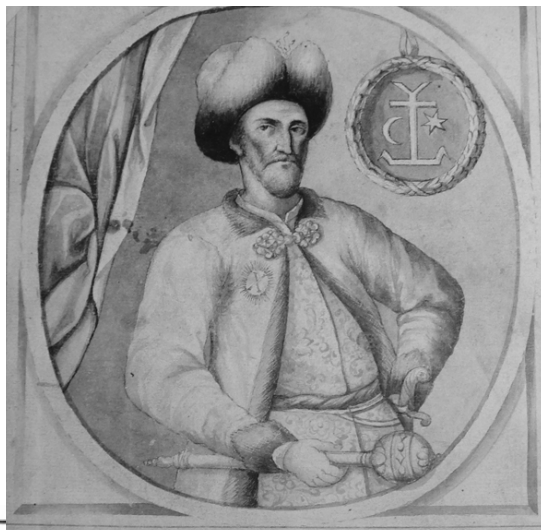
Іван Мазепа (1639–1709). Портрет з «Літопису» С. Величка.

Особливо великих успіхів за допомогою подібної «м'якої сили» гетьман досягнув після фактичного приходу до влади Петра I. Не дуже відомим є той факт, що Мазепа знаходився у Москві під час заплоту, організованого Петром I з метою відсторонення від влади своєї сестри Софії, тодішньої правительки Московії. А чаша терезів остаточно схилилася на бік молодого царя якраз після того, коли гетьман прибув до Троїце-Сергієва монастиря – тимчасової резиденції Петра I. В умовах хоч і короткочасної, але все ж дезінтеграції структури