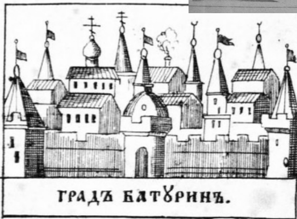
Місто Батурина. Лубок початку XVIII ст.

Коли співіснування з Московією стало абсолютно нестерпним, гетьман Мазепа підняв повстання проти царя. І підняв це повстання виходячи виключно з інтересів українського народу. Врешті, навіть сухий перелік всіх досягнень Івана Мазепи за 22 роки гетьманування займає би не один десяток газетних сторінок – успіхів справді було немало!