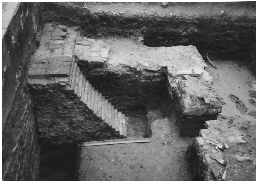
Контрфорс біля східної стіни будинку В. Кочубея.

в 1975-му в будинку відкрито історико-краєзнавчий музей.