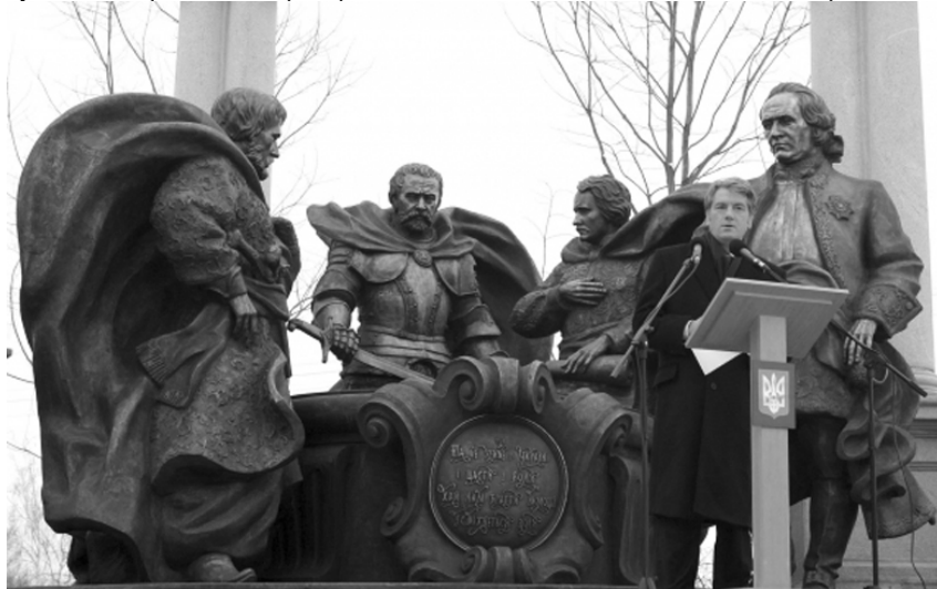
Офіційний візит Президента України до Батурина, 22 січня 2009 р.

Те, що зробив Путін за останні п'ять років, — трагедія не тільки України. Він своїми діями ізолює Росію, а в ХХІ сторіччі жи-