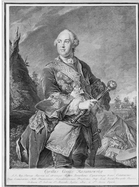
Портрет гетьмана К. Розумовського. 1762 р. Георг Шмідт з оригіналу Л. Токе 1758 р.

Щоб гетьманська столиця стала осередком освіти Гетьманщини, Кирило