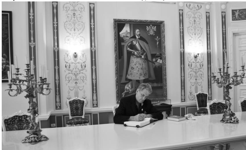
В. Ющенко в залі палацу К. Розумовського, 23 жовтня 2014 р.

виглядало: «І на Січі мудрий німець картопельку садить...».