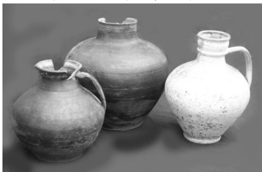
Вироби XVIII ст. з фондів НІКЗ «Гетьманська столиця»

На сьогодні гончарне ремесло суттєво занепало, більшість його центрів припинили своє існування. Про майстрів гончарного ремесла нам нагадає лише яскрава прізвище їхніх нащадків: Гончар.