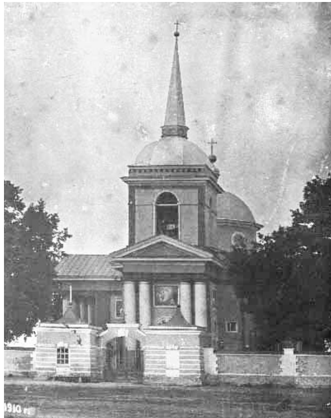
Воскресенська церква-усипальниця Кирила Розумовського, фото 1910 р.

За метричними книгами Воскресенської церкви можливо простежити, що до 1919 року Іван Локтев продовжує