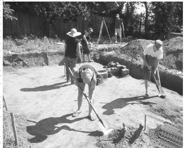
Дослідження забудови фортеці. Фото 2018 р.

ника козацької старшини. Цього року на досліджуваній ділянці археологи знайшли багато полив'яних та теракотових кахлів з геральдичним орнаментом. У нижніх шарах розкопу було виявлено монету «Півторак» Речі Посполитої. На думку археологів, знахідка дозволяє визначити час появи садиби не раніше другої половини XVII ст. Отже, археологічні дослідження 2018 р. доповнили уявлення про розвиток Батурина доби слов'ян, Київської Русі та Гетьманщини. Польовий сезон був плідним і приніс багато нових цікавих відкриттів.