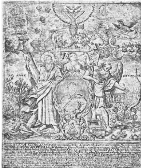
Гравюра з панегірику на честь Андрія Войнаровського, І. Мігура, після 1702 р., Національна бібліотека у Варшаві.

Таке переслідування мазепинців часто не давало результату, більше того, викликало новий опір. Приклад цього – доля Івана Мировича. Його батько, перяславський полковник, мав шестеро синів. Старший син, Федір став активним діячем еміграції, молодші ж були репресовані, вислані до Тобольська. Саме тут пройшло дитинство наймолодшого, Івана. Він народився 1703 року, під час репресій потрапив у шестирічному віці. Московська влада вважала, що таким чином виховуються добрі холопи і тому Івана Мировича було прийнято на