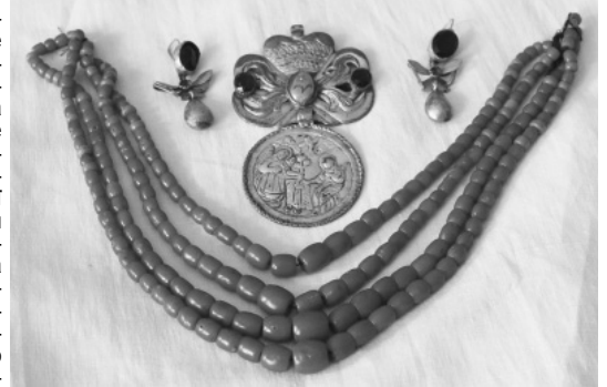
Дукач, сережки, намисто коралове XVIII ст. в експозиції Будинку В. Кочубея