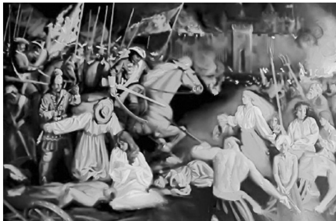
А. Івахненко. Різня в Батурині 1708 року. 2004 р.

жавою подоланий великий та непростий шлях свого становлення, і Україна вже має своїх нових героїв. Але їх патріотизм формувався на фундаменті, що був закріплений на прикла-