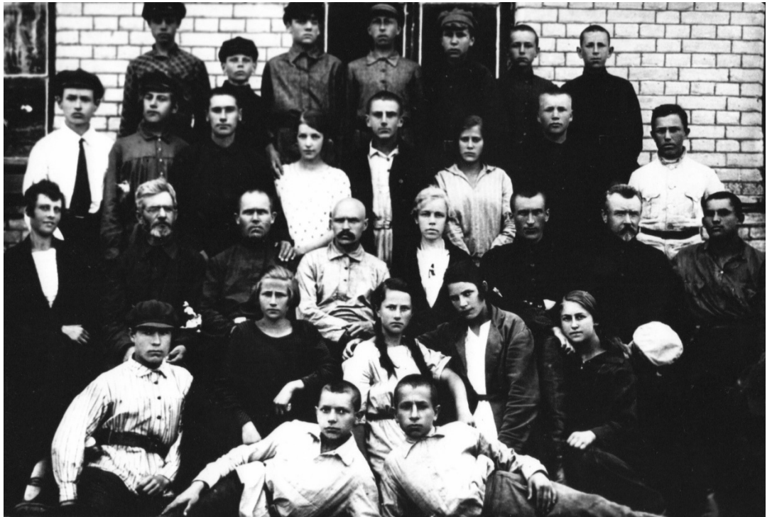
Другий випуск Батуринської семирічної школи. 1926 р.

Отже, реформування шкільної освіти в 1920–1924 рр. дало можливість реорганізувати попередню систему шкільної освіти. Відбулося встановлення та закріплення української радянської системи освіти. Головним мотивом запровадження трудової школи було прагнення підго-