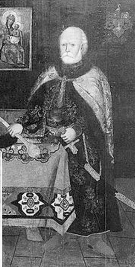
Портрет Василя Дуніна-Борковського. Невідомий художник. XVIII ст.

Про життя Григорія Карповича Коровки-Вольського нічого невідомо то того моменту, коли новобраний гетьман Д. Ігнатович призначив його на ключовий уряд батуринаського сотника, тобто людини, яка керувала козацтвом гетьманської столиці та її околиць. Цю посаду завжди займали дуже близькі гетьману люди, тому можна припустити, що Коровка також до цього пройшов школу служби при Д. Ігнатовичу. Якийсь час він знаходився в тіні після падіння свого патрона, але дуже швидко повернувся на перші ролі. Мало хто навіть в ті бурем-