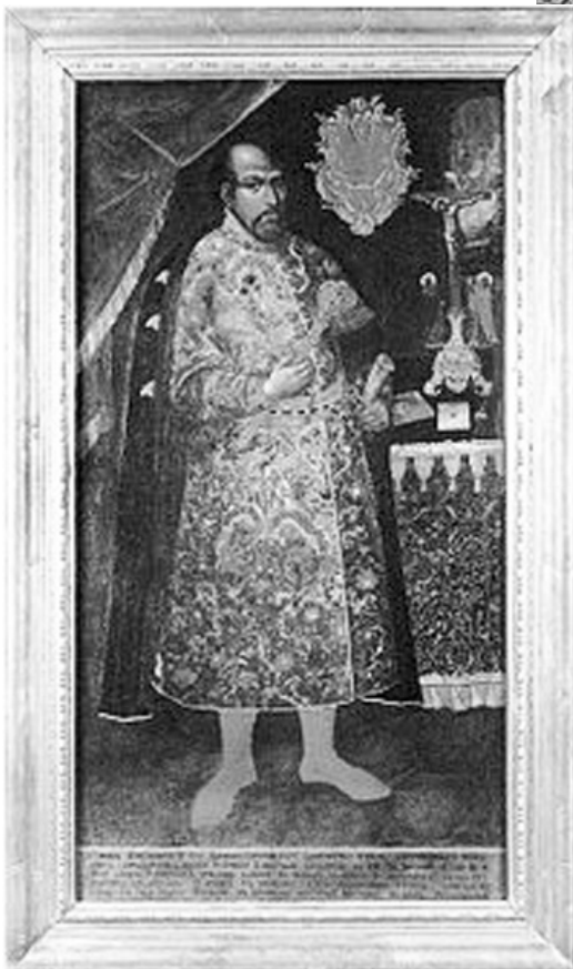
Портрет Михайла Миклашевського. Невідомий художник. XVIII ст.

На жаль, натепер можна констатувати брак біографічних подробиць щодо згаданих вище людей. Але й із того, що відомо, можна зробити висновок, що гетьман Д. Ігнатович залишив по собі неабиякий кадровий спадок.