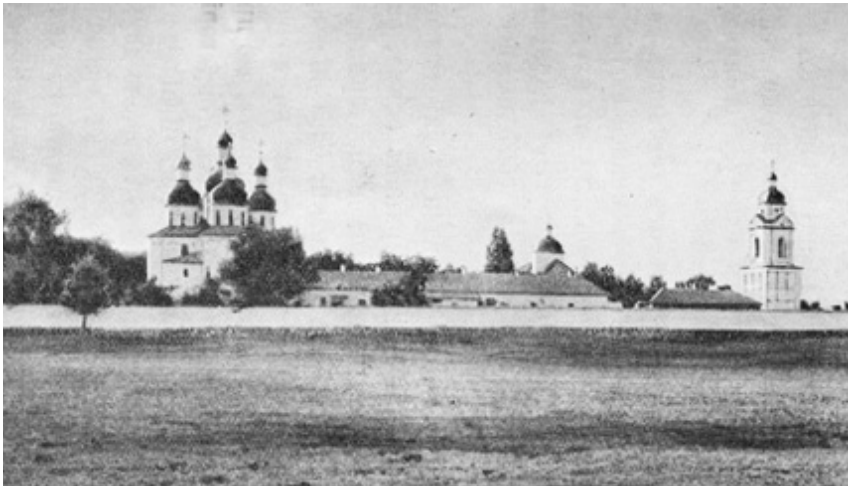
Загальний вигляд Батуринського Миколаївського Крупицького монастиря, фото початку ХХ ст.