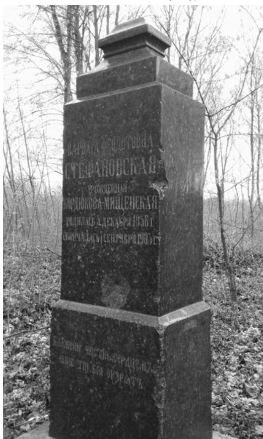
Надгробок із поховання Стефановських початку XX століття, с. Митченки

Тож, старі поховання потребують збереження та дослідження, оскільки мають значний інформаційний потенціал для вивчення історії регіону, а повага до «батьківських домовин» – це показник культури нації.