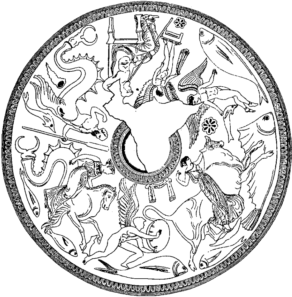
Рис. 1. Міф про викрадення Європи. Рисунок на червонофігурному рибному блюді з Німфея. Національний музей історії України. Київ.

раженню не надавалось переносного значення, й воно сприймалося так само, як у творах античних письменників: без поховальної символіки.