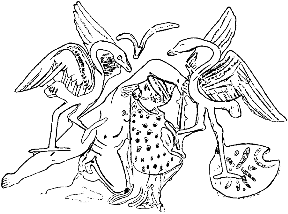
Рис. 3. Боротьба пігмея з двома журавлями. Рисунок на червонофігурній пеліці з Пантикапея. Ермітаж. Санкт-Петербург.

відвоювати у них хлібні ниви. Пігмеї ж знищували яйця журавлів, і ті мстилися за це 40 . Докладного викладу міфу не збереглося, хоча давні автори звертались до нього з доби архаїки, а Стефан Візантійський згадав навіть цілу поему «Гераномакія» на цей сюжет. Битву журавлів і пігмеїв описував Гесіод 41 , а Гомер в «Іліаді» (III, 2—7) згадав про неї в порівнянні, як про добре знайомий слухачам образ, що не потребує пояснення.