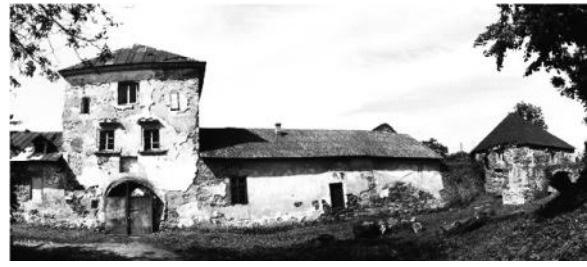
Рис. 3. Надбрамна вежа, 2013 рік

Великий і розгалужений рід Потоцьких дав Польщі більш як 30 сенаторів, 4 великих коронних гетьманів, видатних політиків і дипломатів. Першим, хто став сенатором, був Якуб – онук засновника роду, який свою долю пов'язав з канцлером і великим коронним гетьманом Яном Замойським. А найбільшу військову славу серед Потоцьких здобув Станіслав на прізвисько Ревера (1579-1667 рр), який дав початок так званій гетьманській лінії роду, і який першим почав використовувати герб «Срібна Пилява». Першим, хто отримав графський титул, був представник бучацької гілки Потоцьких – Домінік (у 1777 р.), а потім Вінцент – підкоморій великий коронний (1784 р.), а усі інші Потоцькі тільки у ХІХ ст. [3, стор. 98].