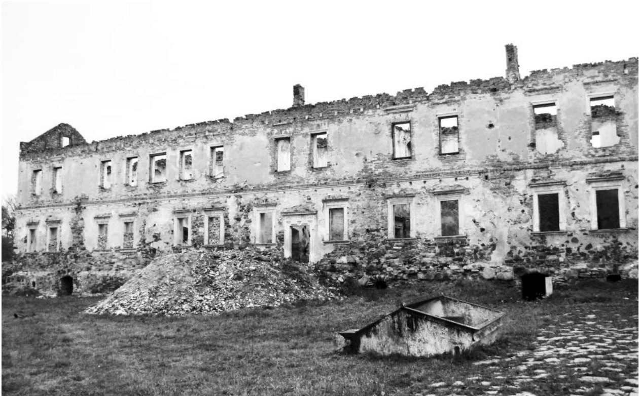
Рис. 4. Палацовий корпус, 2013 рік

В кінці XVIII ст. Микола Потоцький, тодішній власник Золотого Потоку, почав продавати окремі села, що входили до його маєтку. У 1786 році Золотий Потік разом із замком ку-