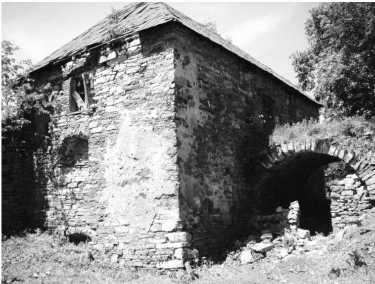
Рис. 5. Північно-східна наріжна вежа