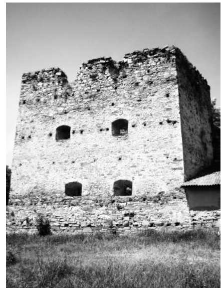
Рис. 6. Південно-східна наріжна вежа