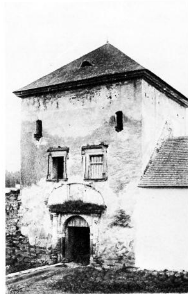
Potok Złoty. Brama zamkowa (XVII w.)