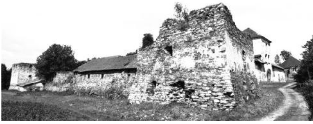
Рис. 2. Золотопотоцький замок, 2013 рік