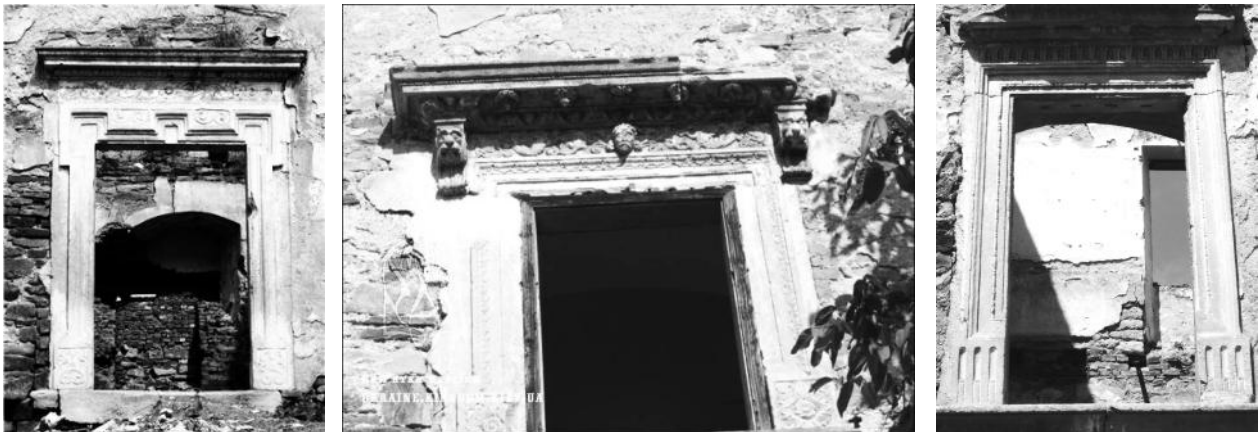
Рис. 7. Наличники вікон і дверей в замку, 2013 рік