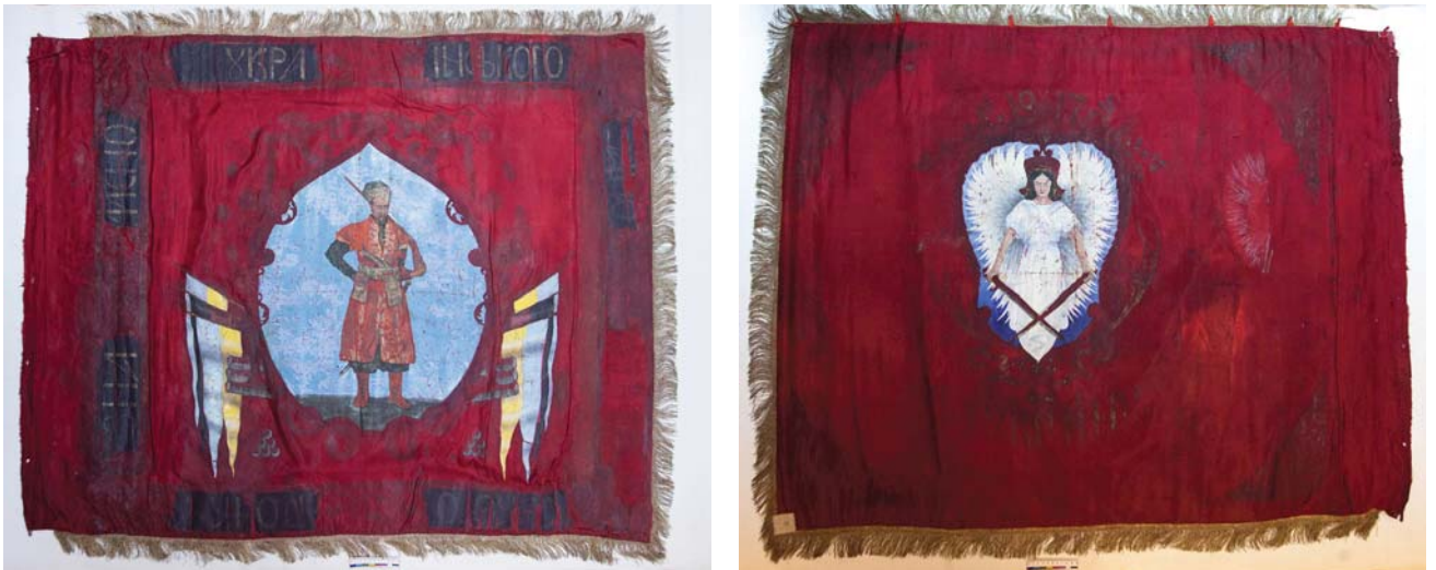
Рис. 1. Прапор Українського Запорізького полку. 1917 р.

У контексті нашого дослідження це зображення викликає підвищений інтерес, бо саме його ми можемо побачити на представленому у рамках виставкового проєкту «Народжена волею, стверджувана зброєю!» в НМІУ прапорі Українського Запорізького полку. На лицьовому боці прапора зображено козака у картуші з блакитно-жовтими знаменами по боках, а на зворотному – вищезгаданий сюжет із архистратигом Михаїлом 13 . (Рис. 1) Предмет відображає той етап Української Революції, який можна, вдавшись до певного метафоричного спрощення, назвати «романтичним». Саме в цей час у складі колишньої імператорської армії відбувається створення національних військових частин, зокрема й українських.