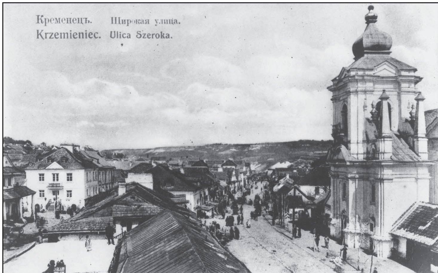
Кременець. Пер. пол. XX ст.

Книга «Інтелігенція Волині: погляд крізь призму часу» розповідає про становлення української інтелігенції Волині, зокрема на Володимирщині, у 20—30-х роках XX ст. 5