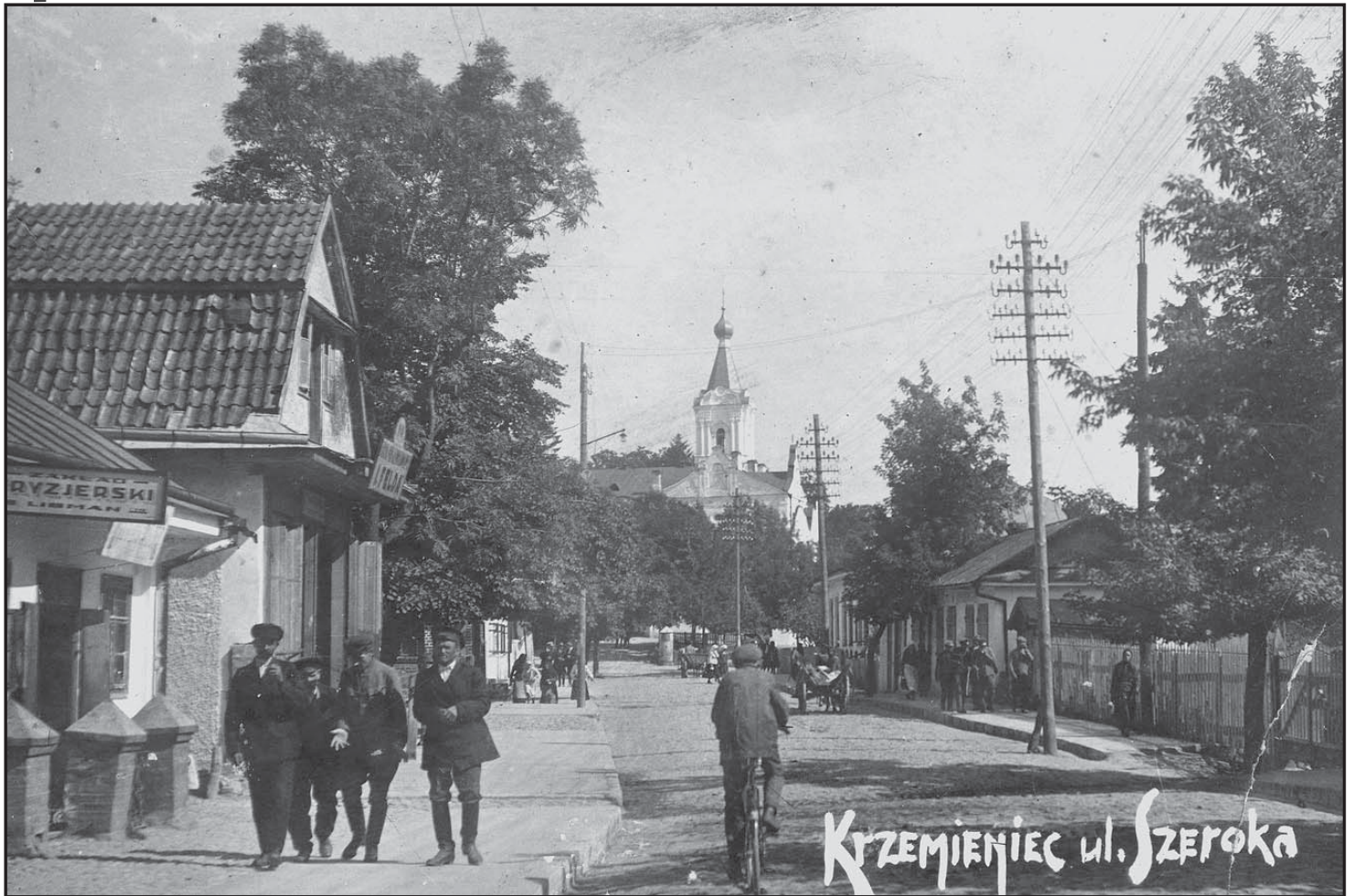
Кременець. Пер. пол. ХХ ст. Вул. Широка

залежницької платформи та претендувала на провідну роль у суспільстві. Партія була утворена в 1926 р. внаслідок об'єднання Української радикальної партії, що діяла в Східній Галичині від 1890 р., і Волинської організації Української партії соціалістів-революціонерів 42 , утвореної в 1904 р. 43