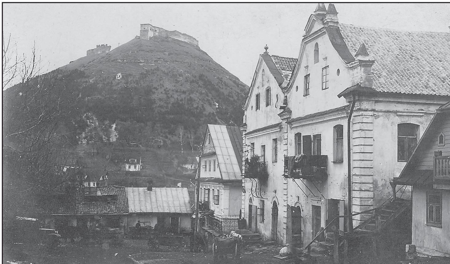
Кременець пер. пол. ХХ ст. Замкова гора та будинки-близнюки

Впливовою легальною партією було Українське національно-демократичне об'єднання (УНДО), утворене у 1925 р. шляхом об'єднання двох крил Української трудової партії, Української партії народної роботи і Волинської національної групи Української парламентарної репрезентації 18 . У липні 1925 р. провідники УНДО сформулювали політичну програму, в якій висловлювалися за єднання українців для протидії асиміляційним намірам уряду. У програмі зазначалось: «Східна Галичина з Лемківщиною, Холмщина з Підляшсям і Волинь з Поліссям мають споконвічний український характер. Українське населення супроти чужинного елементу є тут переважаючою більшістю. Тому УНДО боротиметься, щоб західноукраїнські землі проти Польщі виступали разом як цілість, і в своїй участі головну увагу приділятиме до вдержання і розбудови одноцілого національного фронту» 19 . На другому з'їзді в листопаді 1926 р. УНДО доповнила програму і в основу своєї діяльності взяла соборність, державність, демократію та боротьбу