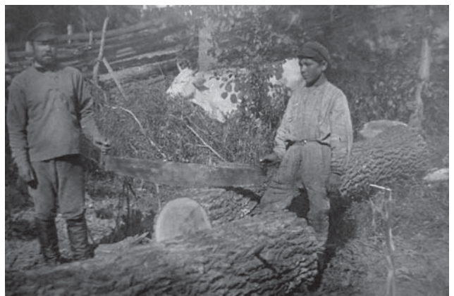
Рис. 4. Фото Д. Демуцького «Пиляння колоди на човна, с. Старосілля, Жукинська волость, Остерський повіт, Чернігівщина, 1922 р.» (колекція НМІУ)