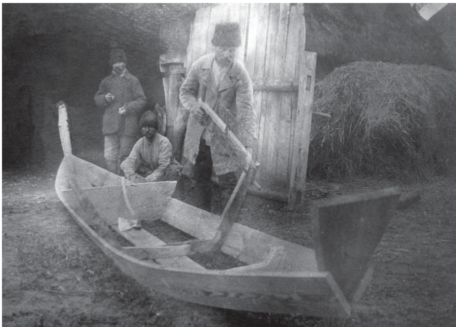
Рис. 16. Фото А. Онищука «Виробництво «дуба» (човна з дощок), с. Старосілля, Жукинська волость, Остерський повіт, Чернігівщина, 1929 р.» (колекція НМІУ)

Щоб ознайомити відвідувачів із виробництвом «дуба» (великим човном, який робили з дощок у Старосіллі), на стенді висіло фото «виріб дуба з дощечок». (Рис. 16) 90