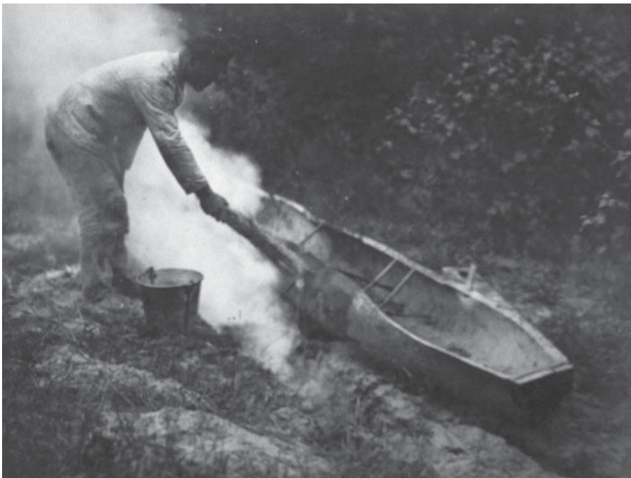
Рис. 12. «Човен стоїть біля рівчака з вогнищем, а віхтем намочує бік щоб зробити його м'яким та легко розда- вався, с. Старосілля, Жукинська волость, Остерський повіт, Чернігівщина, 1922 р.»

9. Човен стоїть біля рівчака з вогнищем, а віхтем майстер намочує бік, щоб зробити його м'яким та щоб він легко роздавався. (Рис. 12) 86