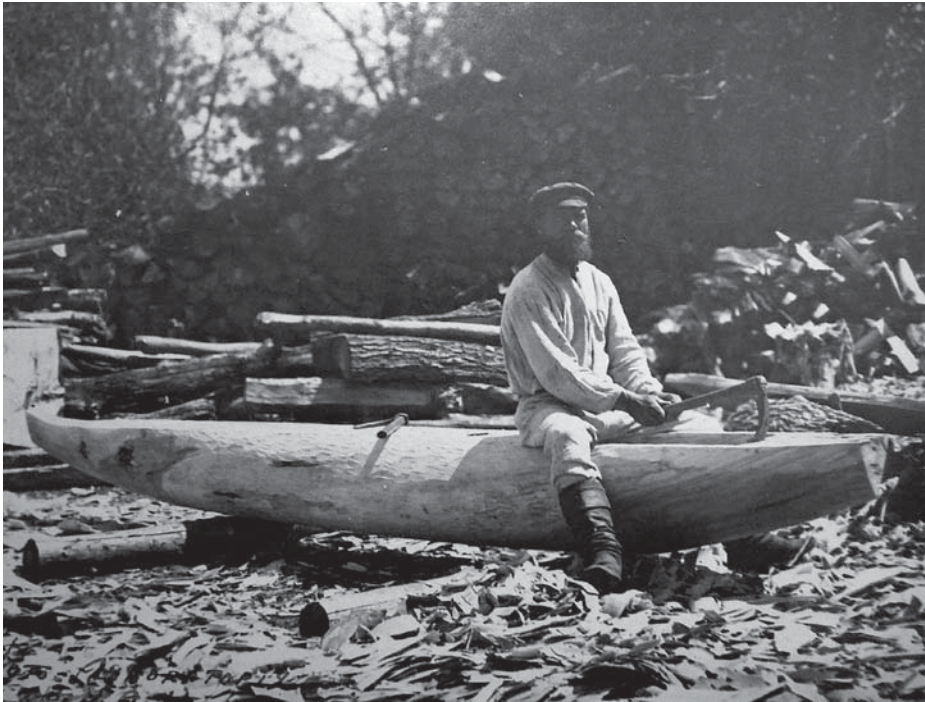
Рис. 7. Фото Д. Демуцького «Майстер «бортує» копилом човна, с. Ста- росілля, Жукинська во- лость, Остерський повіт, Чернігівщина, 1922 р.» (колекція НМІУ)