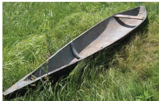
Рис. 3. Фото С. Сіренка «Довбанка, с. Мньов, Чернігівський р-н, Чернігівська обл., 2010 р.»

Після завершення «нашивки» (а якщо довбанка без них) робили і встановлювали «боті» («ботіна» 63 ), «поріжок», «снізки». «Боті» – це дуга, яку вставляли між стінками човна, прикріпивши до дна та боків. Її переважно виробляли з сосни. «Поріжок» – дошка, яку перпендикулярно встановлювали до дна і прикріплювали до стінок. Він служив сидінням для рибалки 64 . У сучасних довбанок «поріжок» відсутній, а замість нього використовується сидіння. (Рис. 3) 65 У кермо та в ніс вставляли дерев'яні палки («снізки»), щоб братися за них рукою, витягаючи човна з водойми. До передньої снізки чіпляли ланцюг для прив'язування на березі човна 66 .