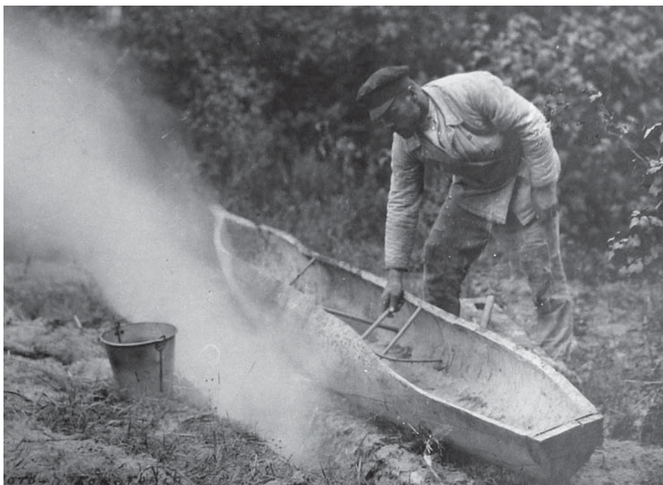
Рис. 13. Фото Д. Демуцького ««Роздає човна», втискаючи в середину «цурки», с. Старосілля, Жукинська волость, Остерський повіт, Чернігівщина, 1922 р.» (колекція НМІУ)