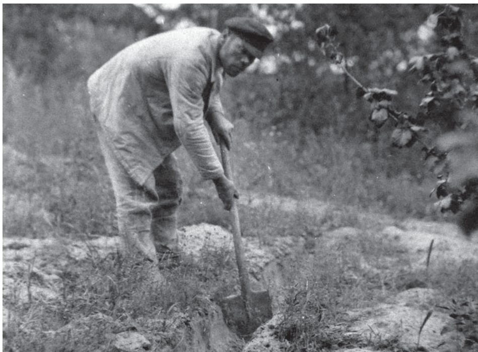
Рис. 9. Фото Д. Демуцького «Викопування рівчака для розкладання во- гнища, с. Старосілля, Жукинська волость, Остерський повіт, Чернігівщина, 1922 р.» (АНФРФ ІМФЕ)