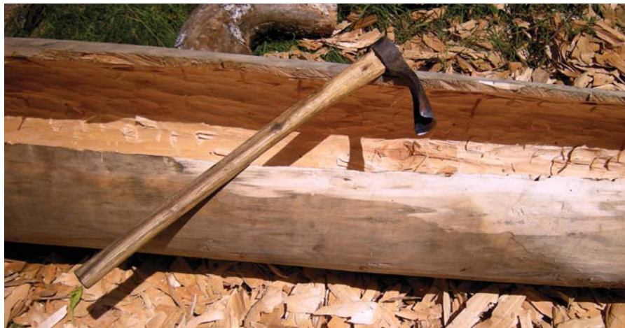
Рис. 2. Фото С. Сіренка «Копил, який лежить на заготовці, с. Мньов, Чернігівський р-н, Чернігівська обл., 2010 р.»

Перевернувши заготовку (верхом догори), майстер притискав одним коліном або сідав на неї і, тримаючи обома руками копил ( Рис. 2 ), починав видовбувати середину («борт»). Роботу розпочинали з носа, видовбуючи вузько і поступово щораз ширше. Цей етап виробництва іменується «бортування» 47 . Під час довбання на носа і корму накладали спеціальні планки («лисиці»), які запобігали розколу 48 . На поч. ХХІ ст. замість «лисиць» використовують смолу (обмащують носа і корму, а потім їх накривають тканиною) 49 .