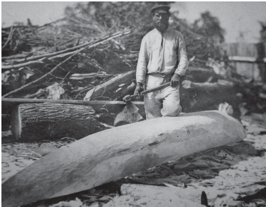
Рис. 6. Фото Д. Демуцького «Сокирою колоді надає форму човна, с. Старосілля, Жукинська волость, Остерський повіт, Чернігівщина, 1922 р.» (АНФРФ ІМФЕ)