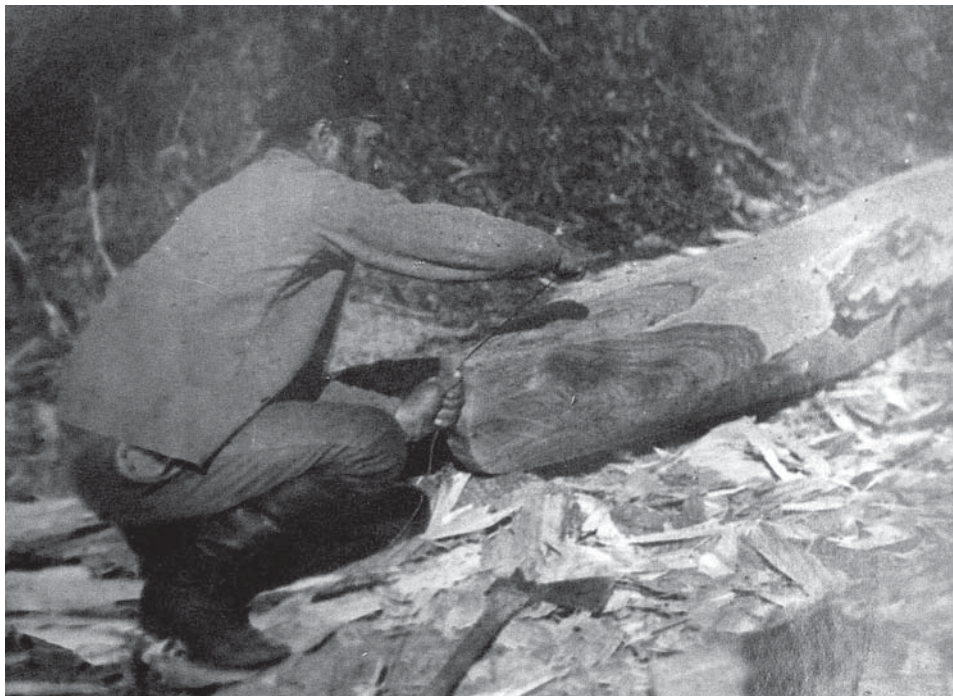
Рис. 5. Фото Д. Демуцького «Майстер відбиває шнуром по середині заготовки «правду», с. Старосілля, Жукинська волость, Остерський повіт, Чернігівщина, 1922 р.» (колекція НМІУ)