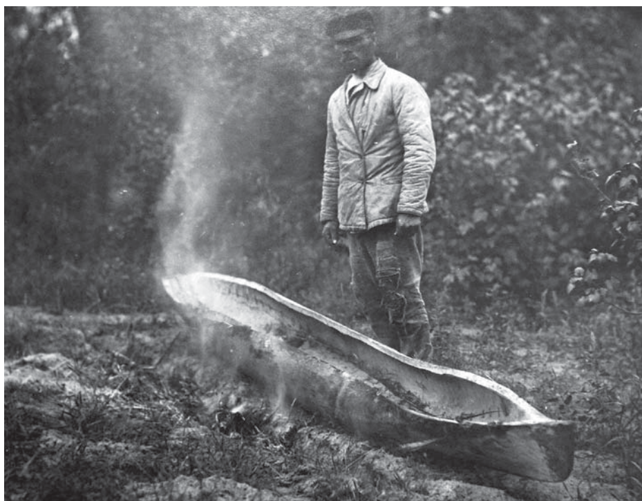
Рис. 10. Фото Д. Демуцького «Розпарює човна, прикрив- ши ним рівчака з жаром, с. Старосілля, Жукинська волость, Остерський повіт, Чернігівщина, 1922 р.» (колекція НМІУ)