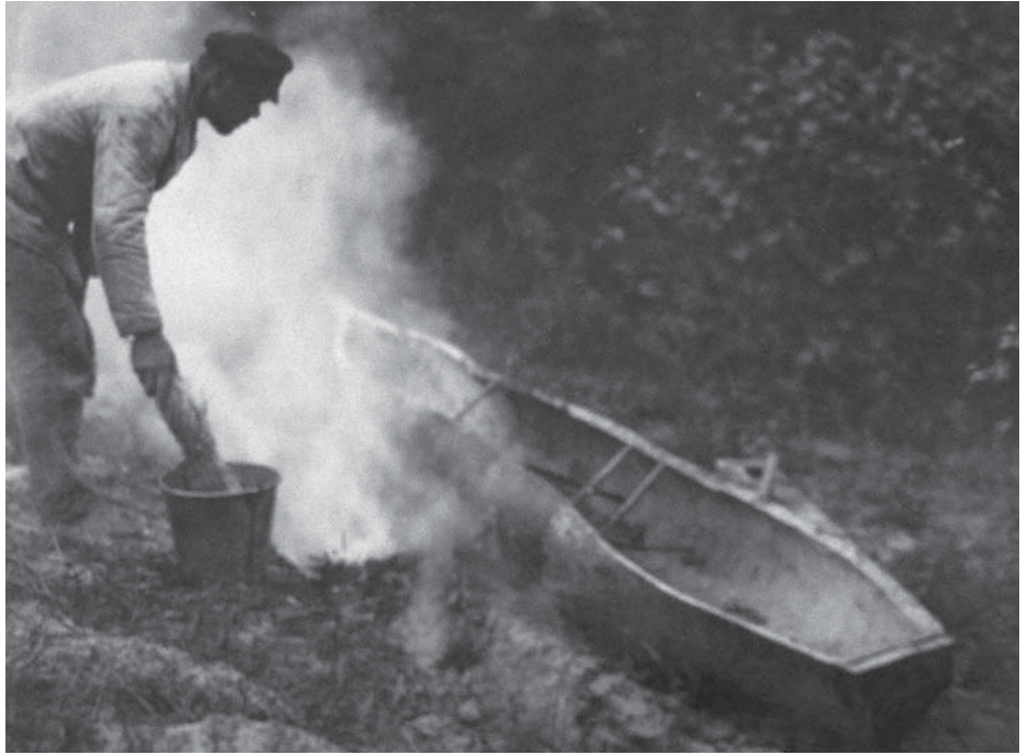
Рис. 11. Фото Д. Демуцького «Поставивши човна біля рівчака з вогнищем, намочує віхоть у відрі з водою, с. Старосілля, Жукинська волость, Остерський повіт, Чернігівщина, 1922 р.» (АНФРФ ІМФЕ)

8. Поставивши човна біля рівчака з вогнищем, намочує віхоть у відрі з водою. (Рис. 11) 85