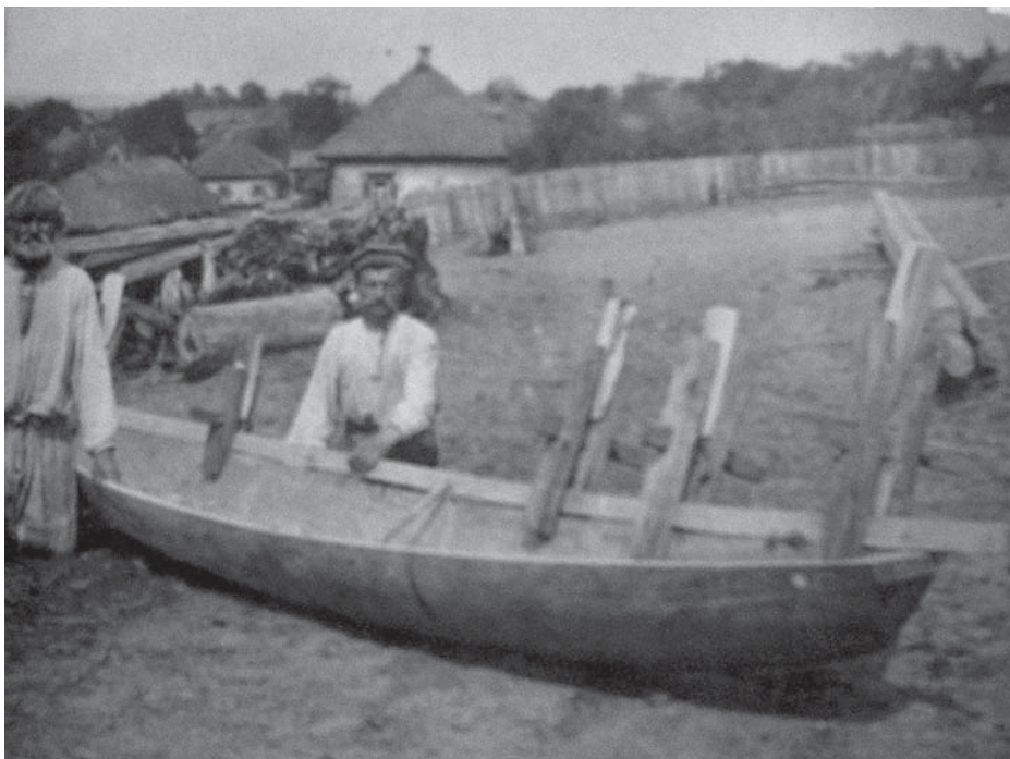
Рис. 15. Фото Д. Демущого «Встановлення «нашивки» на стіни довбанки, с. Старосілля, Жукинська волость, Остерський повіт, Чернігівщина, 1922 р.» (АНФРФ ІМФЕ)

Щоб ознайомити відвідувачів із виробництвом «дуба» (великим човном, який робили з дощок у Старосіллі), на стенді висіло фото «виріб дуба з дощечок». (Рис. 16) 90