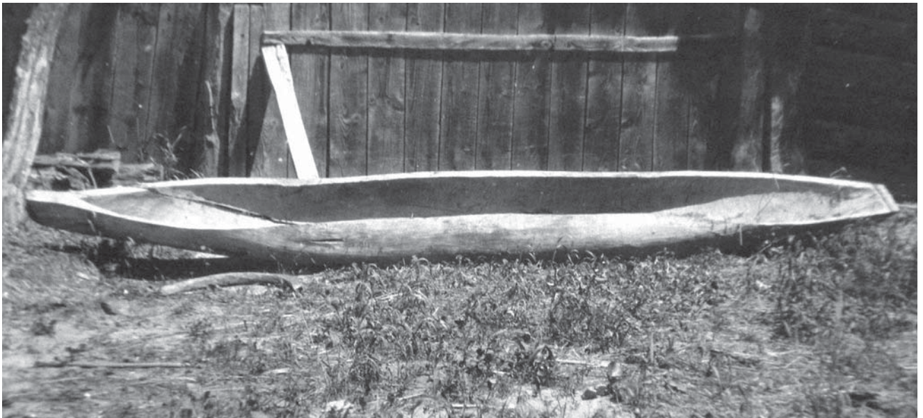
Рис. 8. Фото Д. Демуцького «Готовий «човен у колоді», який ще не розвернений, с. Старосілля, Жукинська волость, Остерський повіт, Чернігівщина, 1922 р.» (колекція НМІУ)