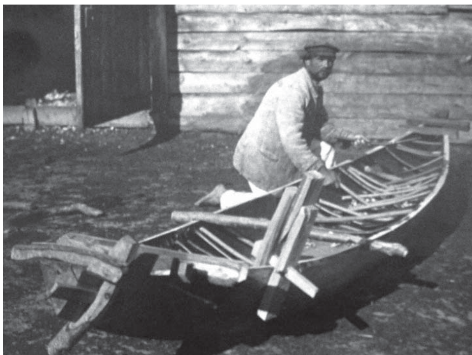
Рис. 14. Фото Д. Демуцького ««Роз- вернений човен» (у середині багато встав- лено «цурок», а на боці та носі причеплені «лисиці»), с. Старосілля, Жукинська волость, Остерський повіт, Чернігівщина, 1922 р.» (АНФРФ ІМФЕ)