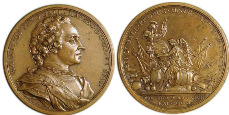
Рис. 6. Бронзовая медаль 1747 г. с бюстом Морица Саксонского вправо, диаметр 54 мм