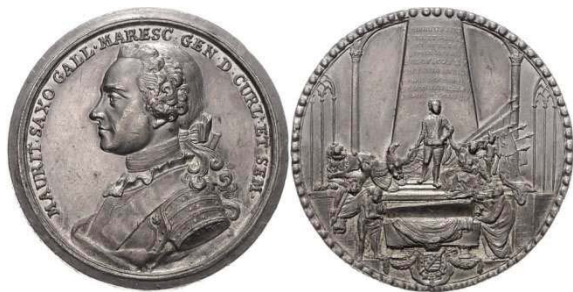
Рис. 2. Оловянная медаль с изображением саркофага Морица Саксонского, диаметр 56 мм – подпись гравера Кам

Rv.: MAURITIO SAXO / CURL ET SEMIGAL / DUCI SURE EXTUR/ SEMPER VICTOR / LUDOVICUS XV / VICTORIA AUCTOR / ET IPSE DUX PONI JUSSIE / CAMBORITI XXX NOV A MDCCL AETATIS LV, надгробный памятник.