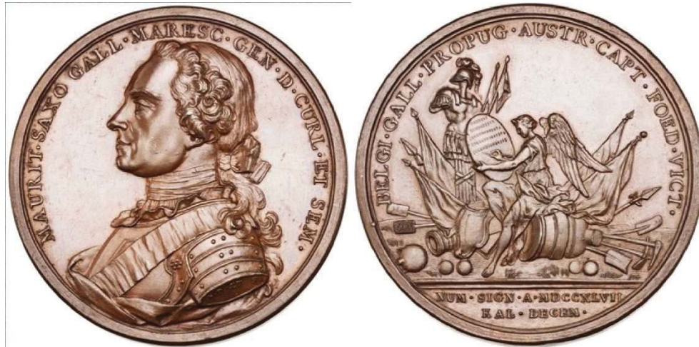
Рис. 7. Бронзовая медаль 1747 г. с бюстом Морица Саксонского влево, диаметр 54 мм

Американскому нумизматическому обществу принадлежит другая битая бронзовая медаль тех же авторов с бюстом Морица Саксонского влево с надписью на обресе предплечья I. D. ET F. – “Жан Дасье и сын” (Jean Dassier Jacques-Antoine Dassier) с идентичным реверсом. Диаметр медали 54 мм, вес 67,5 г (рис. 7). Такая же частично позолоченная медаль принадлежит нью-йоркскому музею “Метрополитен” (Metropolitan Museum of Art, 36.110.42). Исходя из времени жизни Жана Дасье (1676–1763) и его сына Жака Антуана Дасье (1715–1759) 1 , надо полагать, что им принадлежит первенство в создании медальерного бюста Морица Саксонского.