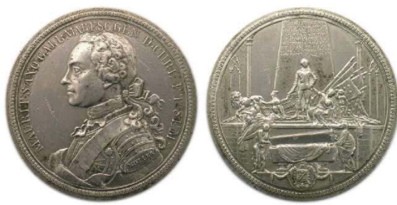
Рис. 3. Медаль с изображением саркофага Морица Саксонского, диаметр 55 мм – подпись гравера Müller

Литературные источники называют имена трех медальеров: “Kamm, Müller et Daumy”, размер от 50 до 53 мм и в качестве материалов – бронзу и свинец (рис. 2-3) 4 . Отмечена также медаль диаметра 55 мм из олова 5 .