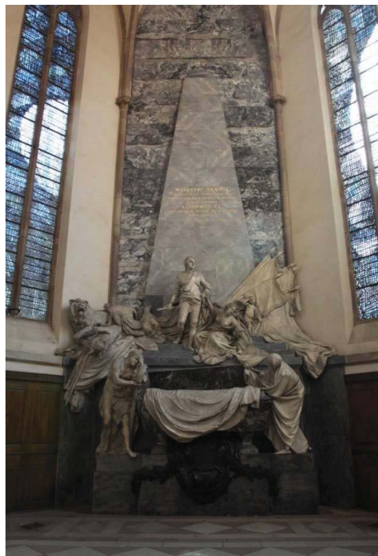
Рис. 5. Саркофаг Морица Саксонского в кирхе Сен-Тома г. Страсбурга (Франция)

В коллекции исторических и коммеморативных медалей Бенджамина Вайса имеется битая бронзовая медаль с легендой в экзерге NUM. SIGN. A. MDCCXLVII KAL. DECEM. (декабрьские календы 1747 г.) с бюстом Морица Саксонского вправо с надписью под обрезом плеча I.D. ET FIELS F. – “Жан Дассье и сын резали” (Jean Dassier, Jacques-Antoine Dassier). Диаметр медали 54 мм (рис. 6) 3 .