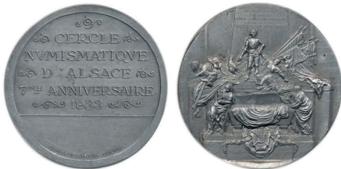
Рис. 4. Свинцовая медаль 1933 г. в честь седьмого юбилея общества нумизматов Эльзаса с повторением реверса медали с изображением саркофага Морица Саксонского

Существует медаль 1933 г. диаметра 60 мм с курсивной легендой на реверсе “Müller fecit 1828” (рис. 4). Эта легенда дает дату исполнения штемпеля реверса одним из медальеров – Мюллером (рис. 3). Вероятно,