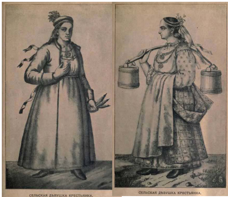
Рис. 8. Дукач в наряде сельских украинских девушек (по Ефименко А. Я.)

Дукачи, как предмет не массового ремесленного производства, встречаются довольно редко (рис. 8) 2 . Они могли делаться как из оригинальных монет и медалей, так и из литых или штампованных копий точно или частично повторяющих оригинал. Например, дукач из талера Марии Терезии 1750 г. хранится в Тракайском историческом музее 3 . Позолоченный дукач 18 в. из отливок (материал не указан) по образцу двух различных российских медалей находится в собрании Государственного Эрмитажа 4 .