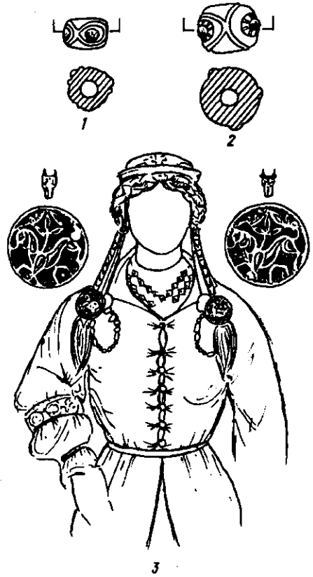
Рис. 2. Намисто з поховань: 1 — тип 58; 2 — тип 60; 3 — реконструкція прикрас волосся жінки з могильника II Тисаеслар-Башлахом (за І. Діенешем).

У зв'язку із знахідкою в могильнику Тисаеслар-Башлахом II І. Діенеш висловлюється: «Біля черепа із обох боків у купі кольорових намистин і круглих платівок з черепашок знайдена пара золочених срібних круглих, ажурних пластинок». Ці пластинки аналогічні посрібленим бронзовим пластинкам з могильника Нірачад-Сентирманфольдек. Ремінь застібки пласти-