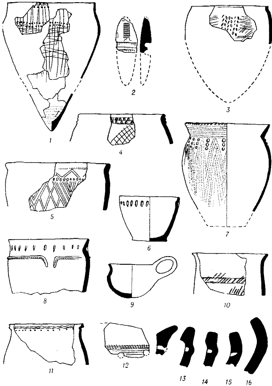
Рис. 1. Різночасна кераміка з ур. Загай поблизу с. Козинці.

Як розповідають мешканці, в одному місці над озером, де багато неолітичної кераміки, після великих весняних розмивів помічалось чимало скелетів з витягнутими вздовж тулуба верхніми кінцівками, а також у скорченому стані. Пісок навколо них був червоний. Можливо, тут трапився могильник мариупольського типу, які дуже численні в Наддніпрянжі.