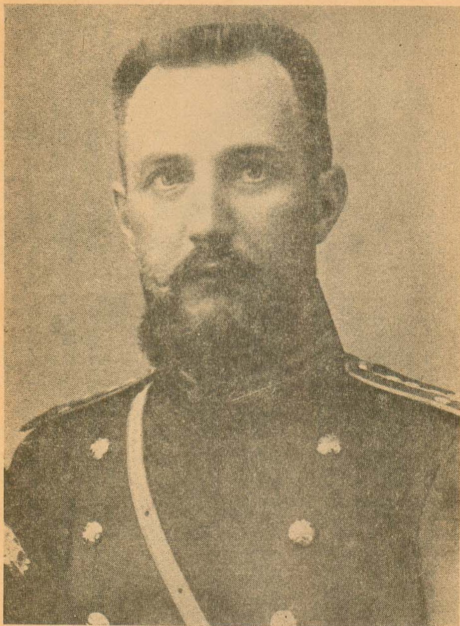
Ген. В. СІКЕВИЧ