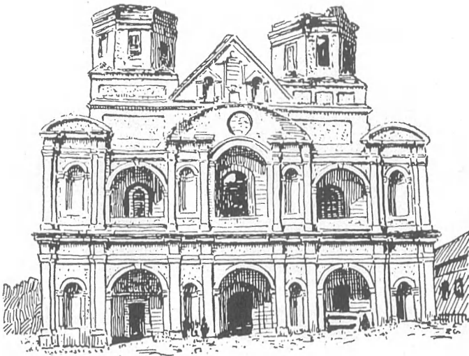
Рисунок Успенської катедрі у Володимирі-Волинському перед перебудовою кінця XIX віку.