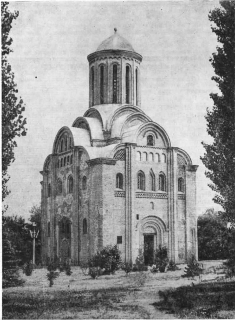
Рис. 5. П'ятницька церква після відкриття в ній музею.

ня й були відновлені відповідні фрагменти споруди. На західних пілонах храму експоновано графічні матеріали — план Чернігова з позначенням місця розташування пам'ятки, план її з добудовами XVII—XIX ст., а також коротку довідку про історію П'ятницької церкви. В ніші північного порталу — малюнок храму до 1941 р., а також його фотографії 1943 р. та креслення проекту реставрації.