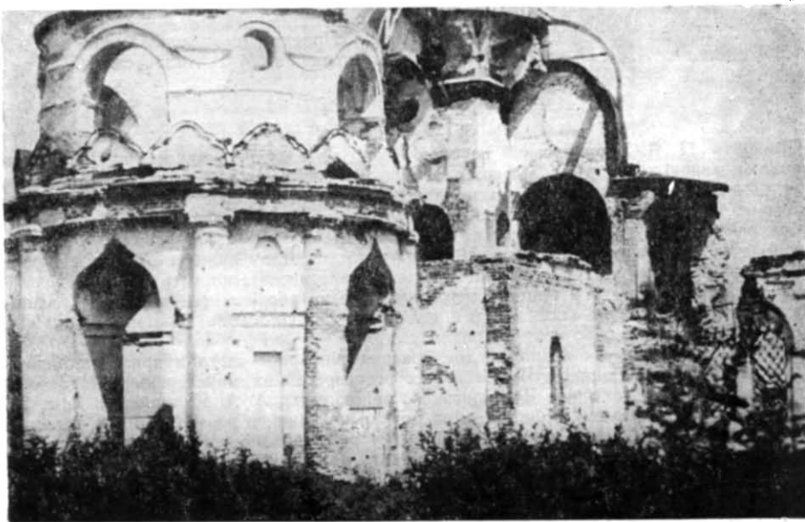
Рис. 2. Руїни П'ятницької церкви в 1941—1943 рр.