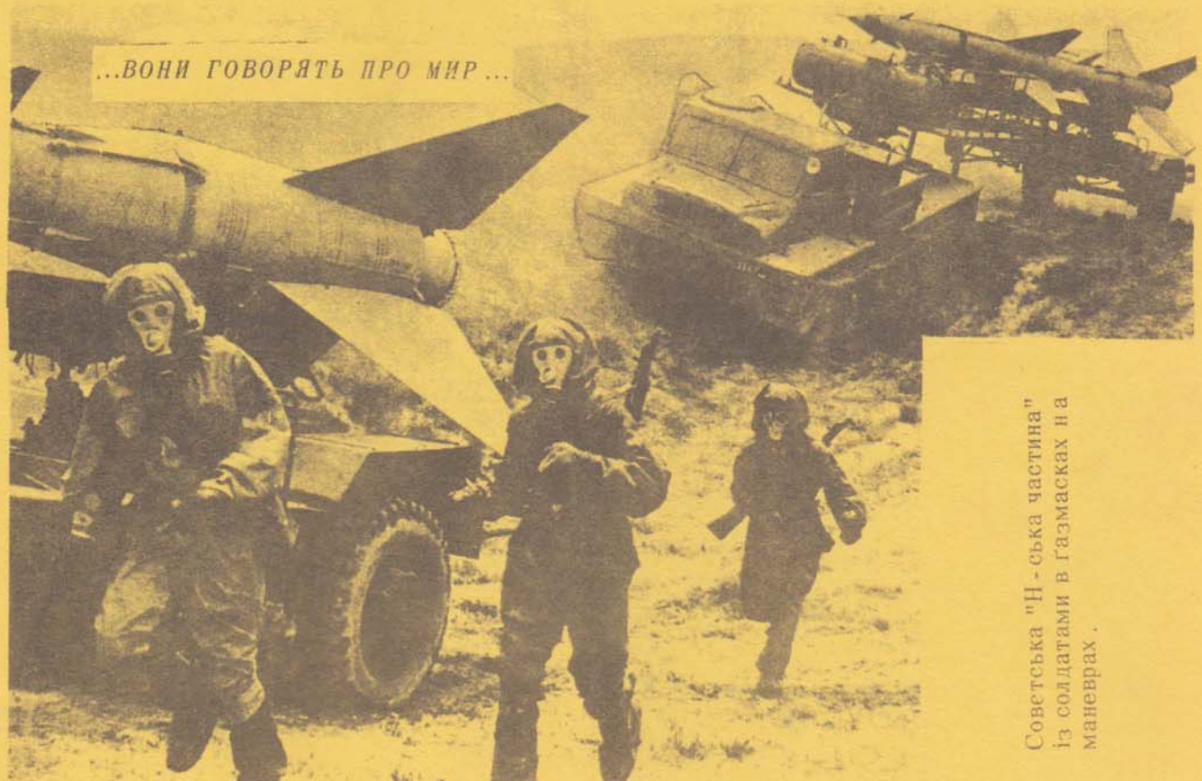
Советська "Н-ська частина" із солдатами в газмасках на маневрах.