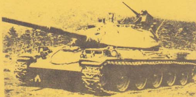
Японський танк у зниженому профілі.

Японія затратила 6 мільйонів доларів на удосконалення цього панцерника та буде послугуватися ним для операцій головного ударного танка.