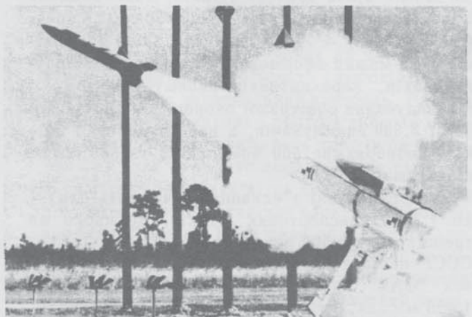
Американська ракета "САМ-Д" під час запуску на об"єкт в повітрі.

*) "Господарство Гальванеску" – роман Смолича про досліди над створенням живих роботів з людей шляхом заміни крові певним хемікалем.