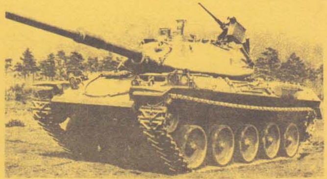
Той самий танк піднятий вище.