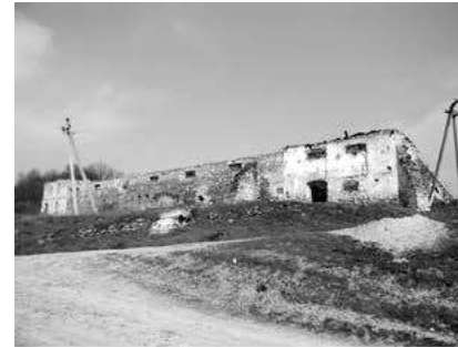
Мал. 6. Південний фасад маєтку баронів Местмахер у с. Песець Новоушицького району. Господарські приміщення, стайні над шляхом. Вид з боку яру р. Данилівка. Березень 2017 р.