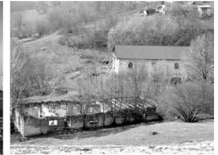
Мал. 7. Будівлі спиртзаводу над р. Данилівка маєтку баронів Местмахер у с. Песець Новоушицького району. Вид з північного сходу, зі сторони садиби. Фото автора. Березень 2017 р.