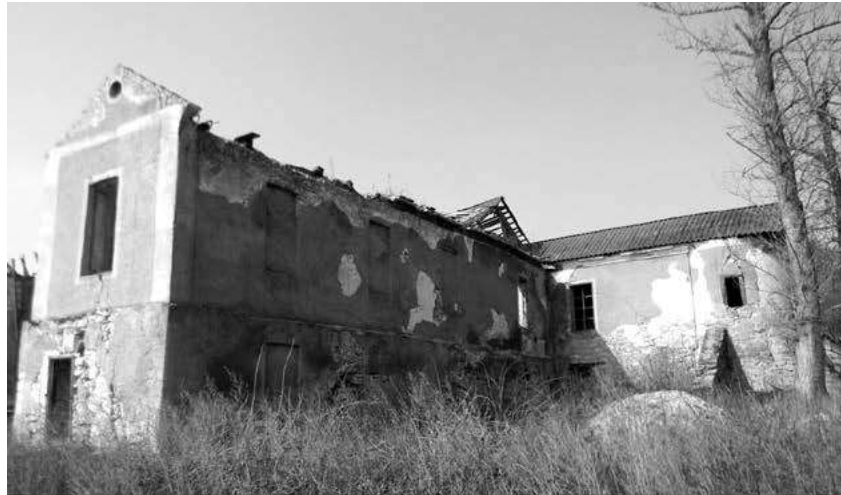
Мал. 4. Північно-східний фасад садиби баронів Местмахер у с. Песець Новоушицького району. Березень 2017 р.