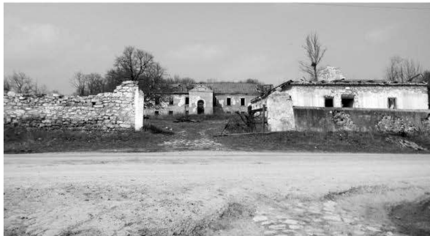
Мал. 5. Центральний східний фасад садиби баронів Местмахер з мисливським флігелем (праворуч) та в'їзними воротами з прилеглими мурами у с. Песець Новоушицького району. Березень 2017 р.