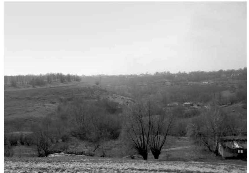
Мал. 8. Вид зі сторони садиби маєтку баронів Местмахер на яр р. Данилівка та с. Песець Новоушицького району. Вигляд з півночі. Березень 2017 р.