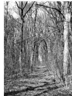
Мал. 2. Алея парку маєтку баронів Местмахер у с. Песець Новоушицького району. Вид зі сходу. Березень 2017 р.