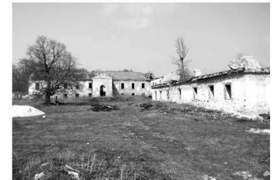
Мал. 3. Центральний східний фасад садиби баронів Местмахер з мисливським флігелем (праворуч) у с. Песець Новоушицького району. Березень 2017 р.