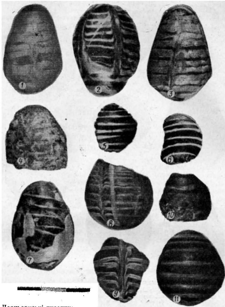
Рис. 2. Давньоруські писанки:

1 — літописна Родня (Княжа гора) Канівського р-ну; 2 — с. Кононча Канівського р-ну; 3 — с. Грицаїці Канівського р-ну; 4 — Канівський р-н; 5-7 — с. Ліплява на Черкащині; 8-11 — невідоме місце знахідки.