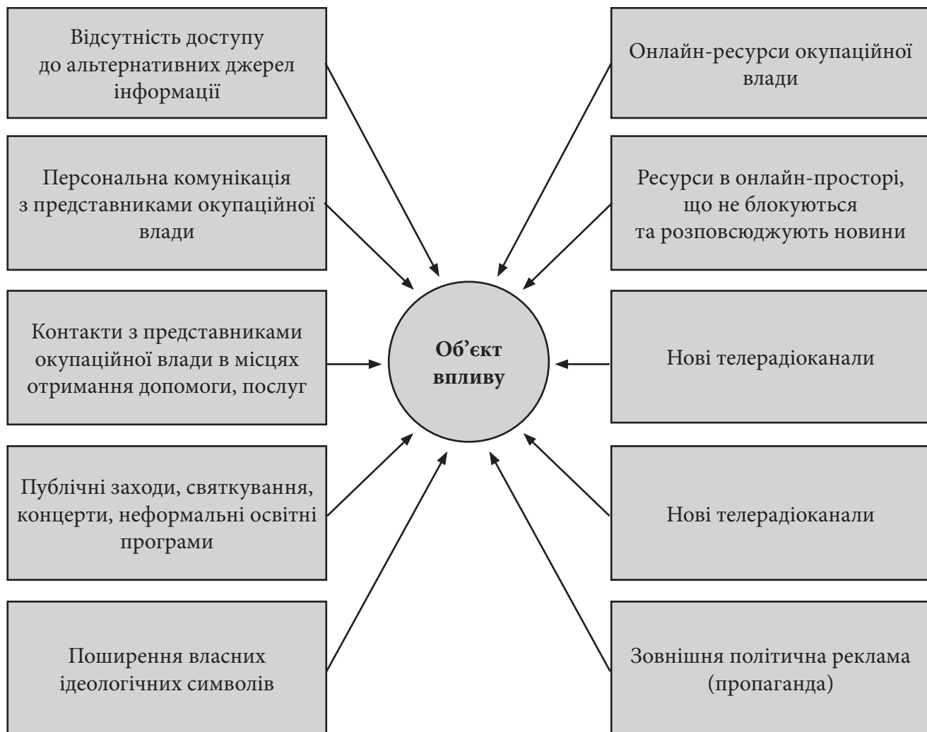
Рис. 2. Модель інформаційного впливу на місцеве населення в умовах тимчасової окупації Джерело: складено автором.

Усі елементи моделі комунікаційної стратегії держави-окупанта спостерігаємо нині на тимчасово