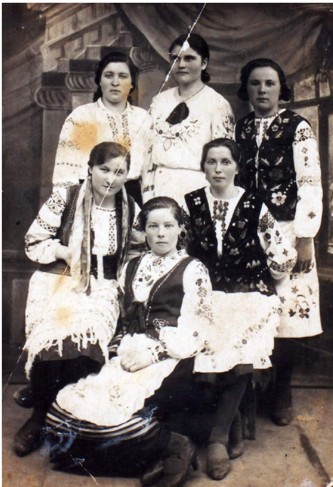
Рис. К. 18. Молодь громади АСД с. Свинюхи, Горохівського повіту. 1939 р.