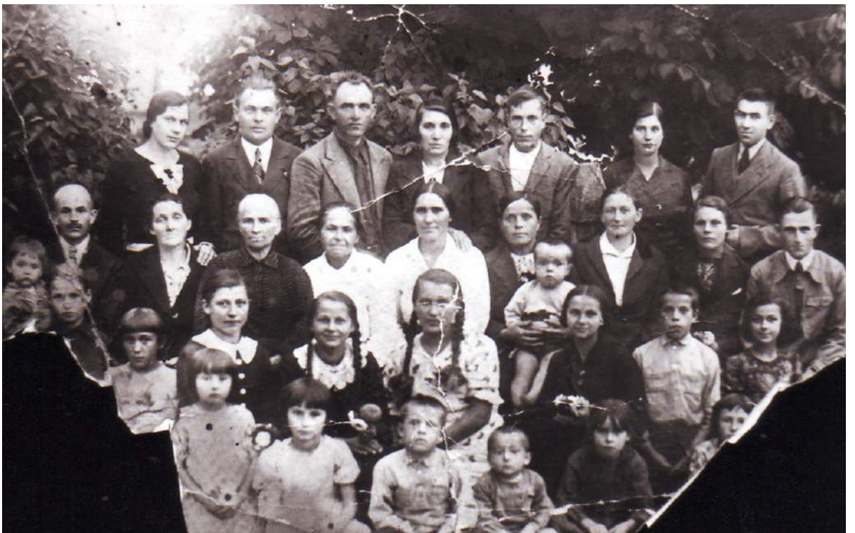
Рис. К. 17. Громада АСД м. Маневичі. 1936 р.