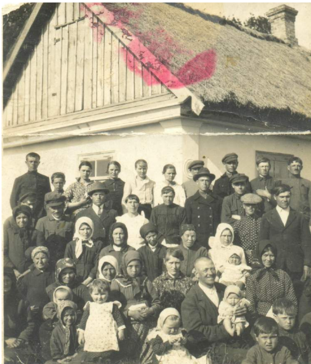
Рис. К.1. Члени церкви АСД с. Свинюхи Горохівського повіту, Волинського воєводства біля молитовного будинку. 1925 р.