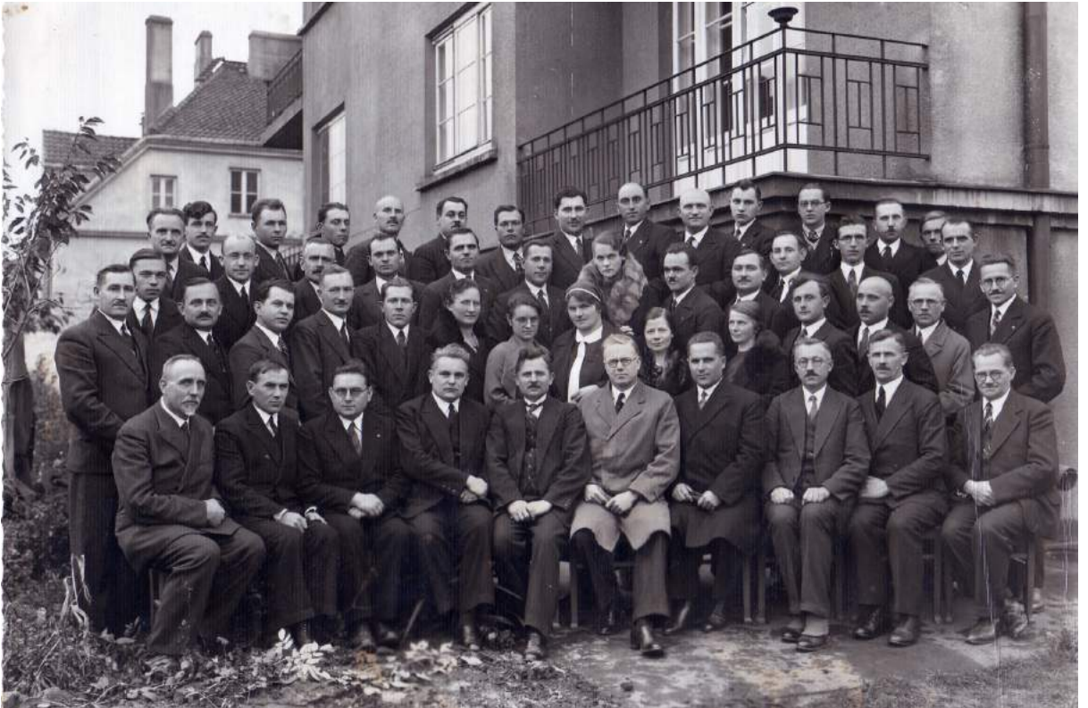
Рис. К. 16. Навчання для пасторів Польського уніону АСД. Варшава. 1934 р.