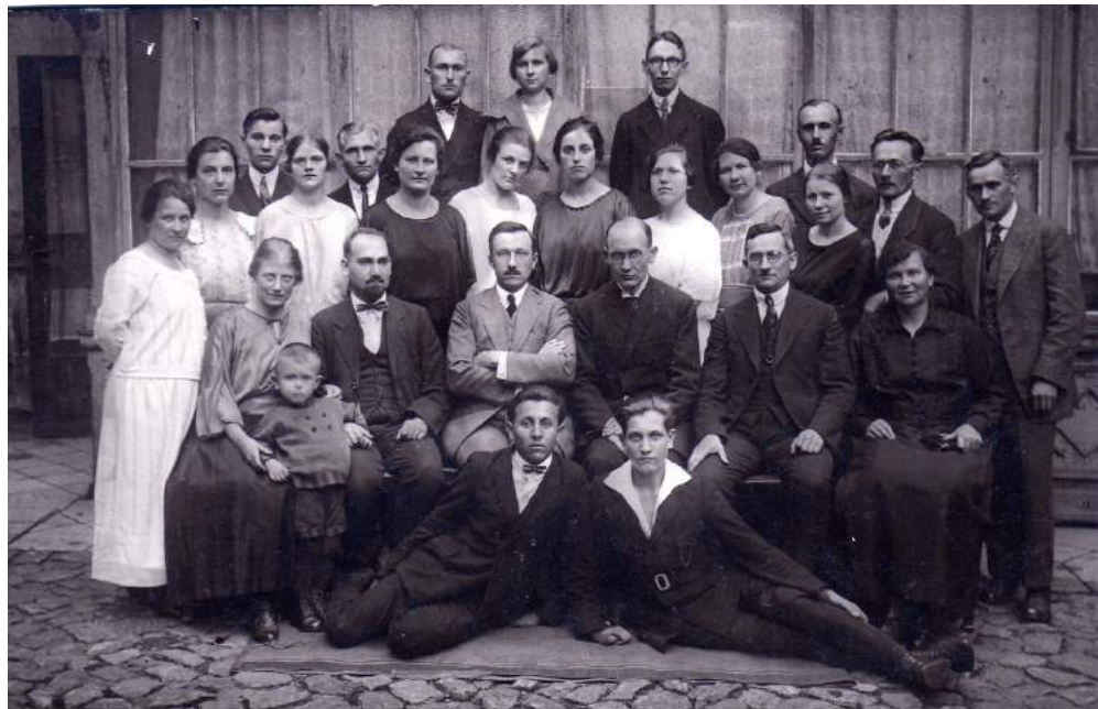
Рис. К. 3. Варшава. Працівники видавництва «Поліглот». 1937 р.