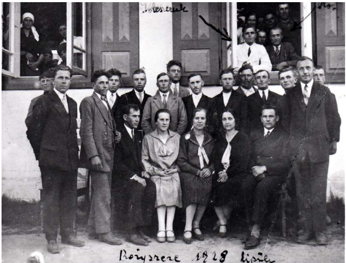
Рис. К. 11. Служителі Східної конференції біля дому молитви с. Пожарки.