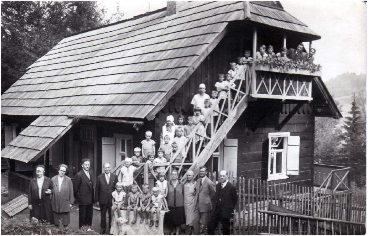
Рис. К. 12. Адвентистський притулок «Адвент» для дітей у Віслі. 1935 р.