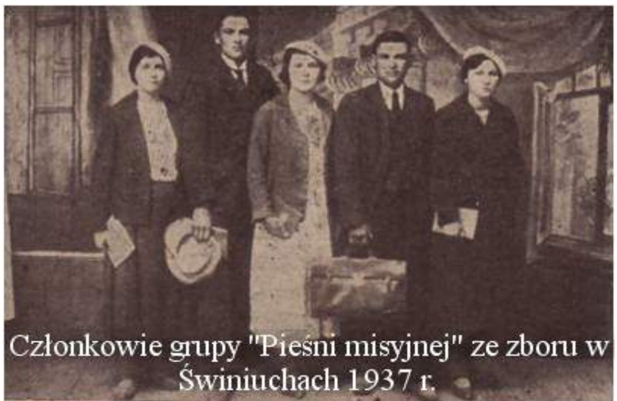
Рис. К. 5. Члени групи «Місійної пісні» громади с. Свинюхи в 1937 р.