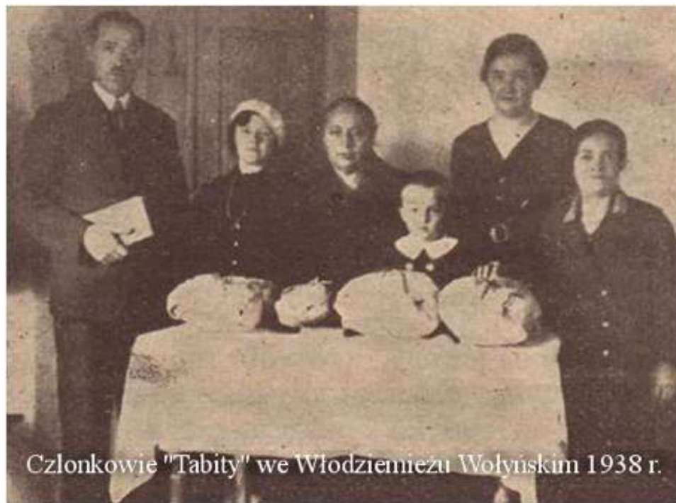
Рис. К. 6. Члени «Тавити» церкви АСД громади у Володимирі. 1938 р.