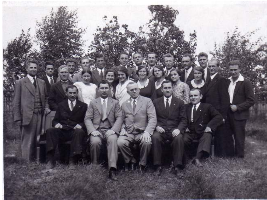
Рис. К. 14. Курс колпортерів-євангелістів с. Пожарки. 1933 р.