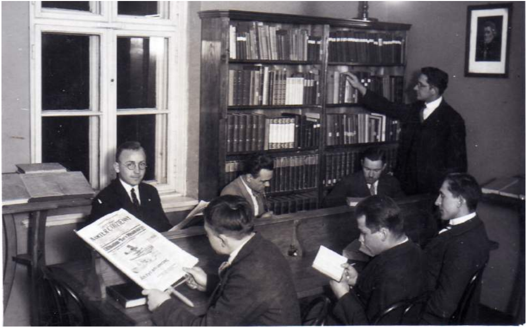
Рис. К. 10. Бібліотека теологічної школи «Огніско». 1928 р.