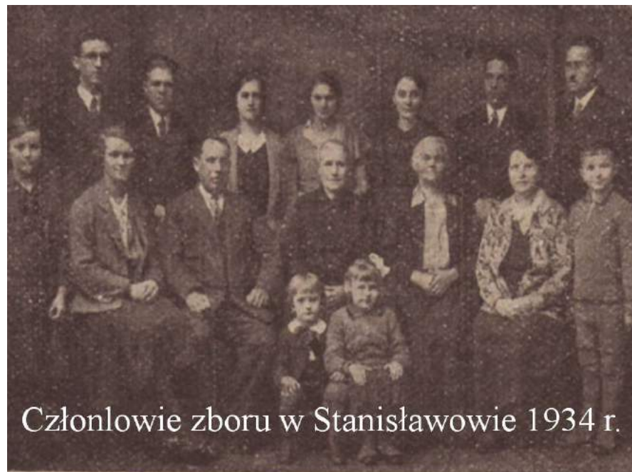
Рис. К. 7. Члени Станіславівської громади АСД. 1934 р.