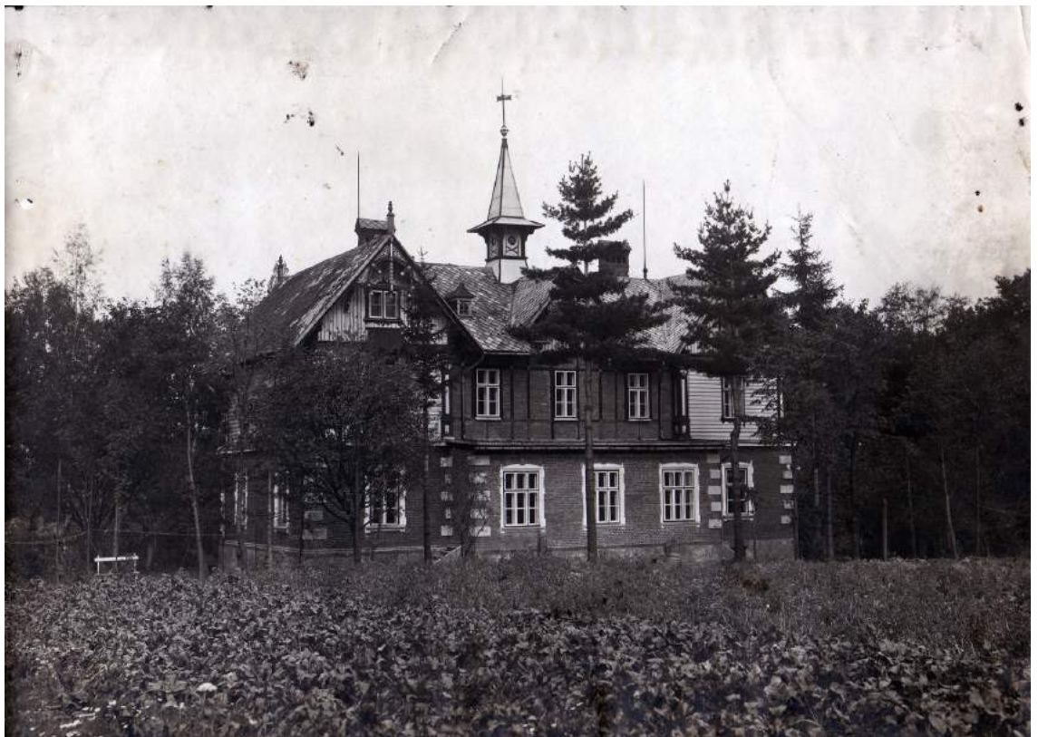
Рис. К. 9. Приміщення теологічної школи церкви АСД «Огніско» у Бельсько-Бялій. 1926 р.