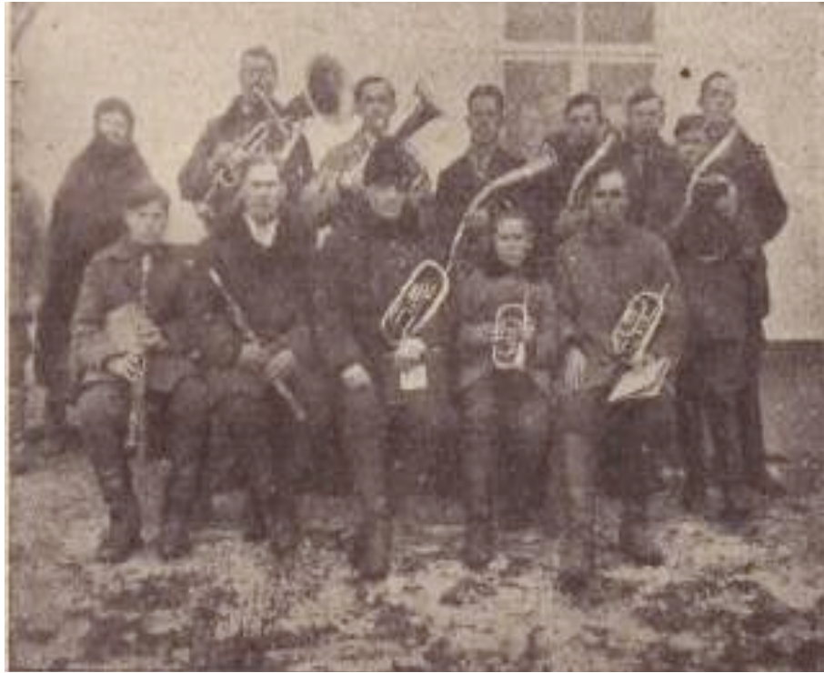
Рис. К.2. Духовий оркестр громади АСД с. Свинюхи Горохівського повіту, Волинського воєводства. 1932 р.