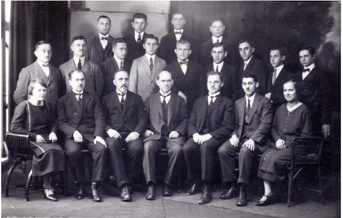
Рис. К. 8. Курси для пасторів у Бидгощі. 1925 р.