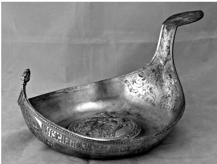
Рис. 3. Ківш жалуваний. Російська імперія. РДМ-923.

Слід згадати ще чотири срібні жалувані ковші (РДМ-923, 964, 966, 967), що відповідно мають номери КХПНМ: ХП-317, 311, 313, 315 (рис. 3, 4).