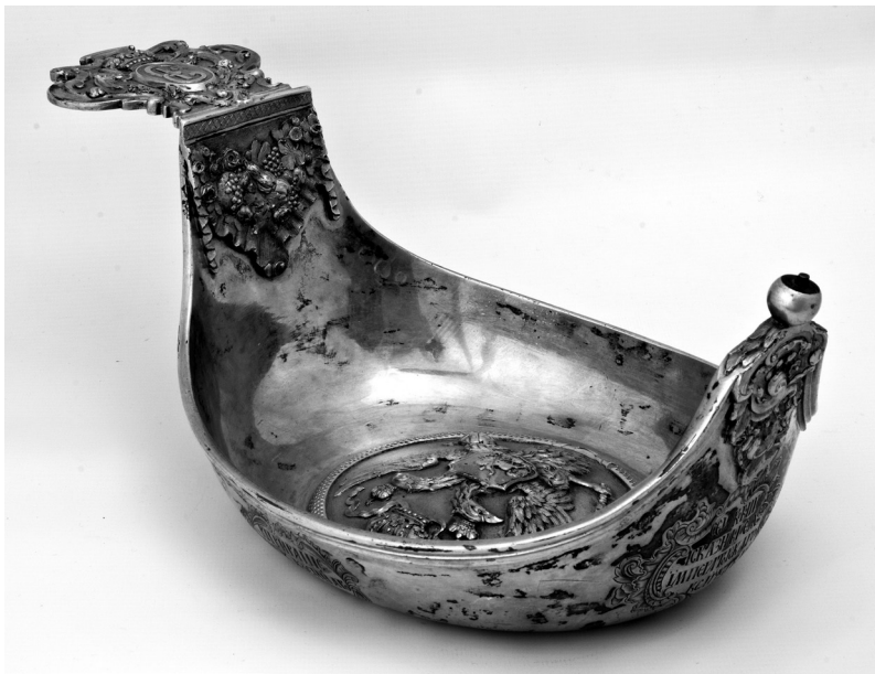
Рис. 4. Ківш жалуваний. Російська імперія. РДМ-966.

Отже, в колекції дорогоцінних металів НМІУ зберігається 9 предметів з шифром «ХП», в 1909 р. записаних до інвентарної книги КХПНМ як такі, що надійшли «...по духовному заповіщанню Д. С. Федорова» [2]. З колекції Д. С. Федорова, певно, походять ще кілька предметів з зібрання НМІУ. Тому логічним було знайти відповідь на питання: хто ж цей чоловік?