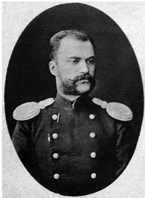
Рис. 5. Портрет Д. С. Федорова

Перші відомості про нього ми отримали з інтернет-ресурсів: «Федоров Дмитрий Сергеевич (1855–?), из московских дворян, сын действительного статского советника Сергея Петровича Федорова и Екатерины Александровны, урожд. Быковой, корнет Кавалергардского полка (1875), поручик (1879), в 1885 г. – ротмистр, в 1889 г. – надворный советник, чиновник особых поручений при киевском генерал-губернаторе, в 1890 г. – камер-юнкер, в 1891 г. – волынский вице-губернатор, в 1894 г. – камергер, киевский вице-губернатор и почетный гражданин Житомира; в 1896 г. – причислен к Министерству внутренних дел, в 1906 г. – действительный статский советник. Сослуживец М.М. Осоргина по Кавалергардскому полку, друг Я. Г. Жилинского и А. А. Киреева» [3] (рис. 5).