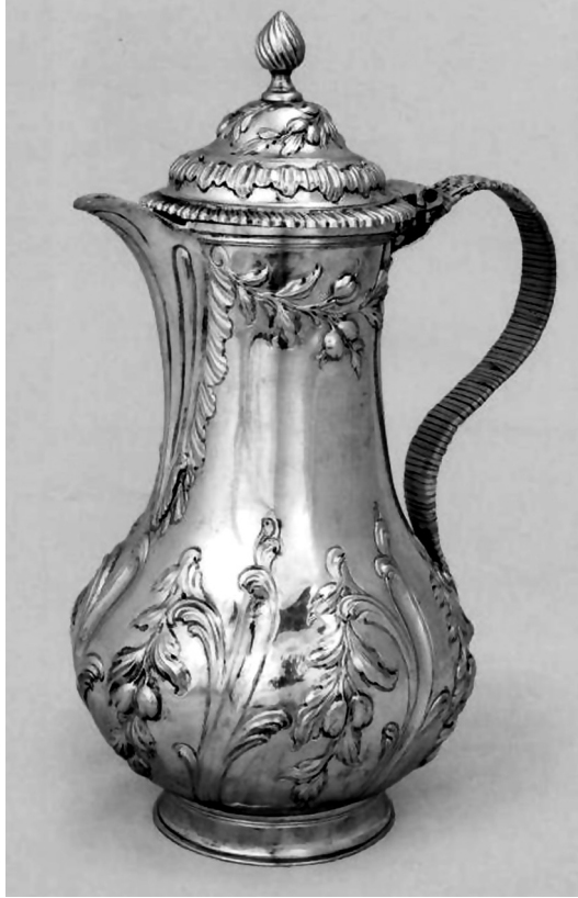
Рис. 2. Кавник. Велика Британія, XIX ст. РДМ-1342.

Прикрашений карбованим рослинним орнаментом кавник (ХП-301), що має кілька англійських та російських клейм, має сучасний інв. № РДМ-1342 (рис. 2).