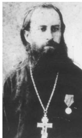
Леонід Іванович Гошкевич

М. І. Гошкевича переїхати до Херсона і зайняти посаду секретаря губерньського Статистичного комітету. Вже у перший рік свого перебування в місті В. І. Гошкевич організує в структурі комітету Археологічний музей. В 1898 р. музей переходить до відомства Херсонської губерньської вченої архівної комісії, співзасновником якої також був В. І. Гошкевич.