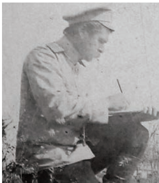
Федір Васильович Фабриціус

Того ж року В.О. Сухомлинов отримав призначення на посаду військового міністра Російської імперії. На новій посаді він спирається на своїх київських друзів, серед яких опинився й М.М. Гошкевич. За протекцією В.О. Сухомлинова він обійняв посаду столоначальника в Міністерстві торгівлі та промисловості Російської імперії, а згодом завідував навчальними закладами в системі цього міністерства. Слідом за донькою переїхала до Петербургу й К.О. Бакановська-Гошкевич.