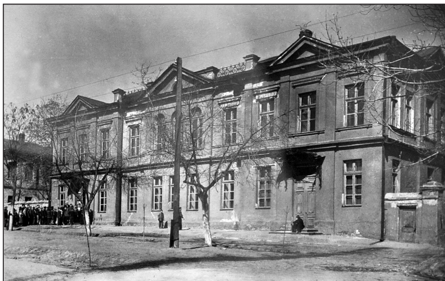
Рис. 7. Херсонський історично-археологічний музей.

цювати науковим співробітником в Інституті археології АН УРСР. Донька залишилася в Ленінграді, де розпочала навчання в Ленінградському університеті. Продовжуючи збирати матеріали для «Археологічної карти», І.В. Фабриціус працювала в багатьох музеях Південної України — в Кіровоградському, Миколаївському та Одеському.