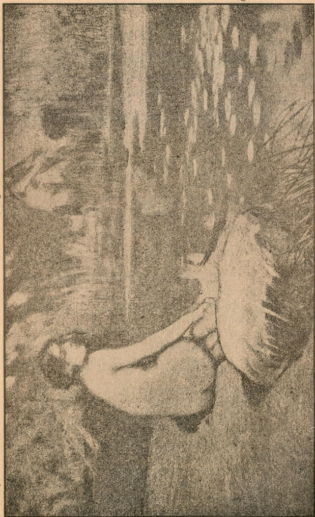
Сяде на пісочку...