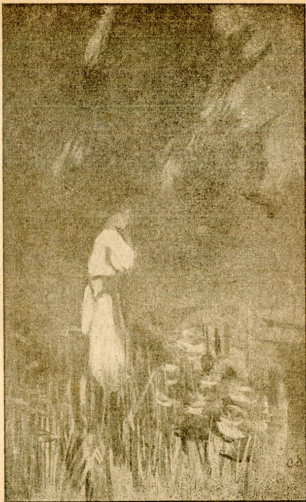
Щось біле блукає...