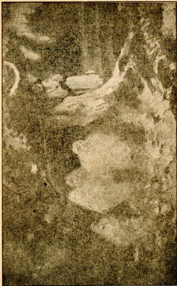
Кругом дуба русалоньки Мовчки дожидали...