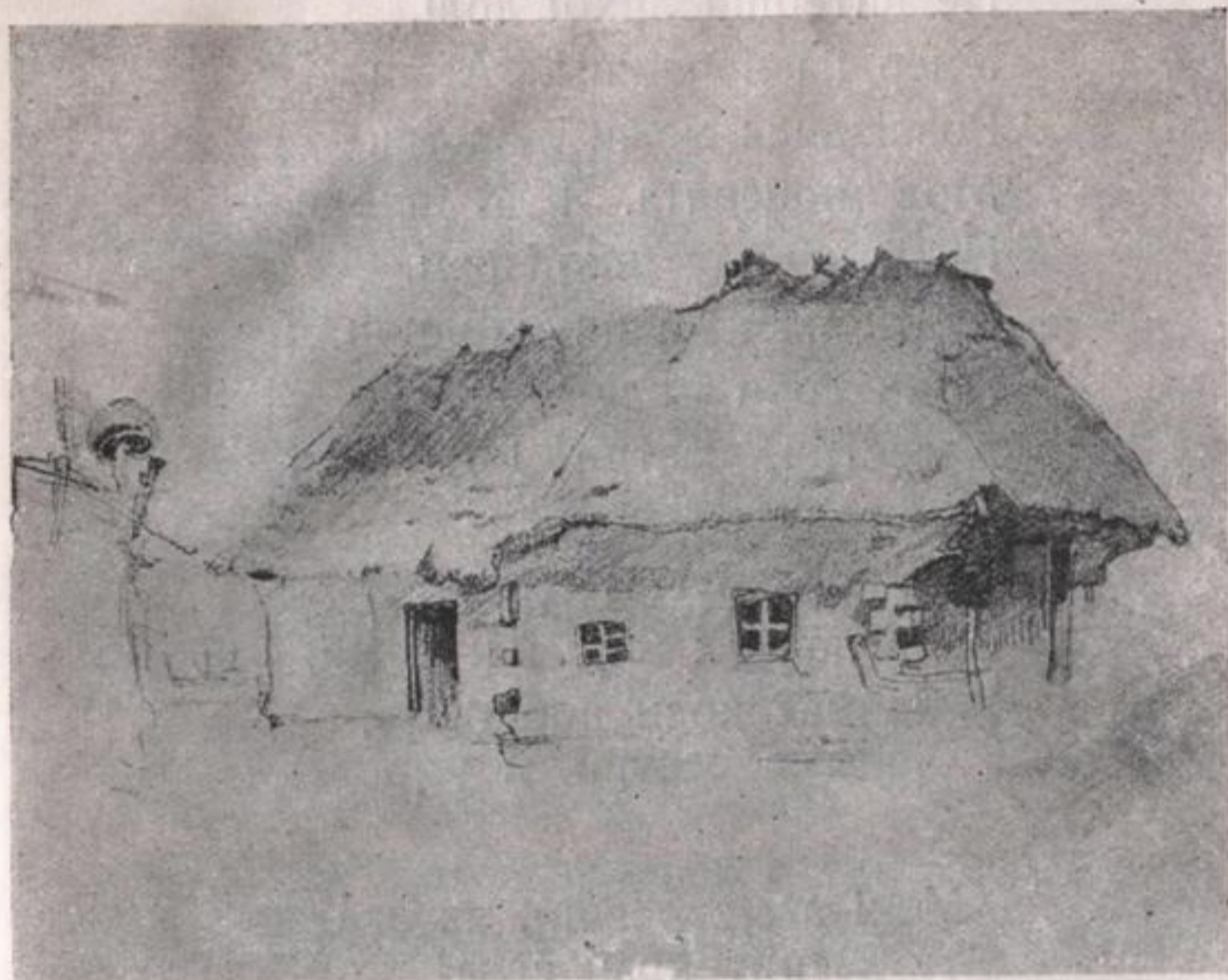
Хата Гр. Ів. Шевченка (батька поета) в Кирилівці.