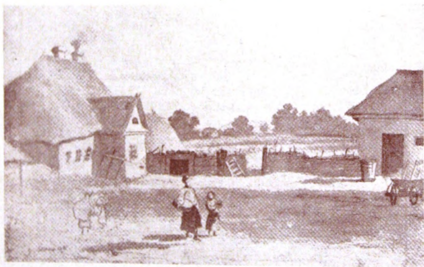
Село В'юнища на Полтавщині