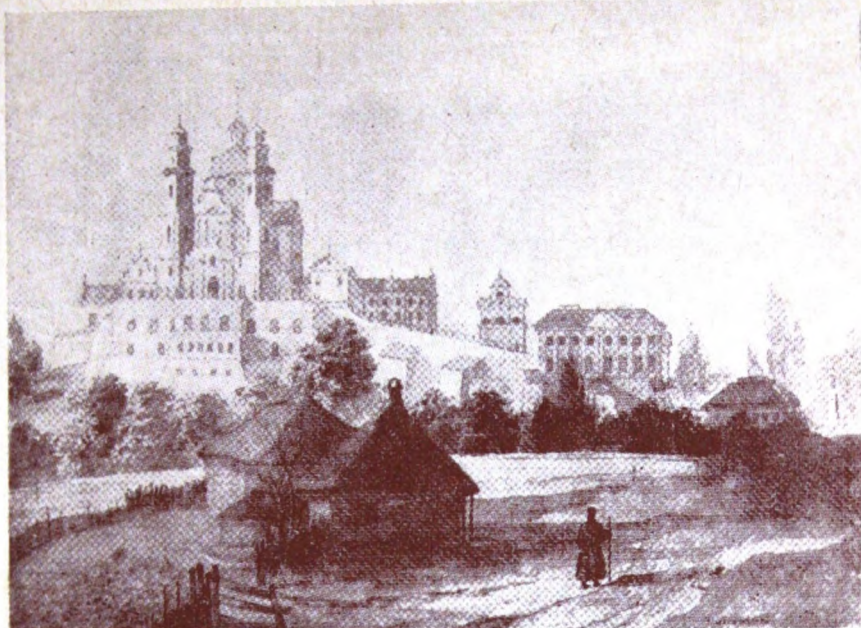
Почайвська Лавра з півдня