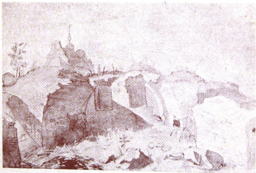
Богданові руїни в Суботові