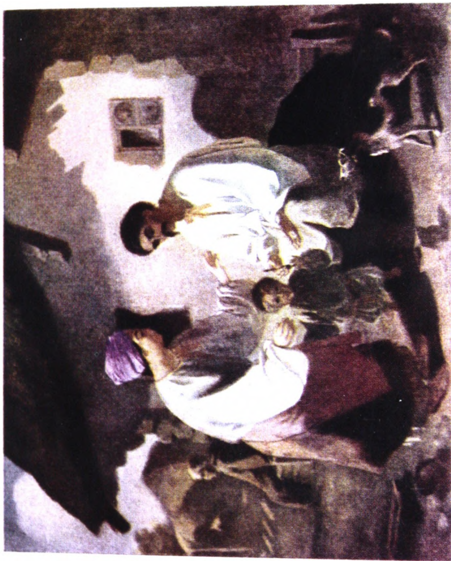
Селянська родина, 1843 р. (о.лія).