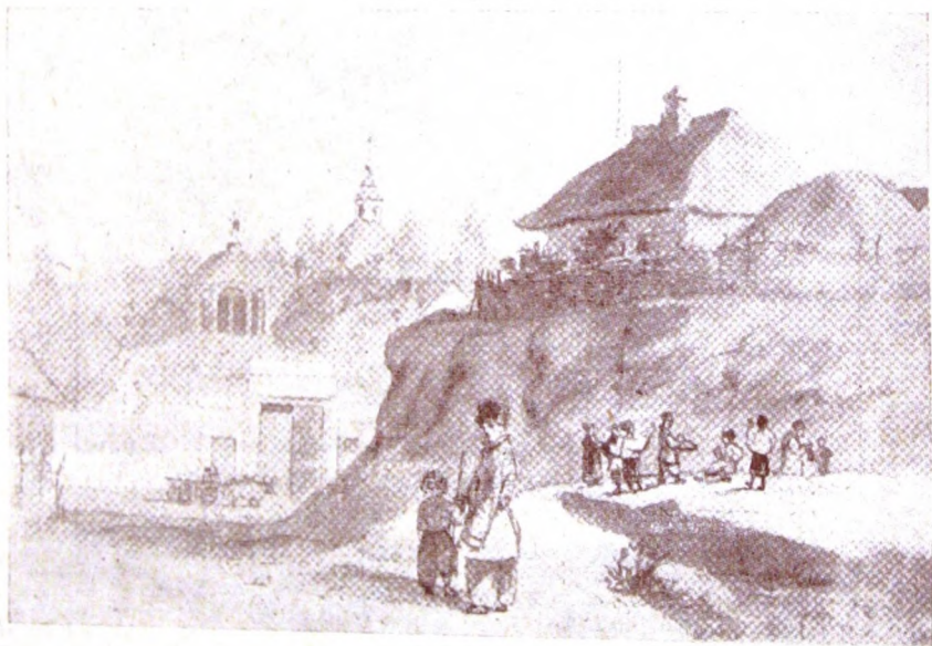
Село Решетилівка на Полтавщині