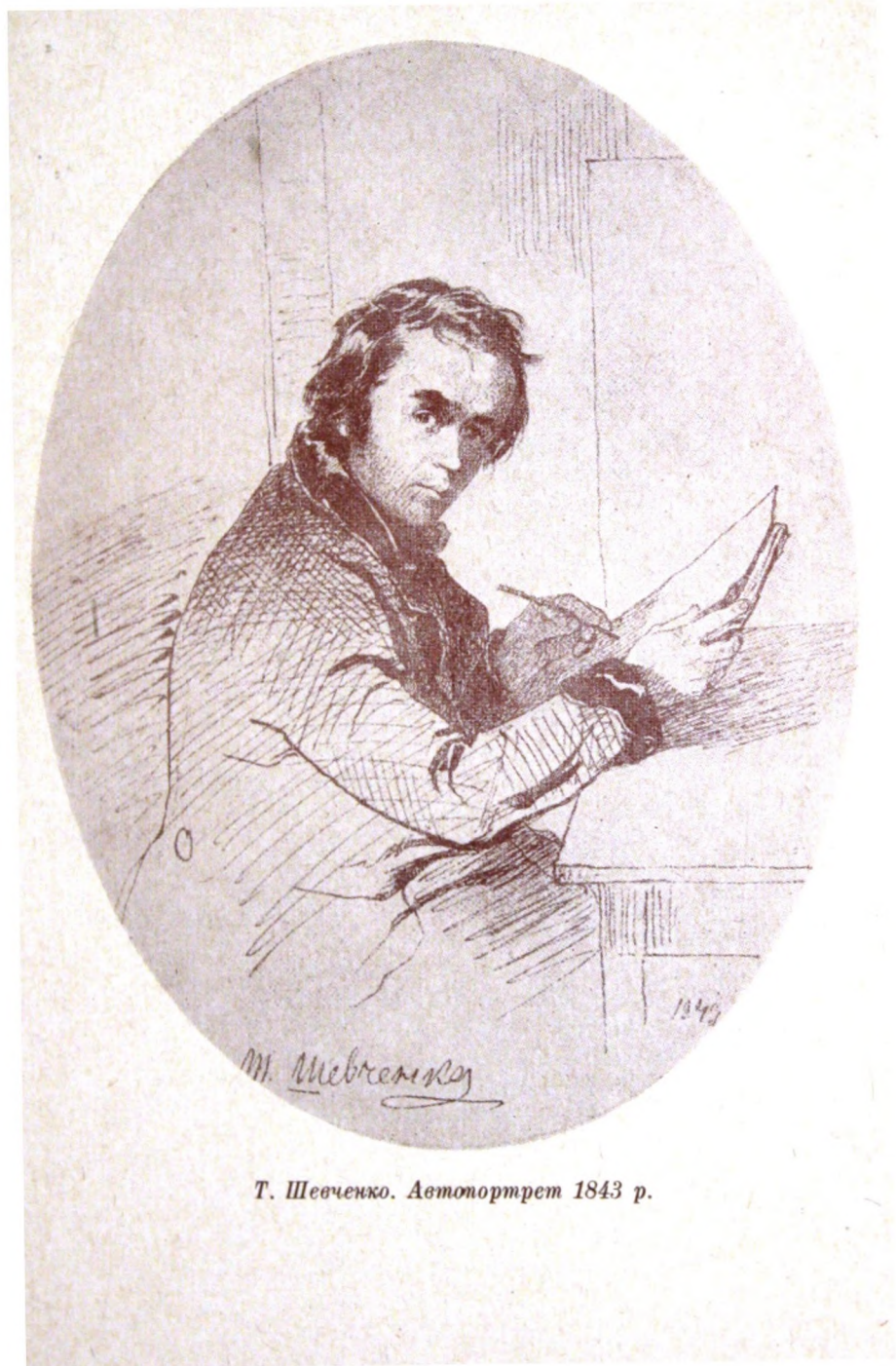
Т. Шевченко. Автопортрет 1843 р.