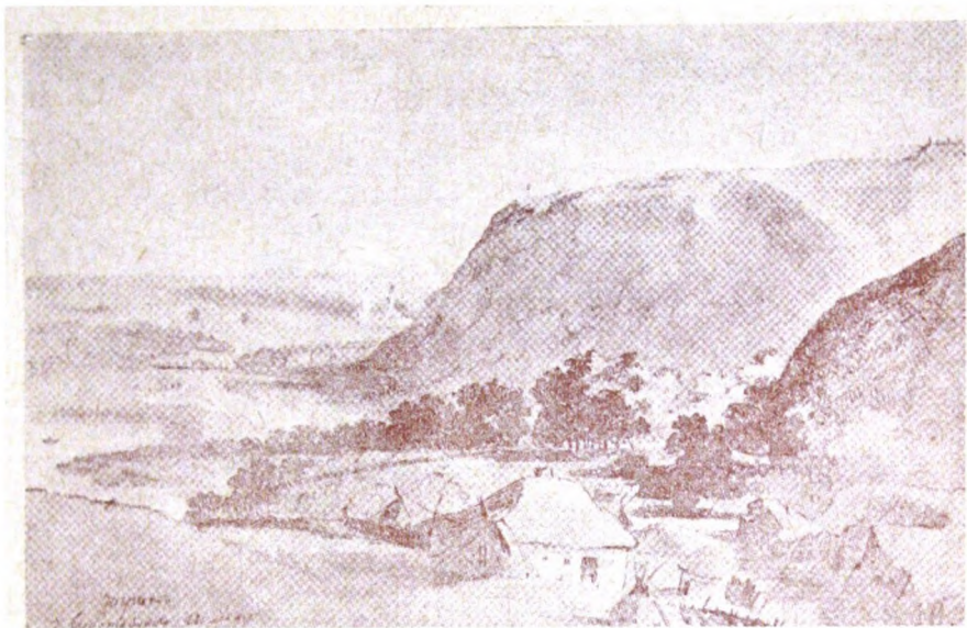
Чигирин із шляху до Суботова