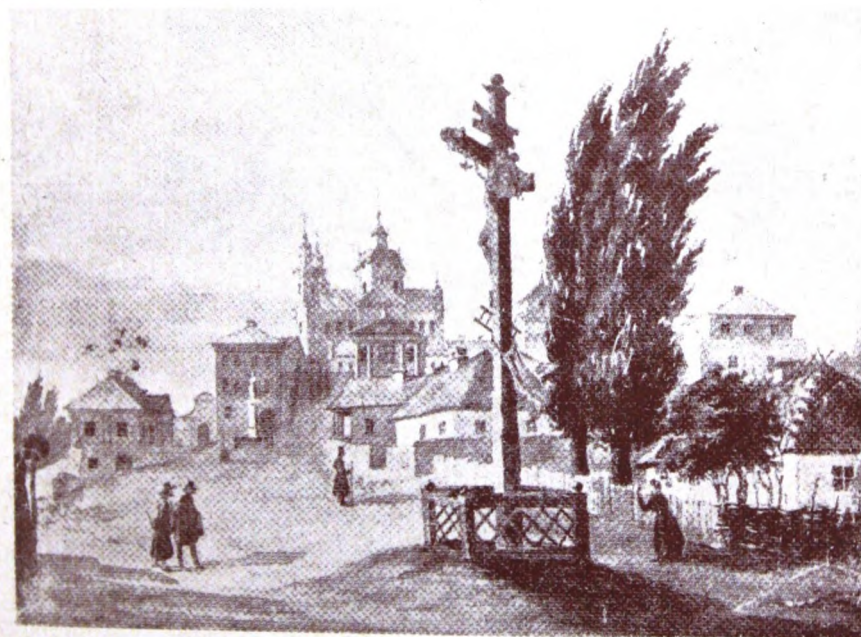
Почайвська лавра із заходу