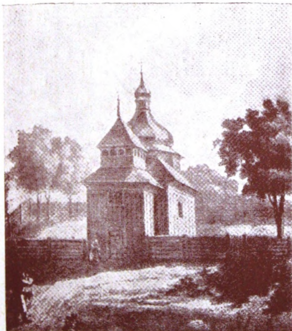
Церква в с. Сехуні