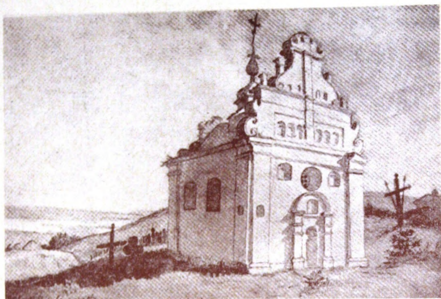
Богданова церква в Суботіві