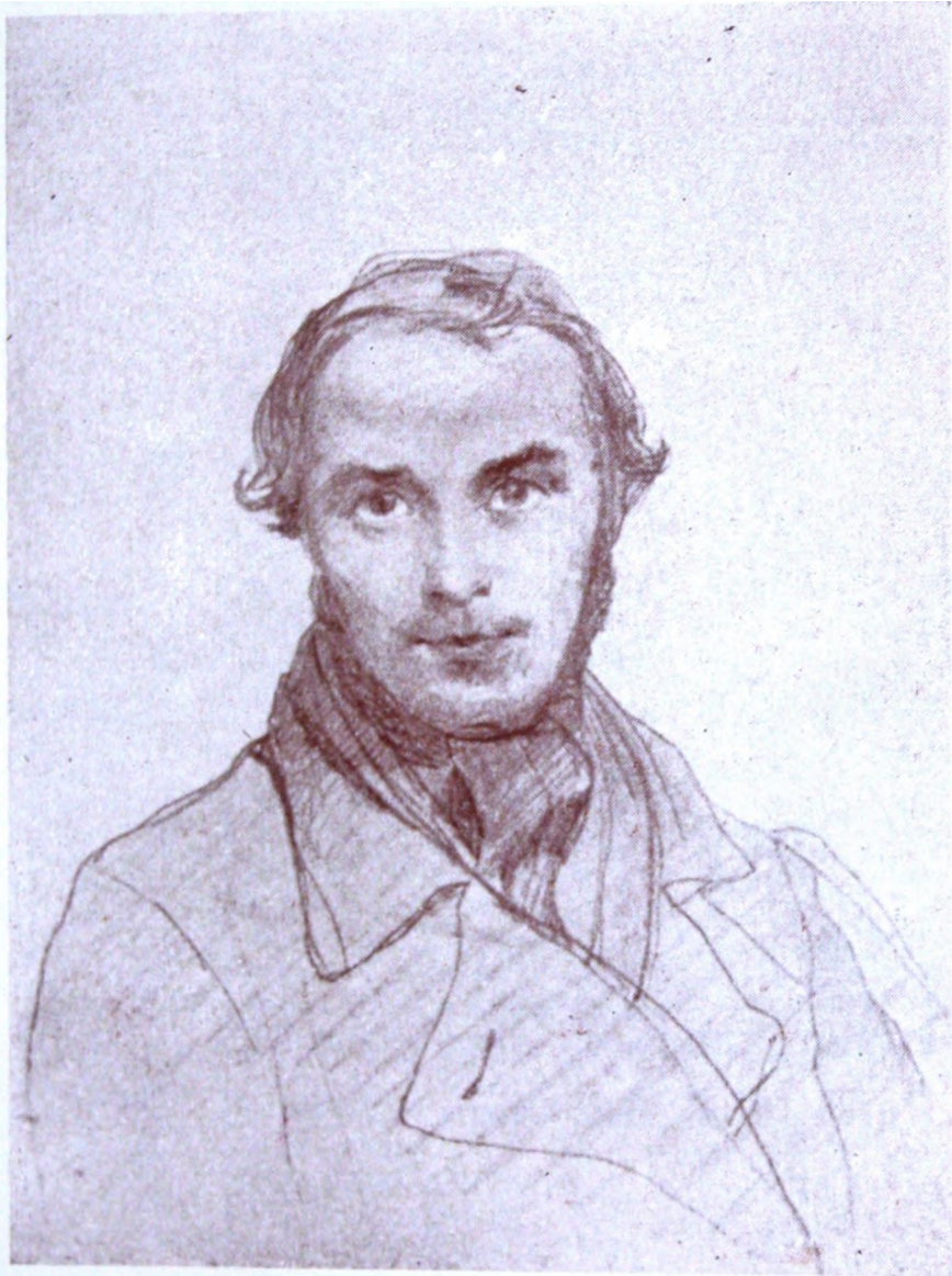
Т. Шевченко. Автопортрет 1845 р. (Рисунок олівцем).