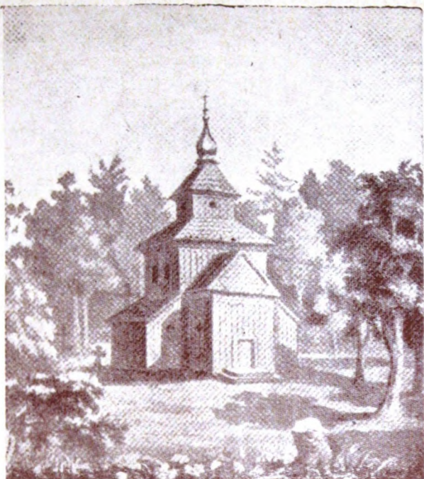
Церква в с. Вербках