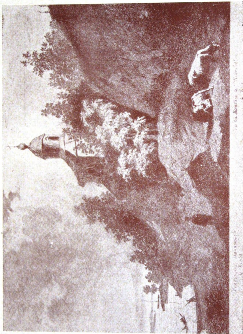
Вышнівський монастир у Києві. 1844 р.