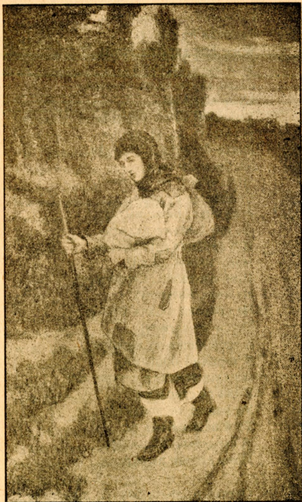
Іде шляхом молодця...