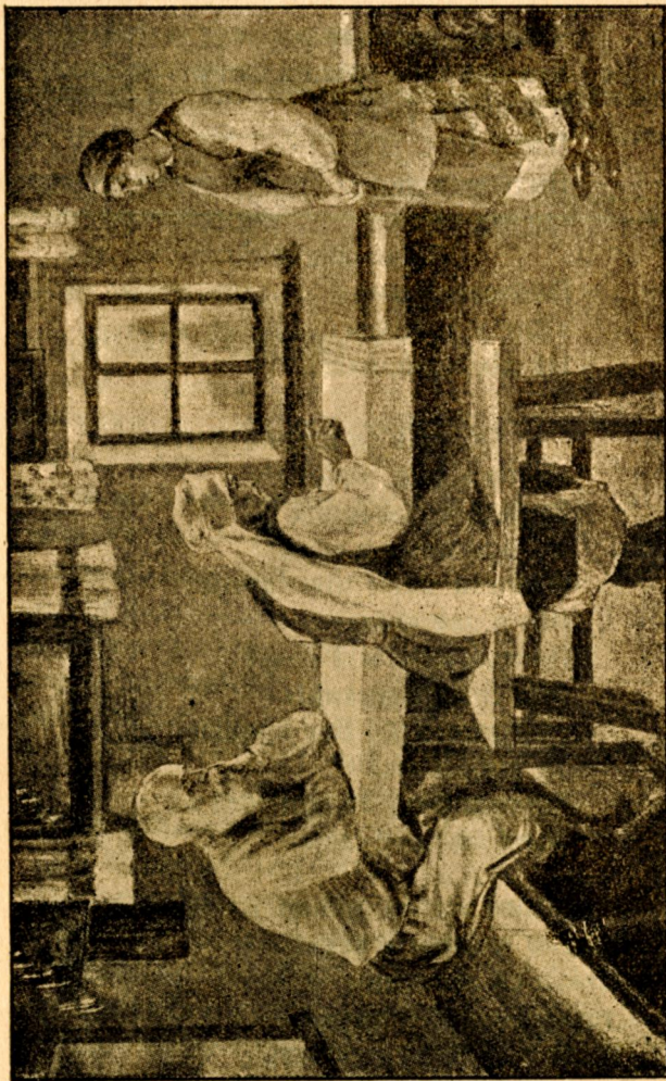
Сидить батько кінець стола...